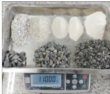
Şekil 2. Agregaların bileşenleri