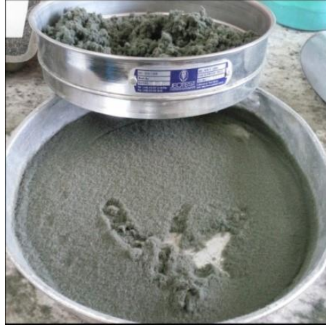
Şekil 4. Tekstil atığı

Çalışmada, Marshall numunelerinin üretimi TMA dizayn kriterlerine göre yapılmıştır (Karayolları Genel Müdürlüğü, 2013; TS EN 12697-34, 2012; TS EN 13108-5, 2016). Bitümlü bağlayıcı ve mineral agrega en az 165 °C'lik, en fazla 180 °C'lik karışım sıcaklığı elde edilecek bir sıcaklıkta karıştırılmaktadır. Tekstil atığı (%0,3-%0,1) ve selüloz elyaf (%0,3-%0,2), 1100 g agrega karışımına ayrı ayrı ilave edilmiştir. Agrega karışımına farklı oranlarda (%5,5-6,0-6,5-7,0) bitüm eklenerek TMA numuneleri üretilmiş numunelerin her iki yüzeyi 50 Marshall darbesiyle sıkıştırılmıştır.