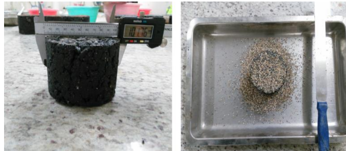
Şekil 5. Kum Yama deneyine ait görüntüler

Çalışma kapsamında kullanılan TMA Tip-1A aşınma tabakası için ortalama doku derinliği 1,0 mm'den fazla olmalıdır (Karayolları Genel Müdürlüğü, 2013). Şekil 5'te Kum Yama deneyinin görüntülerine yer verilmiştir.