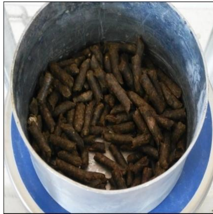
Şekil 3. Selüloz elyaf