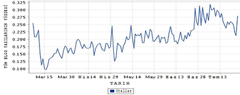
Tablo 6. Blogların Tıklanmasına Göre Eğilim Araştırması (Otel) 2011 (Nielsen Şirketi Verileri)