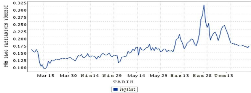
Tablo 7. Blogların Tıklanmasına Göre Eğilim Araştırması (Seyahat) 2011 (Nielsen Şirketi Verileri)

Kaynak: http://www.blogpulse.com/trend?query1=travel&label1=&query2=&label2=&query3=&label3=&days=180&x=52&y=9