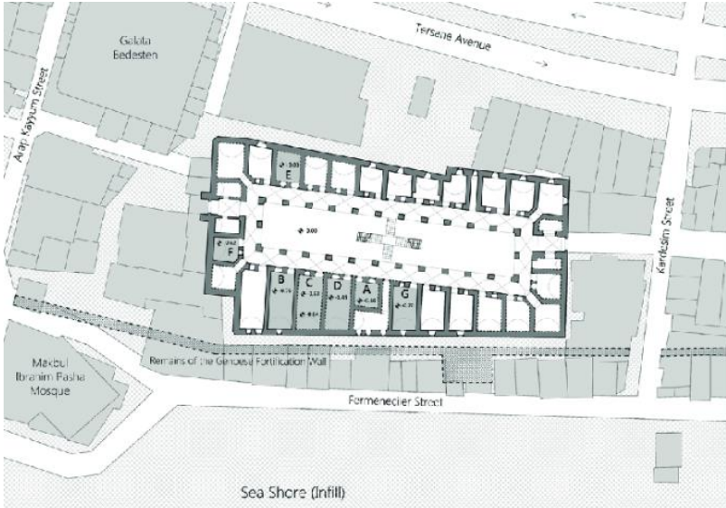
Resim 4: Galata Kurşunlu (Rüstem Paşa) Hanı