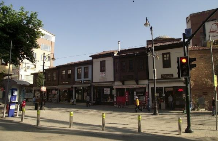
Resim 3: Galle Hanı güney yarısı (en sağda) ve günümüzde dükkân olarak kullanılan cephesi