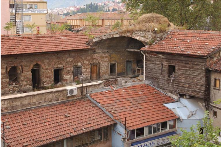
Resim 2: Galle Hanı