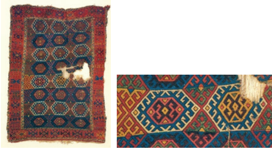
Fotoğraf 6 a-b: 17.yy. Elazığ-Malatya civarı halı ve detayı. İstanbul Vakıflar Halı Müzesi (Müze arşivi)

Fotoğraf 7'de Diyarbakır Çermik Ulu Camii'nden alınan ve Gaziantep Mevlevihane'si Vakıf Müzesinde bulunan 17. yüzyıl ait halı parçasında yanyana ve üst üste altıgenler işlenmiştir. Bunların içerisinde de kenarları kancalı altıgenler ve merkezde karşılıklı koçboynuzları bulunur. Koyu kırmızı, lacivert, sarı ve beyaz renkler kullanılmıştır. Halının tamamında alternatif çözümlerin bağlandığı Türk düğümü bulunur.