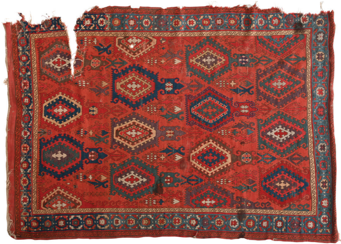
Fotoğraf 9: 17. yy. Şarkışla halısı, Sivas Gök Medrese Vakıf Müzesi (Müze arşivi)

Fotoğraf 9'daki Sivas Şarkışla Büyük Camiinden Sivas Gök Medrese Vakıf Müzesine getirilen 21 numaralı, 213 x 150 cm. ölçülerindeki 17. yüzyıla ait Şarkışla halısında, kaydırılmış eksenlerde yerleştirilmiş altıgenler işlenmiştir. Ancak bu altıgenlerde diğer örneklerdeki altıgenlerden farklı olarak alt ve üst uçlarında farklı uzantılar bulunmaktadır. Genel görünüm olarak diğer halılardan çok farklı olmakla birlikte, altıgenler ortak özellik olarak yer almaktadır. Halının ana bordür deseni ile birbirine bağlı S'lerden oluşan zincir şeklindeki ince bordürü, TIEM'de bulunan Manisa'dan getirilen halının (Fotoğraf 2) bordürleri ile aynıdır. Halının tamamında alternatif çözümlerin bağlandığı Türk düğümü bulunur.