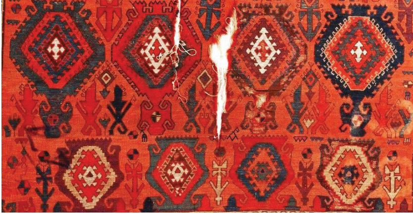
Fotoğraf 14: 17. yy. Şarkışla halısının sırtından görünüş. Sivas Gök Medrese Vakıf Müzesi

Fotoğraf 14'de Sivas Gök Medrese Vakıf Müzesinde bulunan 17. yüzyıla ait Şarkışla halısında, alternatif çözümlerin bağlandığı Türk düğümünün, halının sırtından görünüşü yer almaktadır.