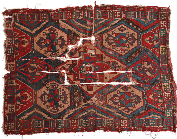
Fotoğraf 11: 17. yy. Şarkışla halısı, Sivas Gök Medrese Vakıf Müzesi

Fotoğraf 11'deki Sivas Şarkışla Büyük Camiinden Sivas Gök Medrese Vakıf Müzesine getirilen, 10 numaralı, 216 x 154 cm. ölçülerindeki, 17. yüzyıl Şarkışla halısında, içi farklı desenlerle dolgulı, çeşitli ölçülerde ve konumlarda altıgenler işlenmiştir. Halının tamamında alternatif çözümlerin bağlandığı Türk düğümü bulunur.