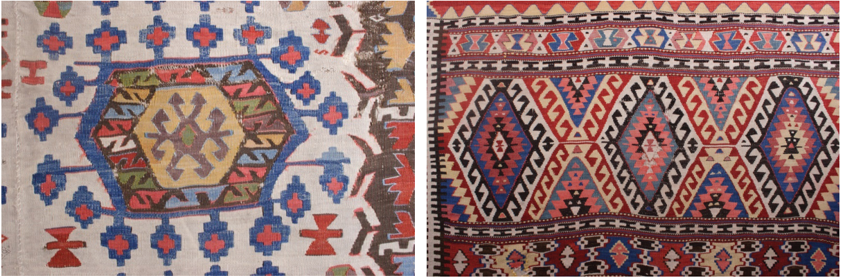
Fotoğraf 15 a-b: Anadolu kilimlerinden detaylar. Ankara Vakıf Eserleri Müzesi (Müze Arşivi)

Kaydırmalı düğümün kullanıldığı halılardaki desenlerin çoğu, Anadolu kilimlerinde de görülür. Örneğin Fotoğraf 15 a-b'de Ankara Vakıf Eserleri Müzesinde bulunan bir Orta Anadolu kiliminde "Türkmen Gülü" veya "göl" denilen altıgen madalyonlar ile aynı müzeden bir Fethiye kiliminde kenarları kancalı baklavalara yer almaktadır. Bu örneklerden de anlaşıldığına göre Anadolu kilimleri ile kaydırmalı Türk düğümü kullanılan halılar arasında büyük oranda ortak yönler bulunmaktadır.