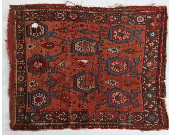
Fotoğraf 10: 17. yy. Şarkışla halısı, Sivas Gök Medrese Vakıf Müzesi

Fotoğraf 10'daki Şarkışla Büyük Camiinden Sivas Gök Medrese Vakıf Müzesine getirilen 29 numaralı, 186 x 146 cm. ölçülerindeki 17. yüzyıla ait Şarkışla halısında, kaydırılmış eksenlerde yerleştirilmiş birbirine bağlı altıgenler işlenmiştir. Buradaki altıgenler Berlin Dahlem Müzesindeki Envanter 1. 46/59 numaralı halı parçasındaki altıgenlere ve Ankara Vakıf Eserleri Müzesindeki 2072 numaralı halıdaki altıgenlerle benzerdir. Halının ana bordürü ise Dahlem'deki halı (Fotoğraf 3), TIEM'deki 291 numaralı halı (Fotoğraf 2) ve Sivas Gök Medrese Vakıf Müzesindeki 609 numaralı Şarkışla halısı (Fotoğraf 8) ile aynı desene sahiptir. Halının tamamında alternatif çözümlerin bağlandığı Türk düğümü bulunur.