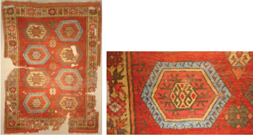
Fotoğraf 8 a-b: 17.yy. Şarkışla halısı ve detayı, Ankara Vakıf Eserleri Müzesi. (S. Bayraktaroğlu)

dalyonlar Türkmen halılarında “göl” motifi olarak adlandırılan sekizgen şeklindeki Salur Gölü motifiyle benzerlik göstermektedir. 21