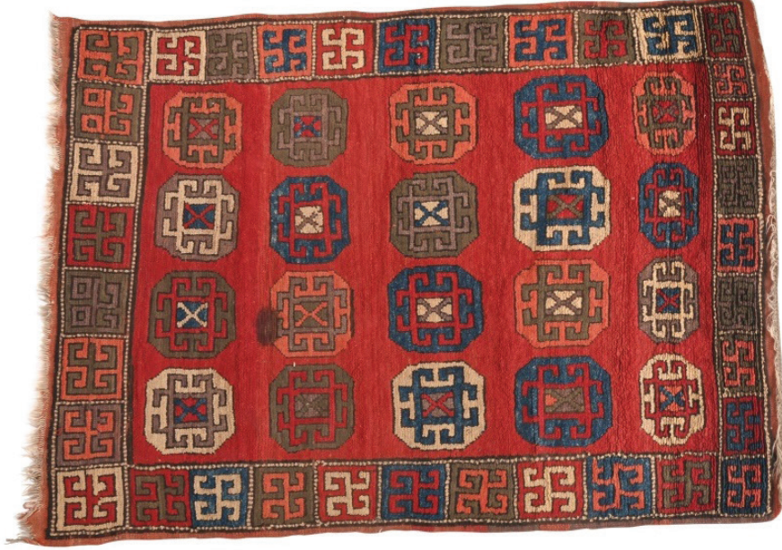
Fotoğraf 12: 17. yy. Şarkışla halısı. Sivas Gök Medrese Vakıf Müzesi

Fotoğraf 12'deki Sivas Şarkışla Büyük Camiinden Sivas Gök Medrese Vakıf Müzesine getirilen, 2 numaralı, 124 x 178 cm. ölçülerindeki 17. yüzyıla ait Şarkışla halısında, içi koçboynuzu desenli, yanyana dört, boyuna beş sıra sekizgenler yerleştirilmiştir. Halının tamamında alternatif çözümlerin bağlandığı Türk düğümü bulunur.