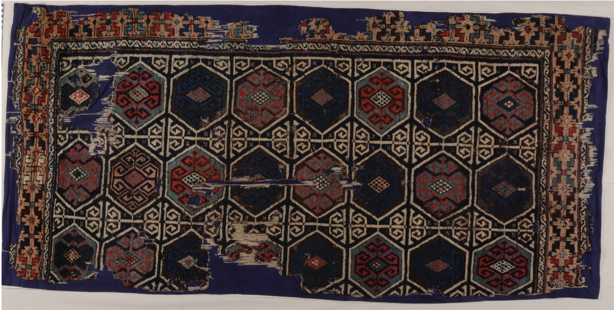
Fotoğraf 2: Batı Anadolu halısı, 18-19.yy. İstanbul Türk ve İslam Eserleri Müzesi

Fotoğraf 2'de İstanbul TİEM'de bulunan 291 envanter numaralı, Manisa'dan getirilmiş, 227x106 cm. ölçülerindeki 18-19. yüzyıl batı Anadolu halısında, koyu renk zemin üzerinde yanyana üç, üst üste sekiz sıra altıgen motif işlenmiştir. Bunların içlerinde dört yöne uzanmış karşılıklı koçboynuzu ve eli belinde motifleri bulunur. Altıgenlerin aralarında kalan boşluklarda beyaz renkli karşılıklı eli belinde motifleri işlenmiştir. Yerinde yapılan incelemede altıgenlerin içlerinde ve birçok yerde alternatif çözümlerin bağlandığı Türk düğümü görülmektedir.