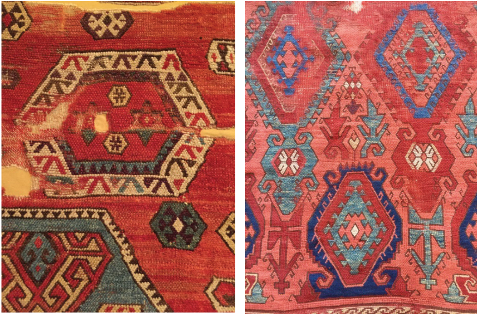
Fotoğraf 13 a-b: 17. yy. Şarkışla halılarından detaylar. Sivas Gök Medrese Vakıf Müzesi (S. Bayraktaroğlu)

Fotoğraf 13 a-b'de Sivas Gök Medrese Vakıf Müzesinde bulunan 17. yüzyıla ait Şarkışla halılarında, alternatif çözümlerin bağlandığı Türk düğümünün halı yüzeyindeki görünüşü yer almaktadır.