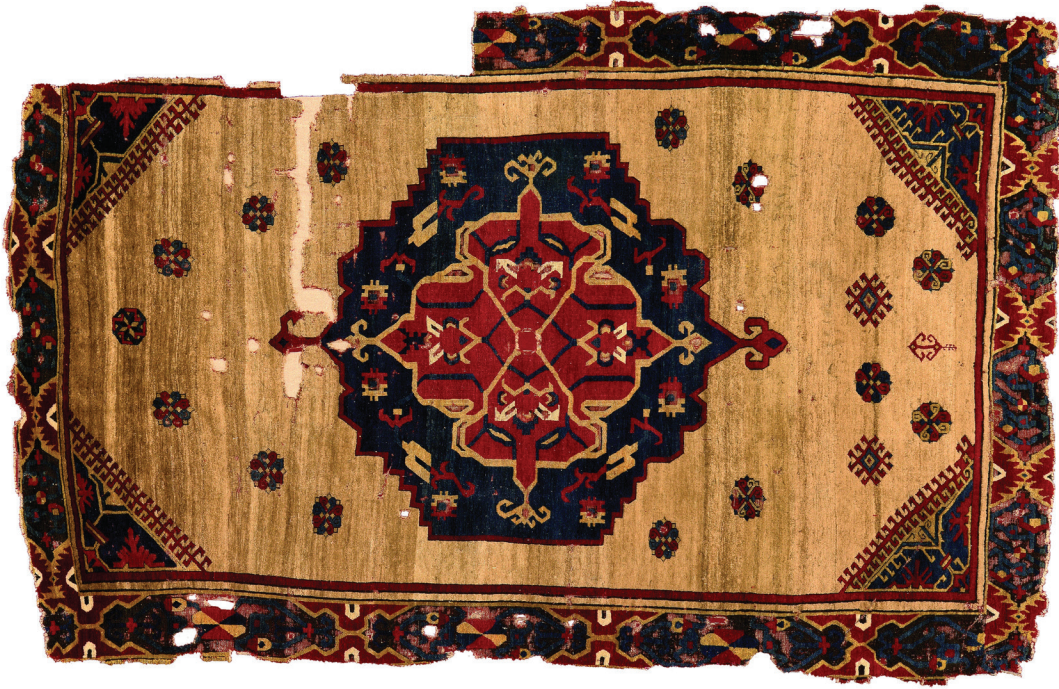
Fotoğraf 5: 16.yy. sonu madalyonlu orta Anadolu halısı. İstanbul Vakıflar Halı Müzesi (Müze arşivi)

Fotoğraf 5'deki, İstanbul Vakıflar Halı Müzesinde bulunan E.22 envanter numaralı, Ankara Vakıflar Galerisinden getirilmiş, 257x161 cm. ölçülerindeki, 16. yüzyıl sonuna tarihlenen madalyonlu halının bazı kısımlarında, özellikle madalyonun içinde kaydırmalı düğüm sıraları yer almaktadır. 17 Hangi camiden alındığı bilinmeyen bu halının Konya Karapınar, Karaman veya Sivas yörelerinde dokunmuş olabileceği ifade edilmektedir. 18 Aynı madalyon şeması ve kaydırılmış düğüm kullanımı 16. yüzyıl Sivas halılarında da bulunmaktadır. Söz konusu halıda, madalyonun içindeki desenler, Konya Karapınar halılarından Salur modeli denilen göbekli Karapınar halılarının 19 18-19. yüzyıl örneklerine de benzemektedir.