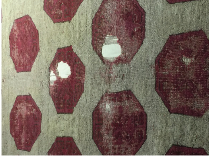
Fotoğraf 1: Devetabanı motifli Selçuklu halısından detay. İstanbul Türk ve İslam Eserleri Müzesi (S. Bayraktaroğlu)

Fotoğraf 2'de İstanbul TİEM'de bulunan 291 envanter numaralı, Manisa'dan getirilmiş, 227x106 cm. ölçülerindeki 18-19. yüzyıl batı Anadolu halısında, koyu renk zemin üzerinde yanyana üç, üst üste sekiz sıra altıgen motif işlenmiştir. Bunların içlerinde dört yöne uzanmış karşılıklı koçboynuzu ve eli belinde motifleri bulunur. Altıgenlerin aralarında kalan boşluklarda beyaz renkli karşılıklı eli belinde motifleri işlenmiştir. Yerinde yapılan incelemede altıgenlerin içlerinde ve birçok yerde alternatif çözümlerin bağlandığı Türk düğümü görülmektedir.