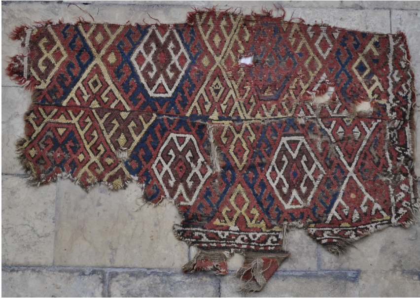
Fotoğraf 7: 17.yy. Malatya civarı halı. Gaziantep Mevlevihanesi Vakıf Müzesi

Fotoğraf 7'de Diyarbakır Çermik Ulu Camii'nden alınan ve Gaziantep Mevlevihane'si Vakıf Müzesinde bulunan 17. yüzyıl ait halı parçasında yanyana ve üst üste altıgenler işlenmiştir. Bunların içerisinde de kenarları kancalı altıgenler ve merkezde karşılıklı koçboynuzları bulunur. Koyu kırmızı, lacivert, sarı ve beyaz renkler kullanılmıştır. Halının tamamında alternatif çözümlerin bağlandığı Türk düğümü bulunur.