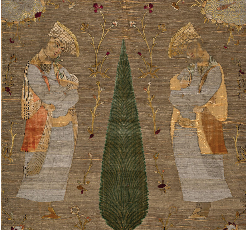
Fotoğraf 20: Tekstil parçası, İpek, kadife, 17. yüzyılın başları, The Art Institute of Chicago, No: 1924.1001, ( https://www.artic.edu/artworks/13882/panel , Erişim tarihi:20.08.2020)

Şah Abbas döneminden kalma kadife kumaş parçasında (Fotoğraf 20) büyük boyutta ele alınmış insan figürü tasarlanmıştır. Bu tasarım, Rıza Abbasi üslubunun etkisini açık ve net bir şekilde önümüze seren bir başka eserdir. Kumaşta ellerinde çiçek tutan genç adamlar görülmektedir. 17. yüzyılda bu tip figürler, İran görsel sanatlarında sıkça işlenmiştir.