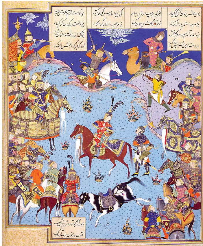
Fotoğraf 7: Mir Müsavver'e atfedilen "Esfendiar savaşta Gorgsar'ı tutuklamış", Şah Tahmasp Şehnamesi'nden bir minyatür, Tehran Museum of Contemporary Art, (Hüseyin-i Rad, 2011: 306)