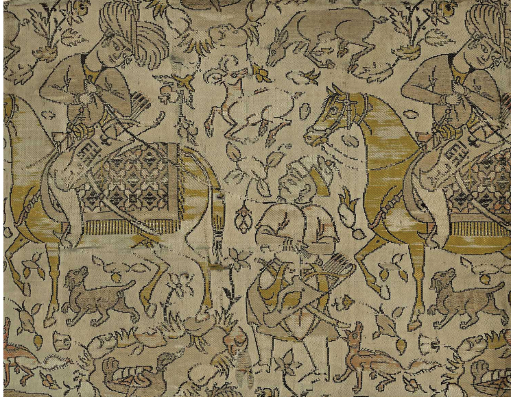
Fotoğraf 6: 17.yüzyılın ilk yarısı, ipek, metal kaplı iplik, The Art Institute of Chicago, No: 1926.1596, ( https://www.artic.edu/artworks/87209/fragment , Erişim tarihi: 15. 07.2021)