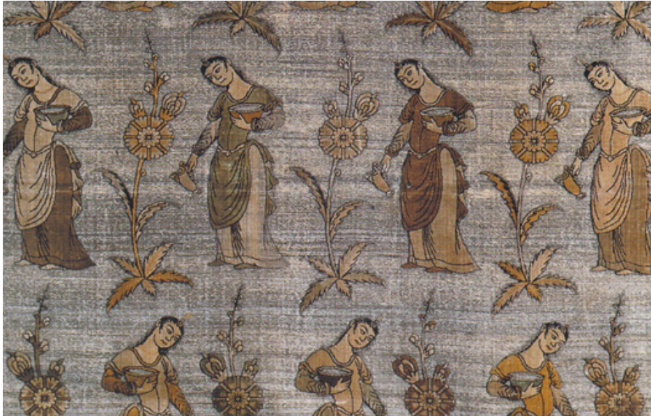
Fotoğraf 8: “İpek Kumaş”, Yazd, 11.yüzyılın ilk yarısı, Krakow Müzesi, 88 × 70 cm (Majda, 2013: 126)

Bu dönemde dokuma sanatçılarının çoğunluğunun da nakkaşlar olduğu anlaşılmaktadır. Tebriz, Yazd ve İsfahan şehirleri Safevi döneminin ünlü nakkaşlarının ürettiği insan imgeleri ve betimleriyle nam salmıştır. Yazd’deki dokuma atölyeleri nakkaşlar tarafından yönetilmiş, dokuma sanatçıları kompozisyon olarak nakkaşların tasarımlarını kullanmışlardır. 19 Böylelikle dokuma sanatçılarıyla nakkaşlar arasında yakın iş birliği oluşmuştur. Dönemin kumaş desenlerine bakıldığında bilhassa insan figürlerinde adeta fırça ile çalışılmışçasına başarılı örnekler ortaya konulduğu görülmektedir (Fotoğraf 8).