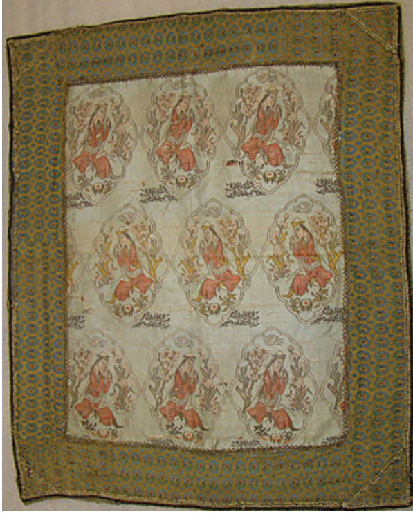
Fotoğraf 9: Moin Müsavver, altın iplikli zeri-atlası, 1641 (H.1051), 81×67 cm, İsfahan, National Museum Of Iran, No: 22626 (Ruhfer, 2001: 56, fig. 20)