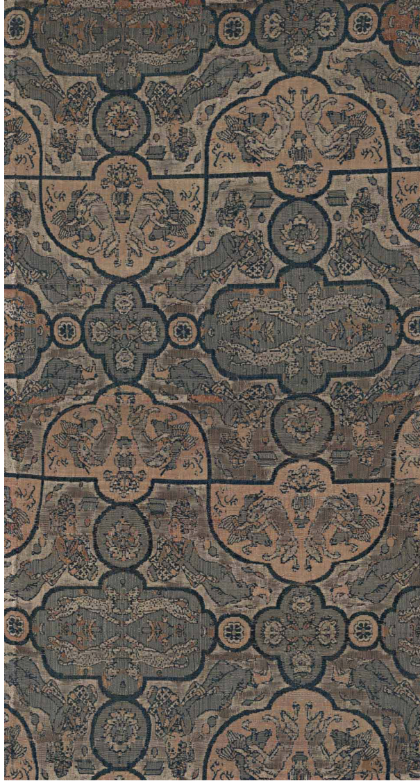
Fotoğraf 12: Giyaseddin Ali Nakışbend, “Figürler, hayvanlar ve bitkilerle tasarlanan kumaş parçası”, ipek, 16. yüzyılın sonları - 17. yüzyılın başları, Yazd, 22.6 × 41.5 cm, Yale Üniversitesi Sanat Galerisi, No: 1937.4626, ( https://artgallery.yale.edu/collections/objects/60785 , Erişim tarihi: 01. 22.2021)

“Şah Abbas Sarayı'nın şair, ressam, mistik ve usta dokumacısı Giyaseddin Ali, tekstilleri imzalarını taşıyan Safevi tasarımcılarının en ünlüsüdür. Bilim adamları onun adını ilk olarak bu yüzyılın başlarında az sayıda ipek üzerinde fark etmiş, o zamandan itibaren de kumaşları şimdiye kadar yapılan en iyi İran tekstilleri arasında yer almıştır. Uzanmış beyler, kazlara saldıran tilki, çitalarla yüzleşmek, aslan kafaları ve çeşitli bitki biçimleri, Giyas'ın zamanında çok popüler olan tekstil desenlerini oluşturan tipik unsurlardır. Ancak bu tasarımda Giyas, motifleri resimsel olmayan bir alan içinde ustaca düzenlemiştir. Bu tür zarif ipeklerde eğrisel bölmelerin kullanımı alışmadığımız bir durumdur ve dönemin bahlarından alınmış ve esinlenmiş olabilir”. 26