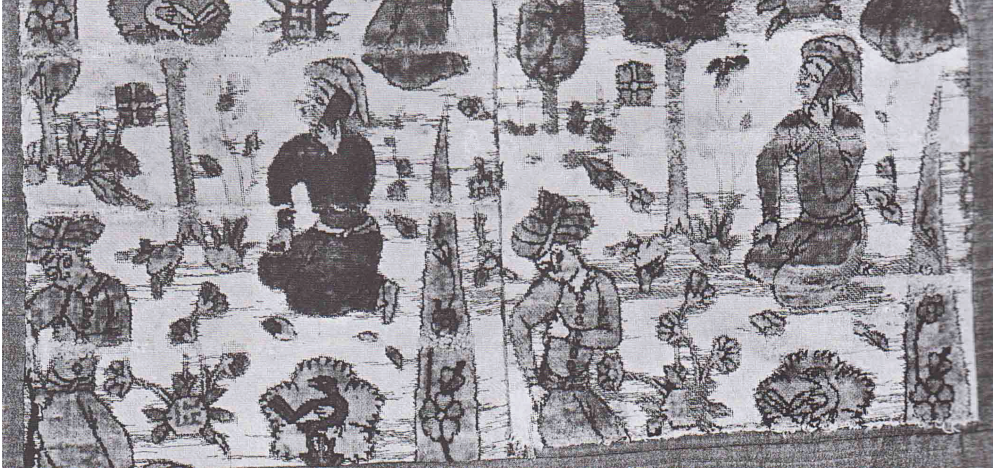
Fotoğraf 11: Giyaseddin Ali Nakışbend, “Giyas imzalı metal iplikli kadife”, Yazd, 1592 (H.1000) (Pope, 2008: 1038)

Giyas'ın dokuduğu kumaşlarda karşımıza çıkan desenler ve konular arasında şu örnekler sıralanabilir: Romantik ve aşk konulu temalara sahip sahneler, küçük ve zarif insan tiplmeleri, uzun ve ince tomurcuklar ve çiçekler, badem formlu palmiye yaprakları, dairesel lotus, aslan yüzlü palmiye yaprakları, taç şeklinde süslemeler, simetrik dallara sahip bitki motifleri, koşan çita ve benzeri hayvan figürleriyle kazlara saldıran tilki vb. hayvanlar (Fotoğraf 11). Giyaseddin Ali Nakışbend'in himayesinde oluşan okulda, kumaş desenlerinde genellikle küçük ve birbiriyle uyumlu olan bir tasarım üslubunun ortaya konduğu görülmektedir.