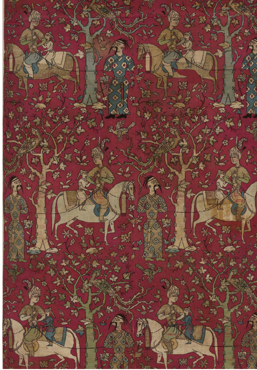
Fotoğraf 3: “ Gürcü esirin önünde giden Safevi şehzadesi ”, 16.yüzyılın ortaları, ipek, metal kaplı iplik, Metropolitan Müzesi, No:52.20.12 ( https://www.metmuseum.org/art/collection/search/451092?searchField=All&sortBy=Relevance&ft=safavid+art&offset=0&rpp=20&pos=2 , Erişim tarihi: 10. 08.2020)

Safevi döneminden günümüze ulaşan kumaşların çoğunun kompozisyon anlayışı ile tasarım ve motiflerinde dönemin nakkaşlarının etkileri tahlil edilebilmektedir. Bu dönemin kumaşlarında özellikle de Behzad, Sultan Muhammed, Muhammed Heravi, Mir Musavver, Mir Seyyid Ali, Muhammedi, Şah Muhammed, Muzaffer Ali, Rıza Abbasi ve Şafi Abbasi gibi nakkaşlarla onların talebeleri tarafından minyatür yöntemlerinin uygulandığı anlaşılmaktadır. 16. yüzyıl Safevi ipek dokuma örneklerinin mükemmel örneklerinden bazıları New York Metropolitan Müzesi’nde muhafaza edilmektedir. Bu örneklerden biri olan 16. yüzyıla ait bir dokumada bir Safevi şehzadesi resmedilmiştir (Fotoğraf 3). Kompozisyonda, şehzade at üstünde, arkasında bir çocuk ve bir esir figürüyle ağaç ve kuş detaylarının yer aldığı bir tabiat ortamı tasvir edilmiştir.