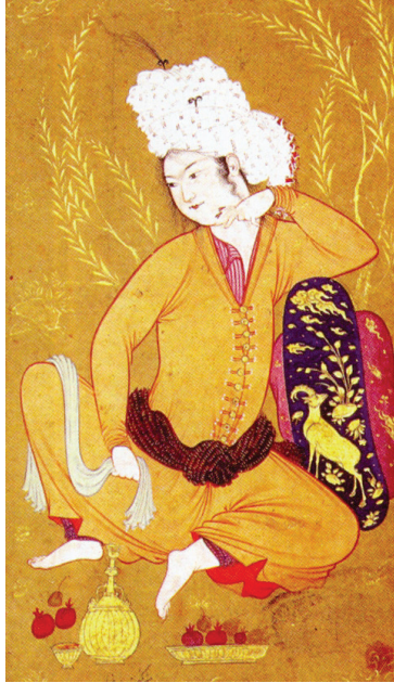
Fotoğraf 14: Aga Rıza imzalı minyatür (Rıza Abbasi), "Çıplak ayakla oturan genç adam", İsfahan (Aşrafî, 2017:199, fig. 59)

Giyas'ın dokuduğu kumaşlar üzerindeki insan figürlerini Rıza Abbasi'nin tek sayfalık minyatürlerindeki figürlerle karşılaştırdığımızda (Fotoğraf 13-14) etkinin yoğunluğu açıkça görülebilmektedir. Bu figürleri betimleme becerisi o kadar güçlüdür ki, bizzat Rıza Abbasi'nin kendisinin çizdiği fikrini akıllara getirmektedir. Yastığa yaslanan, eğlenen ve şarap içen tipler Rıza Abbasi'nin resimlerinde de görülen ortak konulardır. Ancak bu figürler, kumaş üzerindeki bölmelere yerleştirilmiş ve tasarıma göre de değişime uğramaları mümkün olmuştur.