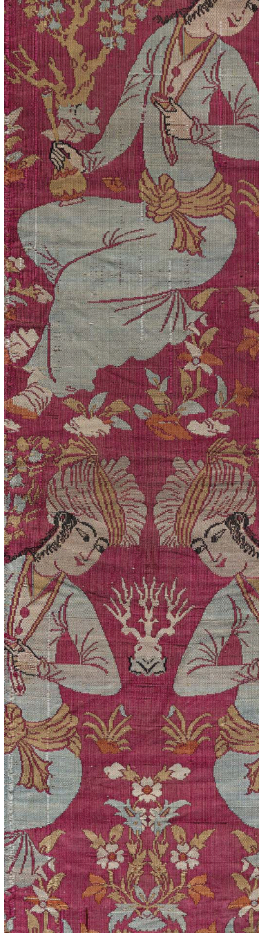
Fotoğraf 15: “İçki İçen Bir Genci Gösteren Tekstil Parçası”, 40.3 × 11.7 cm, 17.yüzyılın başları, Yale Üniversitesi Sanat Galerisi, No:1937.4777, ( https://artgallery.yale.edu/collections/objects/61417 , Erişim tarihi: 10.08.2020)

İsfahan okulunun minyatür üslubu, daha çok kadife kumaşlar ve altın iplikli zeri kumaşlarda karşımıza çıkmaktadır. Erken Safevi döneminde (II. Tebriz Okulu), bahçe manzaraları yaygın olmasına rağmen, yavaş yavaş bu bahçelerdeki insan figürleri etkileyici bir görünüm kazanmaya başlamıştır. 17. yüzyılda pahalı kumaşların desenlerinde dinlenen ve rahat bir pozisyonda betimlendiği gözlenen insan tipleri, Rıza Abbasi'nin minyatürlerinde gördüğümüz insan tiplerini anımsatmaktadır (Fotoğraf 15).