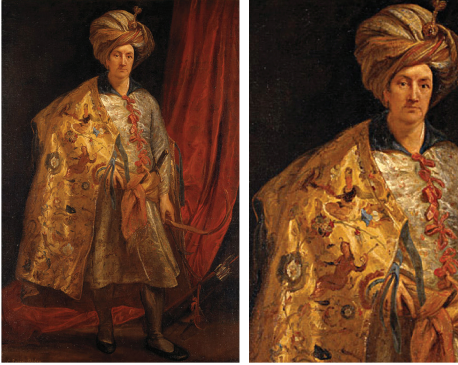
Fotoğraf 1: Anthony Van Dyck, “Robert Shirley’nin portresi”, 1622, Tuval üzerinde yağlı boya, Petworth House, Sussex, England. No: NT 486169, ( http://www.nationaltrustcollections.org.uk/object/486169 , Erişim tarihi: 25.01.2021) Fotoğraf 2: Fotoğraf 1’den bir detay

Safevi döneminde, Avrupa ülkelerine elçilerle gönderilen diplomatik hediyeler için, Şah’ın İsfahan atölyelerinde dokunan kumaşları tercih ettiği bilinmektedir. 10 1609’da Şah Abbas’ın emriyle Sir Robert Shirley 11 İngiltere İnan büyükelçiliği adına çeşitli diplomatik görevlerde bulunmuş, İngiltere kralı ve diğer Avrupa saraylarına İnan giysisi ve kızılbaş türbanıyla gönderilmiştir. Sir Robert Shirley’nin giydiği bu kıyafetler Avrupalılar üzerinde derin bir tesir bırakmıştır. Ressam Anthony Van Dyck (1599-1641) tarafından 1622’de Roma’da yapılan portresinde Sir Robert, üstündeki işlemeli kaftanı ve peleriniyle geleneksel Safevi erkek giysileri içinde gösterilmiştir (Fotoğraf 1-2).