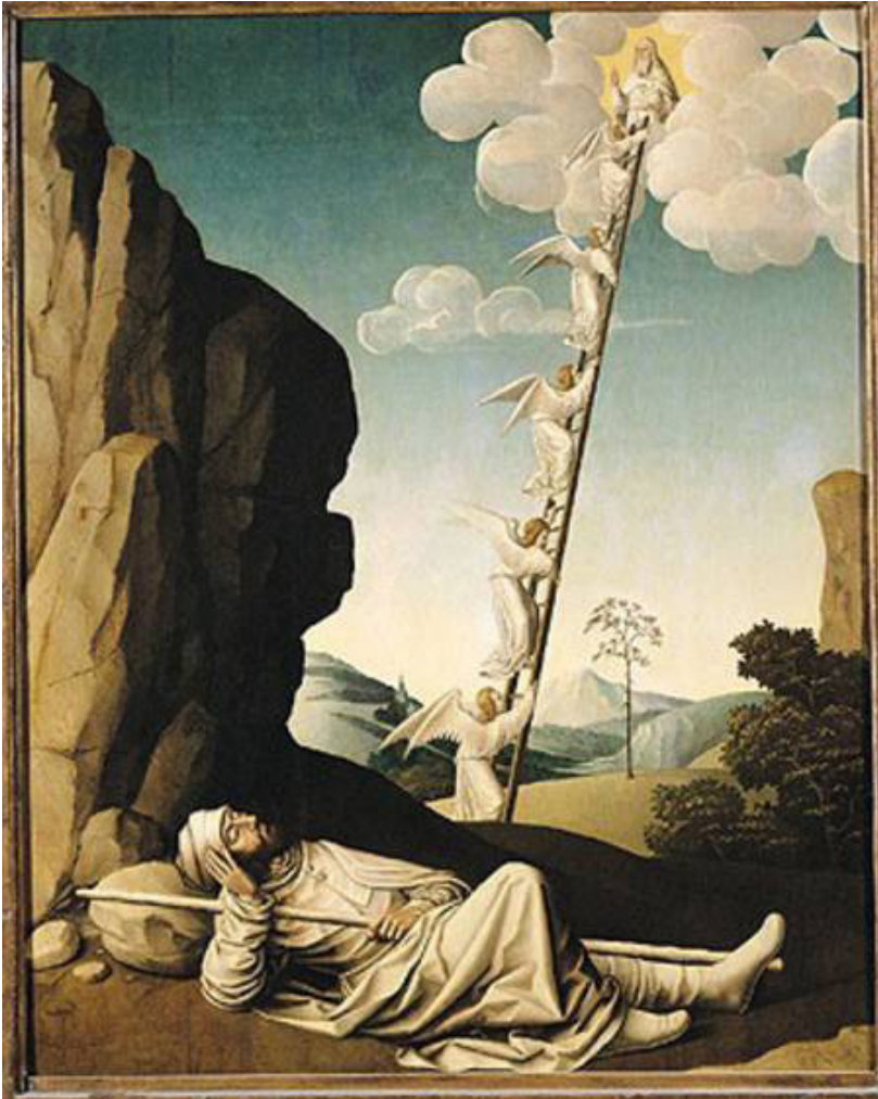
Jacob's Ladder 1490, by French School, Musée du Petit Palais, Avignon, France

Mîtosa jêhelbûnê yanî mi'rac, wek seferên metafîzîk di metnên dînî/edebî de hatine dubarekirin. Mirov dikare bibêjît ku mîtosên cuda yên li dor seferên metafîzîk, di nava eskatolojiya Islamî de guherîne û ji nû ve hatine saz kirin. Bi vî şiklî hevpariyê xurt di navbera wan mîtosan de çêbûye. Bo numûne di çanda Muslimanan de pîreya Siratê "ji mû ziravtir û ji şûr tîjtir" e ku li gor Nejad Keyayî, bîngeha vê teşbîhê diçite heta Ardavîrafnameyê (Özbek Arslan 2019: 425). Navê pîra Siratê di Qur'anê de derbas nabî, lê ew [pîra Çînvadê] û fikra vejîna axretê, Cennet û Cehennem ji Zerdeştîyê derbasê Cihûtî û Muslimantiyê bûne (Çiğ 2005: 23). Herwisa di bawerîya Islamê de yek ji şertên îmanê jî "bawerîpê'nana axretê" ye. Yanî bawerîya li ser alema din, xaleke esasî ye. Ji ber wê jî jiyana axretê, wek rastiyeke qet'î tete zanîn ku di metnên dînî de, çûna Cennet