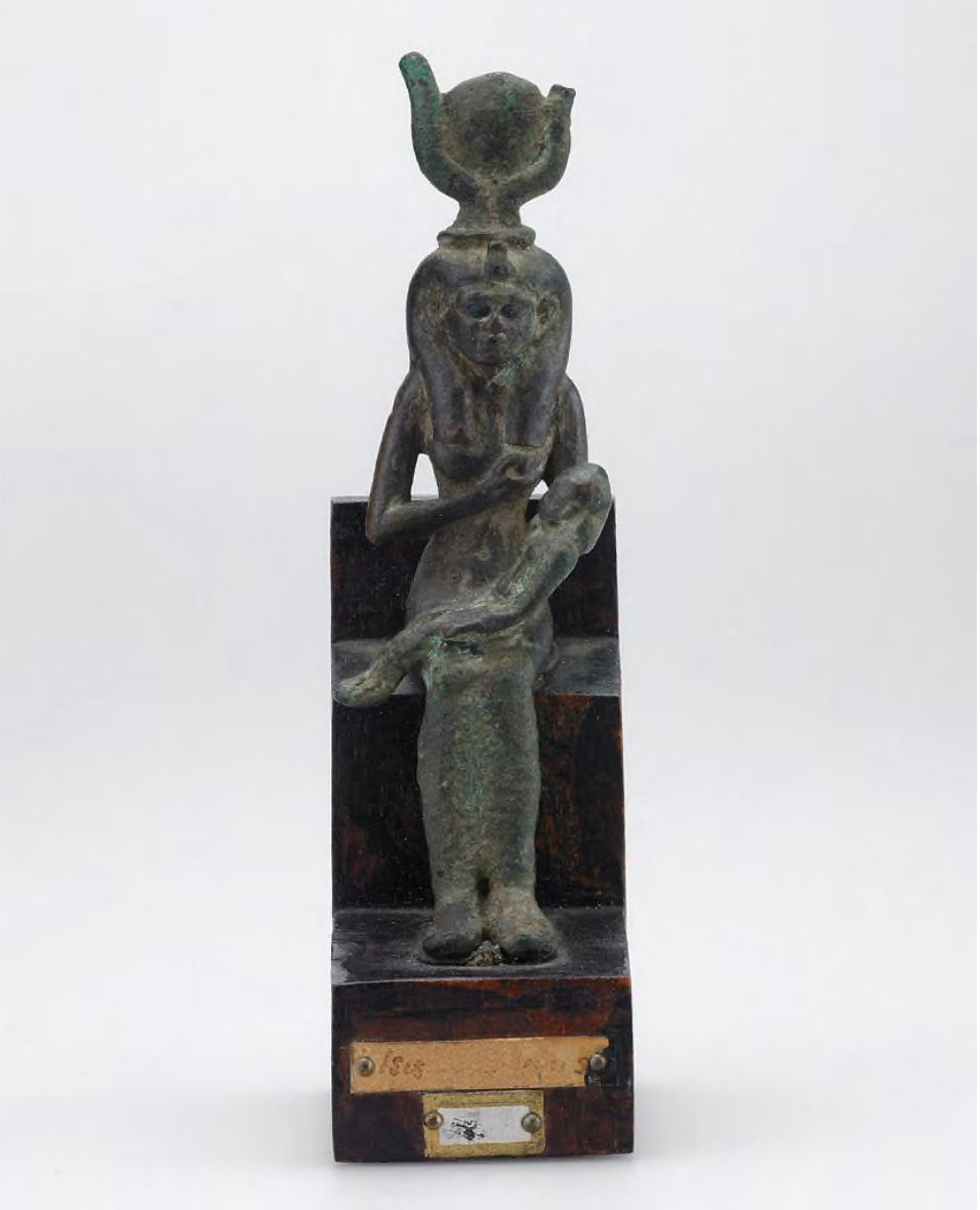
Îsîs û Horus , mid 7th-late 1st century BCE, Harvard Art Museums

Îsa Pêxember û dayîka Meryemê de hevbandiyek ligel ya Îsîs û Horusê heye. Gava mirov li ser wan mîtosan li destpêka varyantên Cincime Siltanê yên Kurdî vedigerit ku ew çarçoveya di serî de ihtimalen peywendî ligel wan mîtosan heye.