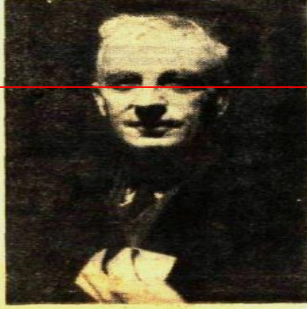
Arnold Toynbee dün gece uçak meydanında