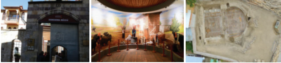
Fotoğraf 4: Katıphan ve Üdürgücü Konağı 2000 Yıllık Anıt Mezar Detayı

Uluganlıgil ve Altunkasa (2020)'nin şehrin mekânsal kimliğinin belirlendiği çalışmalarında Kocabaş Konağı (%19,5), Deli Gönüllüler Konağı (%17, 05) kentin mekânsal bütünlüğü bağlamında bireyler tarafından yüksek düzeyde algılanan imge elemanları, Zabun Konağı (%16,7) ve Dedeoğlu Konağı (%13,55) orta düzeyde temsil eden imge elemanları, Arslanbey Konağı (%7,4) ise düşük düzeyde imge elemanları olan kent kimliğini oluşturan önemli öğeler olarak tespit edilmiştir.