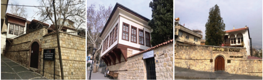
Fotoğraf 1: Deligönüllüler Konağı, Maraş Kültür Evi ve Etnografya Müzesi, Kocabaş Konağı

camii, hamam, medrese, çeşme ve tekkelerle birçok tarihi ve kültürel eser bulunmaktadır (Gökhan 2001; Eyicil 2001). Kurtuluş savaşında Sütçü İmam'ın ilk kurşunuyla birlikte direniş hareketini başlatıp 12 Şubat 1920'de kendi şehirlerini kurtaran önder kentlerden biri olmuştur. Kente 5 Nisan 1925'de kırmızı şeritli istiklal madalyası, 7 Şubat 1973'te de kahramanlık unvanı verilmiştir. 1980'den sonra tüm Türkiye'de uygulanan sanayi teşviklerinin Kahramanmaraş'ın da gelişip büyümesinde büyük etkisi olmuştur. Şehrin tarım ve sanayi potansiyelinin yüksek olması ekonomik anlamda bölgenin bir cazibe merkezi olmasına katkıda bulunmaktadır. Özellikle kırmızıbiber ve pamuk üretimi önem taşımaktadır. Tekstil sektörü ülke ve dünya ölçeğinde çok gelişmiştir. Coğrafi ürünler listesinde yer alan Dondurma başkenti olarak anılmaktadır. Kentte geçmişten günümüze nüfusun gittikçe arttığı görülmektedir. Kahramanmaraş il nüfusu 2019 yılına göre 1.154.102'dir. Bu nüfus %50,83'ü erkek, %49,17'si kadındır. Günümüzde Büyükşehir belediyesi olduğu için kent merkezini oluşturan Onikişubat ilçesi 2019'da 431.848 nüfusa sahip, (216.131'i erkek, 215.717 kadın) Dulkadiroğlu ilçesi ise 222.673 nüfusa sahiptir (114.229'i erkek, 108.444 kadın) (TÜİK 2020).