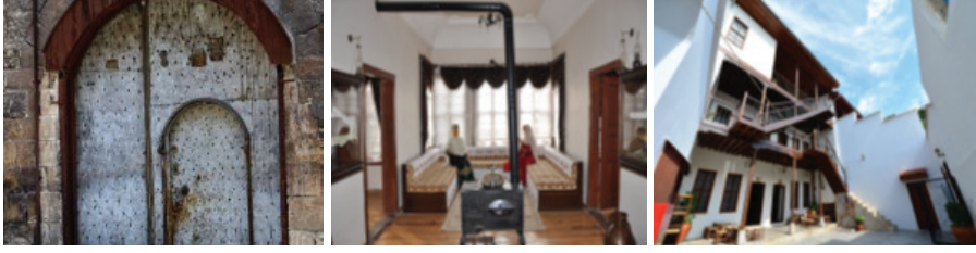
Fotoğraf 3: Çiftaslanlar Konağı Kapı Detayı, Mahmut Arif-i Paşa Konağı Oturma Odası Detayı ve Dedeoğlu Konağı İç Avlu Detayı

açılmıştır (İl Kültür ve Turizm Müdürlüğü 2020; Polat 2017; Büyükşehir Belediyesi 2020).