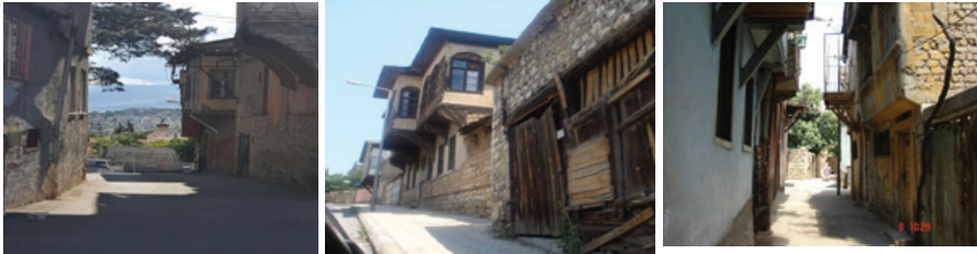
Fotoğraf 5: Dulkadiroğlu İlçesinde Dar Sokaklar Arasında Kalmış Olan Tarihi Konutlar https://mapio.net/pic/p-15205393/