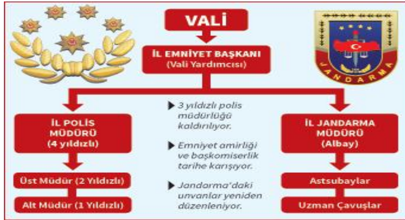
Şekil 2: Değiştirilmesi Planlanan İl Emniyet Başkanlığı Yapısı

- İl jandarma müdürü albay olacak, JGK'nın subay sınıfı Kara Kuvvetleri Komutanlığı'na devredilecek, il jandarma müdürlüğünde astsubay ve uzman çavuşlar görev yapacaklardır.