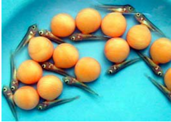
Şekil 6. Anaçtan ayrılan arowana larvaları (Suleiman, 2003)

tarafından balığın ağzı açılarak yapılabilir (Şekil 7) veya yavruların doğal olarak çıkması beklenir. Tercih edilen yöntem kısmen ebeveynlerin davranışlarına bağlıdır. Eğer yavrularına bakıyorsa, doğal metot tercih edilir dolayısıyla ebeveynlere verilen zarar azaltılır. Fakat yavruları yeme belirtileri gösteriyorlarsa yavrular ebeveynin ağzından çıkarılır. Bu yavru balıkların uzaklaştırılması iki yumurtlama dönemi arasındaki zamanı kısaltır (Christoper ve Brown, 1995).