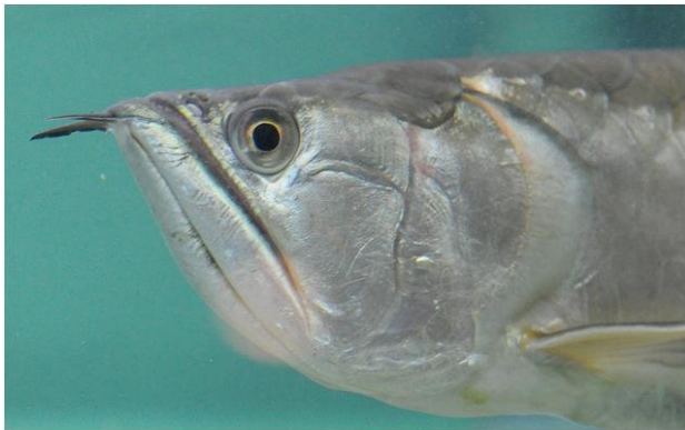
Şekil 2. Arowanın alt dudağının altında bir çift bıyığı (Anonim, 2010c)

Doğadaki renkleri yeşilden kırmızıya kadar değişen tüm parlak renkleri içerir. Düz ve geniş bir vücudu olan arowanın alt dudağının altında bir çift bıyığı bulunmaktadır (Şekil 2). Alt dudağına bağlı bulunan iki bıyığını, avın su yüzeyindeki hareketlerini algılamakta kullanır.