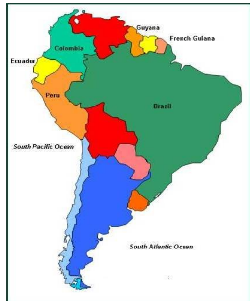
Şekil 1. Arowana balığı ( O. bicirrhosum )'nın doğal yayılım alanı (Anonim, 2010b)

Güney Amerika'da, Kolombiya, Ekvator (Ferraris, 2003), Peru (Ortega ve Vari, 1986), Guyana (Anonim, 1996), Fransız Guyanası Brezilya'daki Amazon Nehri havzasında, Rupununi ve Oyapock Nehirleri gibi su kaynaklarında yayılım göstermektedir (Şekil 1) (Planquette ve ark., 1996).