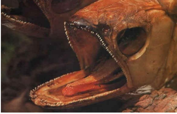
Şekil 4. Arowana balığının kemiksi dili (Anonim 2010g)

avlanırken avının vücudunu bir yay gibi sarar ve daha sonra onu ileri doğru fırlatarak ağzının içine alırlar (Marchoja ve ark., 2006).