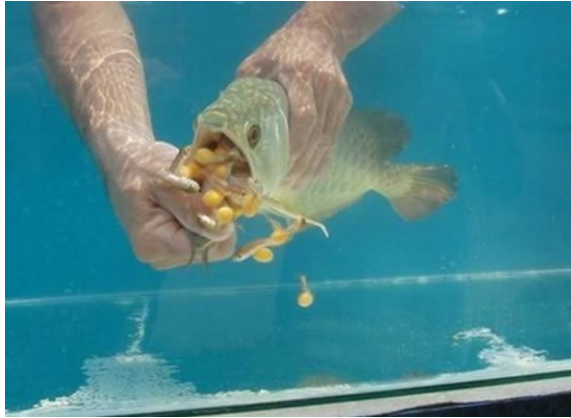
Şekil 7. Arowana larvalarının ağızdan çıkarılması (Suleiman, 2003)

Arowana yavruları yetişkin artemia gibi canlı yemlerle hızlıca gelişir. Yavruların yoğun stoklanması rekabet ve stok kayıplarına yol açabilir, bu yüzden geniş yerlerde yetiştirilmelidir. Büyük balıklar oldukları için geniş ve stok yoğunluğu az olan tanklar veya havuzlar tercih edilmelidir (Christoper ve Brown, 1995).