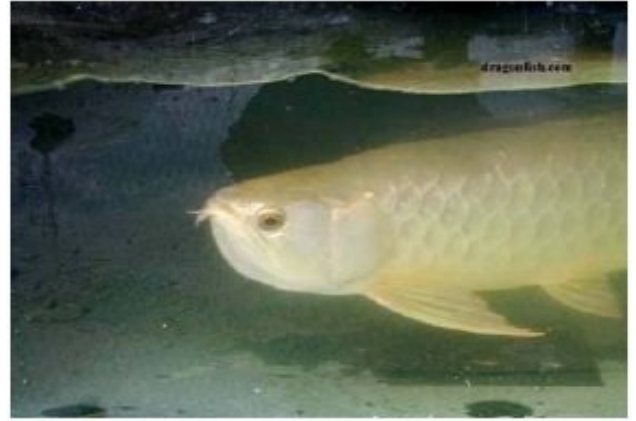
Şekil 5. Ağız yumurta ile dolu erkek arowana (Anonim, 2010e)

hareket ederler. Dişi hazır olduğunda yumurtalarını yavaş akıntılı nehir yataklarına döker. Daha sonra bu yumurtalar erkek arowana tarafından döllenir. Dölleme işleminden sonra erkek arowana yumurtaları ağız kısmına alır (Şekil 5) (Marchoja ve ark., 2006).