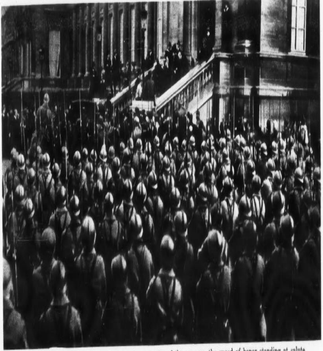
The President arriving at the Quai d'Orsay for a session of the congress, the guard of honor standing at salute

Ek-3: ABD Başkanı Wilson, Paris Barış Konferansı'nın yapılacağı binaya giriş yaparken (Current History, Vol. X, Part. I, No. I, April 1919)