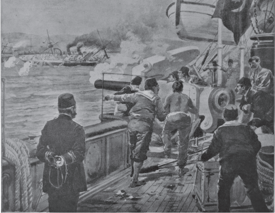
Çizim 3: Hamidiye Kruvazörünün Şingin Limanı'nı Bombalaması 23

kruvazörünün Adriyatik Denizi'ne gerçekleştirdiği harekât ve Şingin limanını bombalaması Osmanlı donanmasının Balkan Savaşı'ndaki elde ettiği en önemli başarılarından birisi olup hareketin kusursuz bir şekilde uygulanması savaştan önce tüm Osmanlı kıyılarını abluka altına almayı planlayan Yunan donanmasına da bir ders niteliğinde olmuştur. Yunan donanmasının bu harekât öncesinde Hamidiye kruvazörünün nerede olabileceğine dair net bir bilgisinin olmadığı anlaşılacakla birlikte bu donanmanın Adriyatik Denizi'nde müttefikleri için gerçekleştirdiği askeri sevkiyatı da Korfu adasındaki sınırlı sayıda savaş gemisinden oluşan bir filo ile de koruyamayacağı görülmüştür. Her ne kadar bombardımandaki tahribatın kapsamı sınırlı olmuş olsa da hareket esnasında Hamidiye kruvazörünün hiçbir Yunan savaş gemisine yakalanmaması ve hasar almadan da İskenderiye limanına ulaşabilmesi kayda değer bir başarı niteliğinde olup elde edilen bu başarı Averof zırhlısını Çanakkale Boğazı önünden çekmeyerek Hamidiye kruvazörünü torpidobot ve muhriplerle baskı altında tutabileceğini düşünen Yunan donanmasında maddi hasara ve müttefikleri nazarında prestij kaybına neden olmuştur.