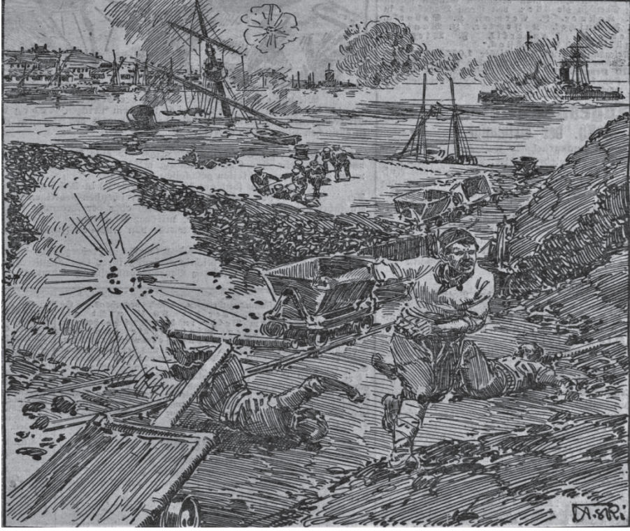
Çizim 1: Hamidiye Kruvazörünün Sirois Deniz Üssünü Bombalaması 8

Hamidiye kruvazörü Siros Adası 'nı bombaladıktan sonra Averof zırhlı kruvazörünü Çanakkale Boğazı'ndan bir an önce çekebilmek amacıyla önce Girit Adası'na yönelse de ardından Doğu Akdeniz'de Beyrut Limanı'na gitmiştir. 9 Yunan donanmasının baskısı nedeniyle bölgede çok fazla kalamayan Hamidiye kruvazörü, Bahriye Nezareti ile de koordineli bir şekilde 19 Ocak 1913 tarihinde Port Said Limanı'na ardından da Kızıldeniz üzerinden Cidde Limanı'na ulaşmıştır. 10 Cidde limanında tamiratını yapıp kömürünü de almasının ardından 8 Şubat 1913 tarihinde Akdeniz'e çıkmak üzere bölgeden ayrılan Hamidiye,