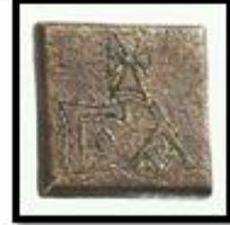
Kat. No. 15