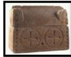
Kat. No. 24