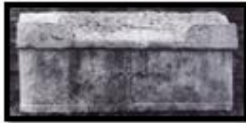
Kat. No. 19