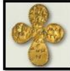
Kat. No. 17