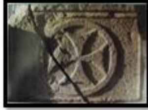
Kat. No. 2