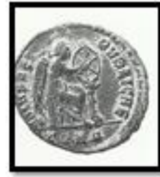
Kat. No. 6