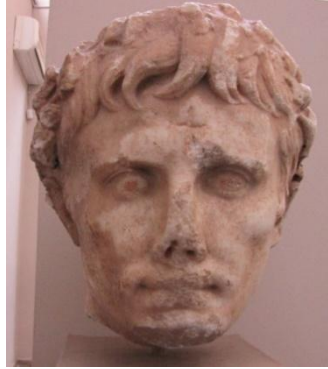
Şekil 1.4: Augustus başı, Ephesos-Ark. Müz, Env. 1891

Chrysostomos çocukların boyunlarına çan asma geleneğine karşı, yalnızca haçın nazara karşı koruyabildiği görüşünü belirtmiştir 1 . Yeni doğmuş bebeklerin üzerindeki nazarı uzaklaştırmak için muska tipi yuvarlak madalyonlar takılmıştır. Buna örnek olarak Sicilya'da bulunmuş olan MS 6.-7. yüzyıllara ait madalyon gösterilebilir 2 . Madalyonun ön yüzünde stilize bir yılanbaşı yer alırken kenarı boyunca henüz çözülememiş bir yazıt yer almaktadır. Ayrıca, bir betime (portre, heykel vs.) verilen herhangi bir zararın, orada tasvir edilen kişiye doğrudan etkisi olacağı veya zarar vereceği inancı, hem çok tanrılı dönemde (Grek-Roma), hem de Hristiyanlık'ta yaygın idi. Bir imparatorun veya kişinin heykelinde saklı olduğu düşünülen bu demonik güçleri kovmak için alınına veya yüzüne haç çekilmekteydi. Böylece haçın koruyucu gücüyle demonik güçlerin hem heykel sahibine, hem de başkasına etki etmesi önlenmekteydi. Buna örnek olarak Selçuk Müzesi'nde yer alan Augustus ve Livia portrelerinin alınlarına kazınmış haç işaretlerini verebiliriz ( Bkz. Şek. 2.1-2.2 ). Benzer bir uygulama vaftizde de görülmektedir. Katekümenler alınlarına haç çizilerek kutsal suya batırılmaktadır. Tüm bu alna çizilen güçlerin sembolü olan haçın kullanım sebebi gayet açıktır ki insanlar şeytanlardan korkmuş ve şeytanların yaklaşmalarından korunmaya çalışmışlardır 3 .