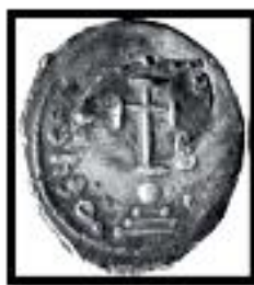
Kat. No. 8