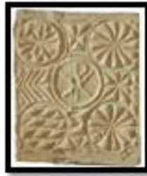
Kat. No. 5