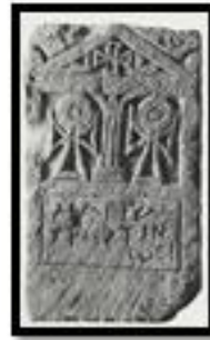
Kat. No. 11