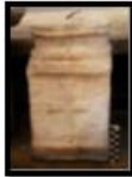
Kat. No. 23