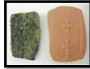
Kat. No. 21