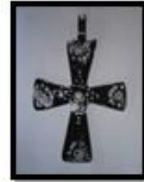
Kat. No. 18