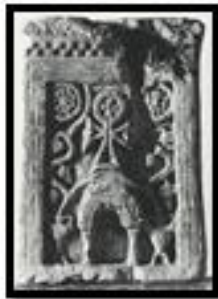
Kat. No. 10