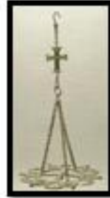
Kat. No. 20