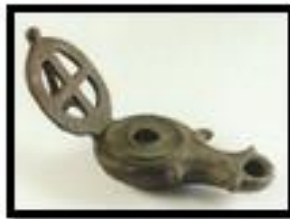
Kat. No. 22