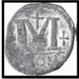
Kat. No. 7