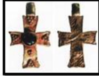
Kat. No. 14