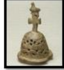
Kat. No. 3