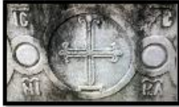
Kat. No. 16