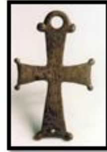
Kat. No. 12