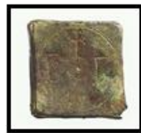
Kat. No. 9