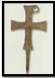
Kat. No. 4