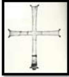
Kat. No. 13