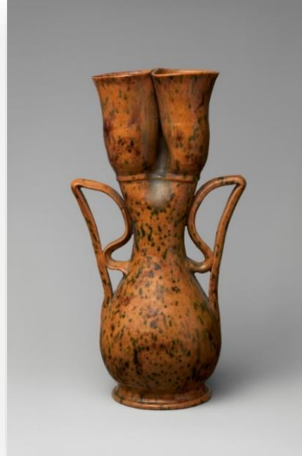
Fot. 2: George Edgar Ohr, Vazo, yaklaşık 1895-1905, 26 cm, Env. No: 2017.444.1, New York Metropolitan Müzesi (URL-14)