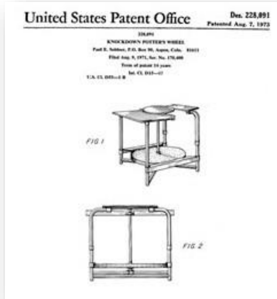
Fot. 10: Paul Soldner, çömlekçi ekipman patent belgesi, (URL-22)