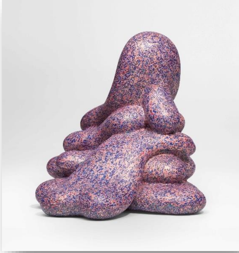
Fot. 15: Kenneth Price, Izzy , 2005, 34 x 33 x 33 cm., Londra'daki Christie's Müzayede Evi aracılığı ile 7 Mart 2018'de 150,000£'a satıldı. (URL-27)