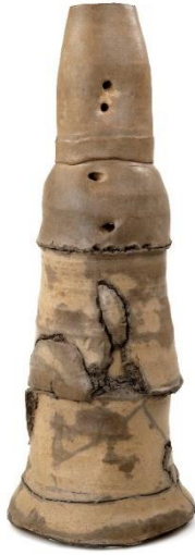
Fot. 7: Peter Voulkos Eser adı: Bir delik (Hole in One), 1978, Renwick Galerisi, Boyutlar 110,5 x 41,9 cm, (URL-19)