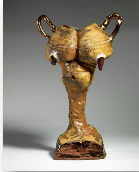
Fot. 12: Robert Arneson, Göğüs Kupası, 50. 2 x 29. 9 x 20. 4 cm. 1964, stoneware, sır, akrilik boya ve oksitler, Smithsonian Amerikan Sanat Müzesi (URL-24)