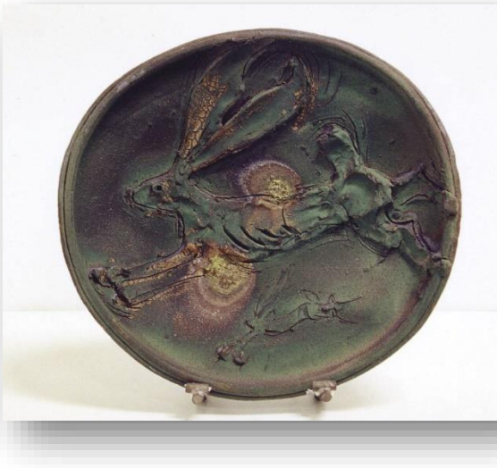
Fot. 13: Ken Ferguson, Tavşan Tabak, 1998, krom astarlı seramik 52 cm, Frank Llyod Gallery, Pasadena Kaliforniya (URL25)