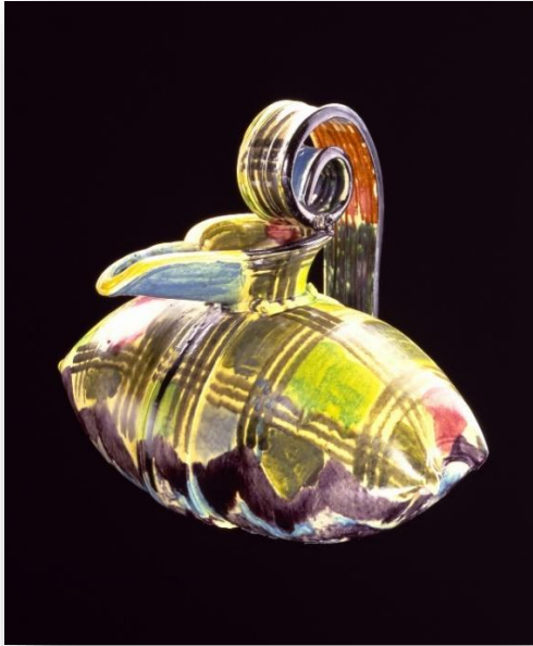
Fot. 9: Betty Woodman, Yastık Sürahi, 1983, 48. 3 x 40. 7 x 58,4 cm, Smithsonian Amerikan Sanat Müzesi, (URL-21)