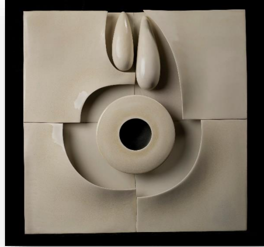
Fot. 8: Ruth Duckworth, Adsız, 2002, 80. 0 x 76. 2 x 20,3 cm, porselen, slip ve sır, Smithsonian Amerikan Sanat Müzesi, (URL-20)