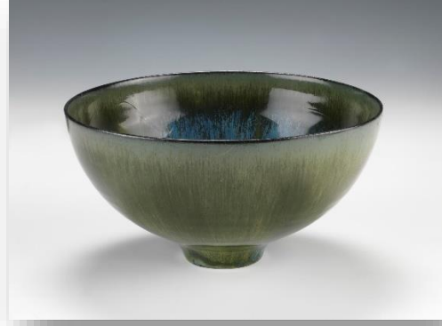
Fot. 4: Gertrud ve Otto Natzler, kâse, 1961, 8.9 x 17,1 cm, yeşil ve mavi mariposa sırlı toprak, Smithsonian Amerikan Sanat Müzesi, (URL-16)