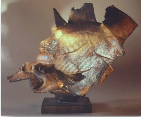
Fot. 11: Paul Soldner, Adsız, 23x32x21 cm, Frank Llyod Gallery,(URL-23)