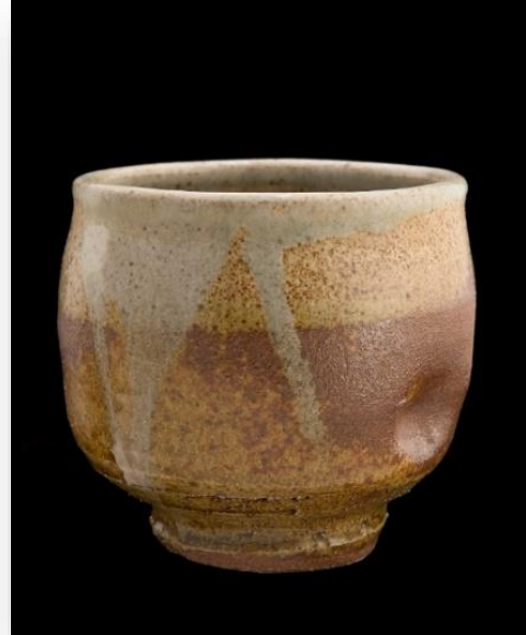
Fot. 6: Warren MacKenzie, Yunomi (içecek kabı) 1980, Smithsonian Amerikan Sanat Müzesi, Boyutlar: 10,2 x 10,8 cm, (URL-18)