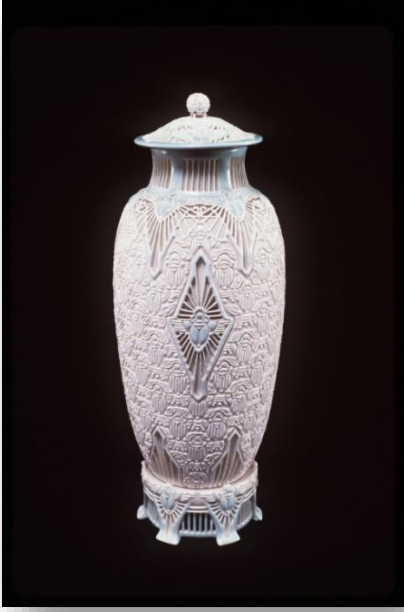
Fot. 3: Adelaide Alsop Robineau, Scarab Vazosu, 1908, Beyaz gövdeli porselen, 7.375 in x 2.5 (URL-15)