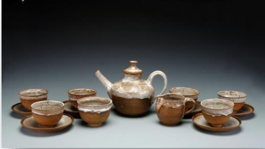
Fot. 5: Marguerite Wildenhain, fincan seti, yakl. 1971, 2,8 x 16,3 cm, sırlı seramik, Smithsonian Amerikan Sanat Müzesi, (URL-17)