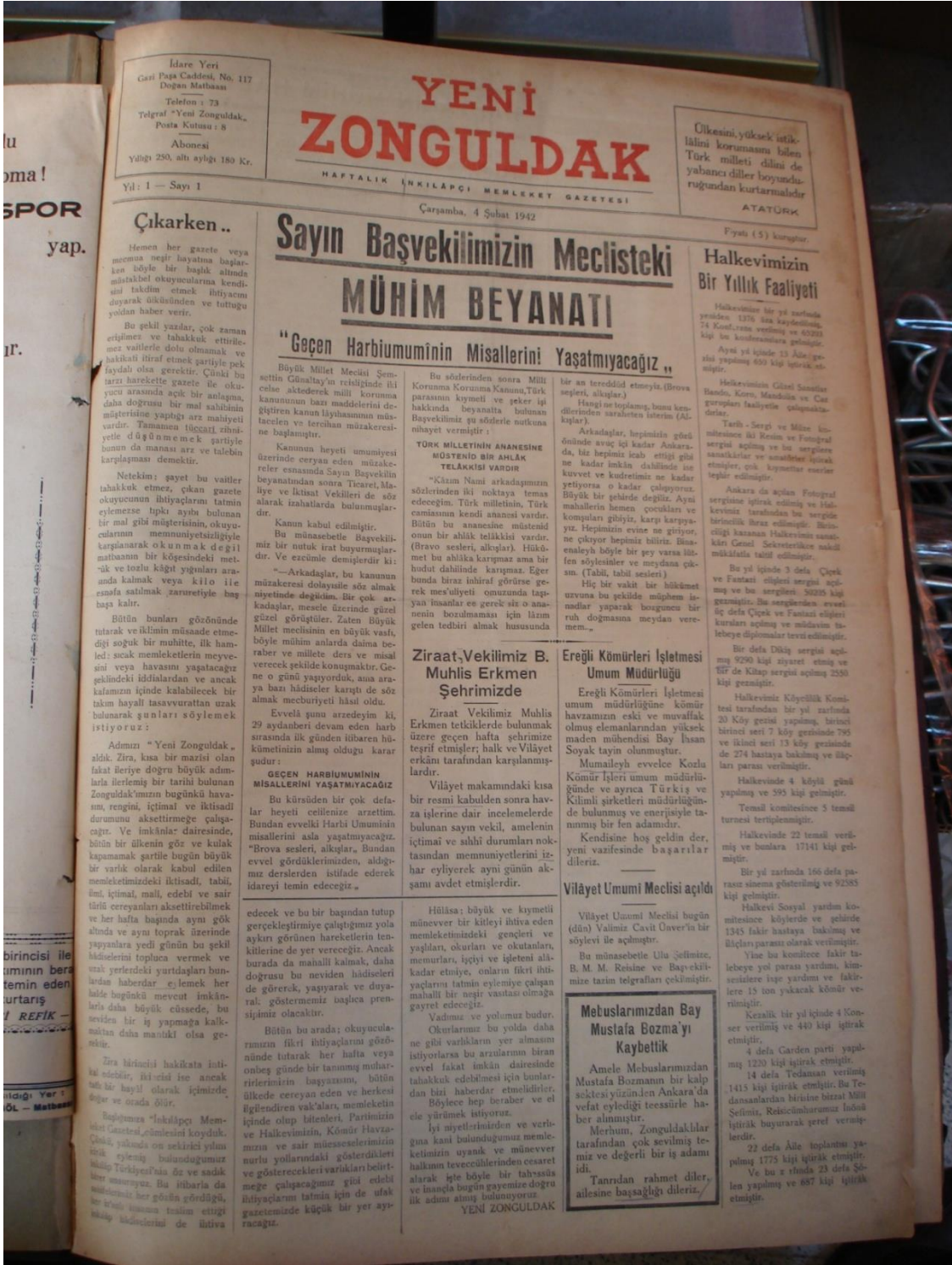
EK-4: Yeni Zonguldak, 4 Şubat 1942 Çarşamba, No. 1.