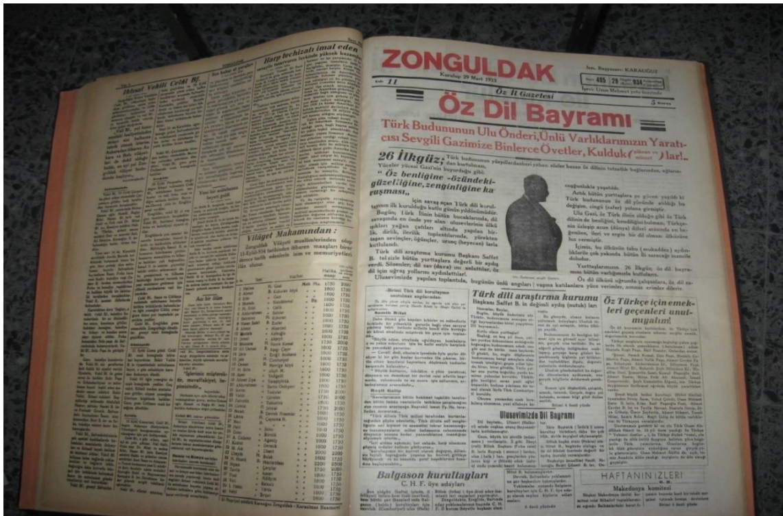
Ek-2: Zonguldak, 29 Eylül 1934, Cumartesi, No.405.