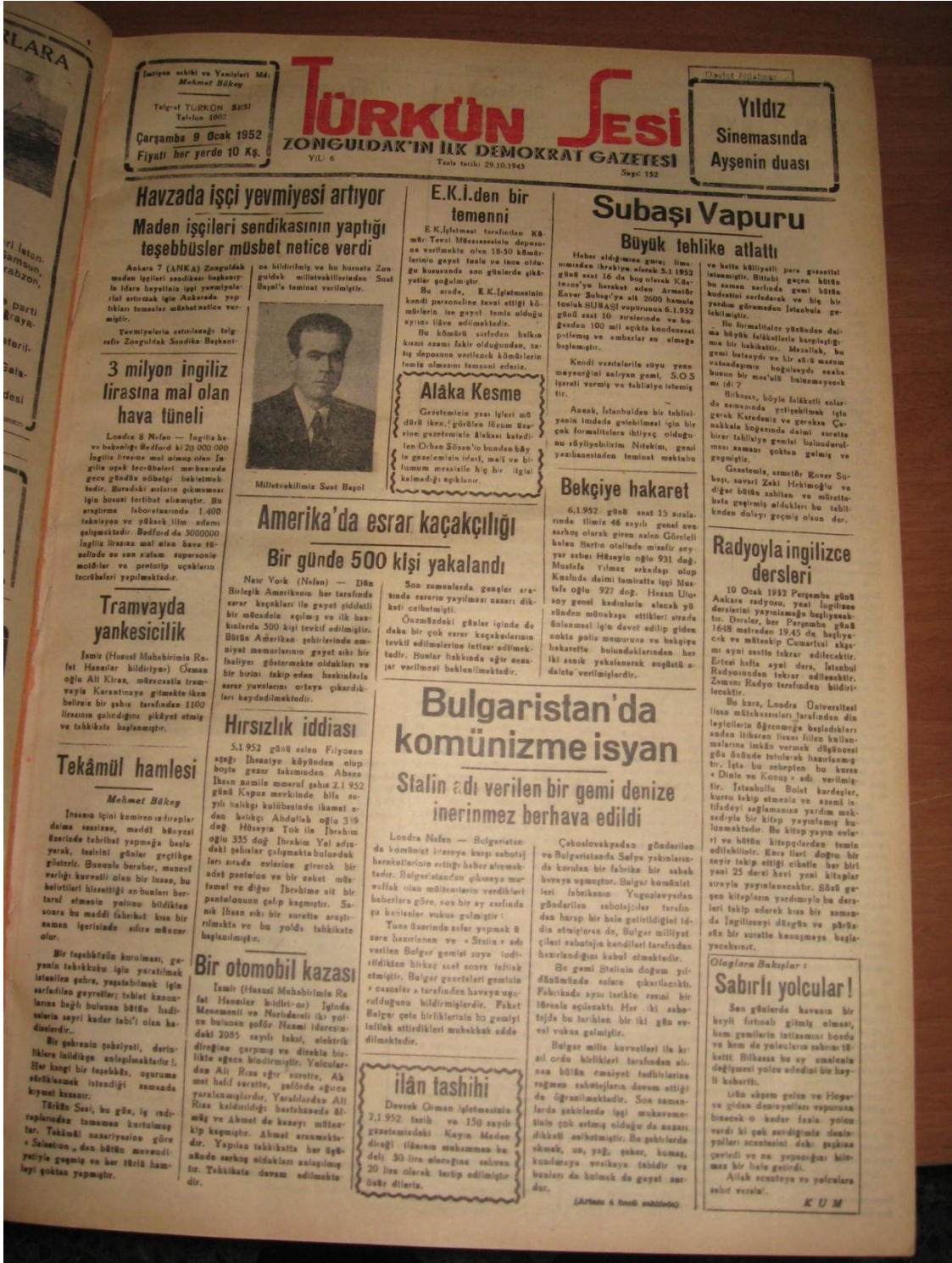
EK-5: Türkün Sesi, 9 Ocak 1952 Çarşamba, No. 152.