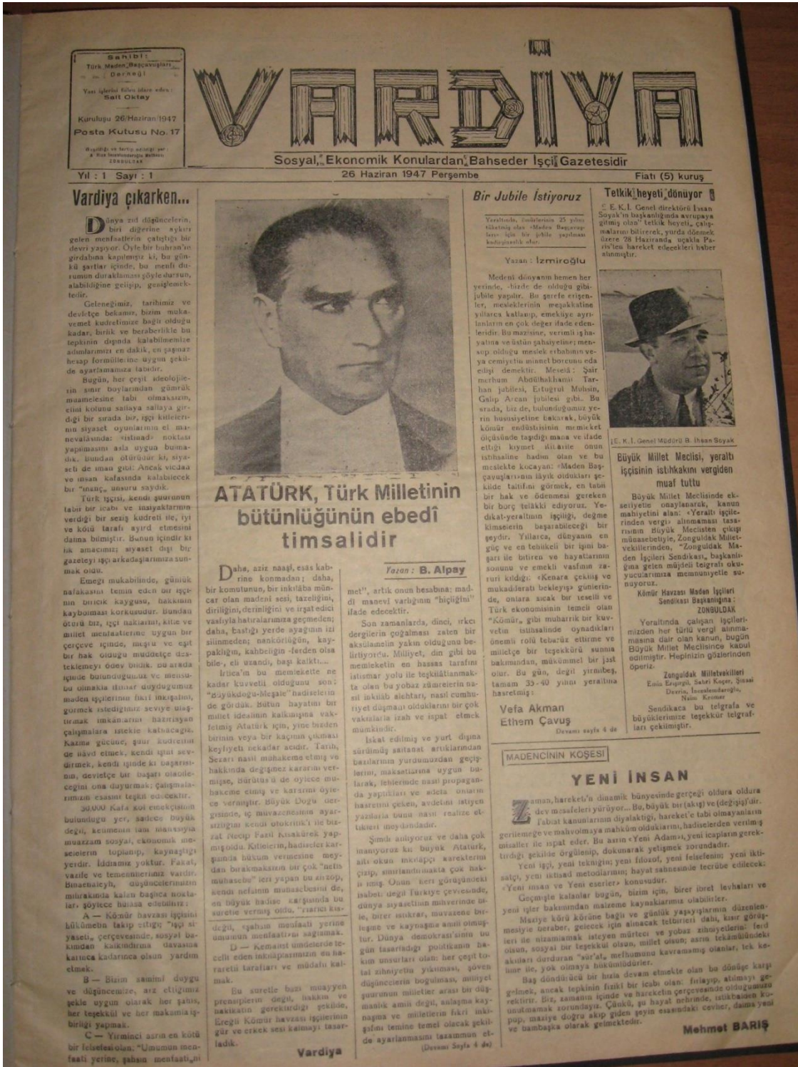
EK-6: Vardiya, 26 Haziran 1947 Perşembe, No. 1.