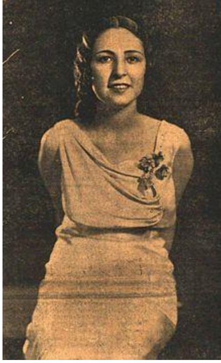
Resim 5. 1932 Dünya Güzeli Keriman Halis