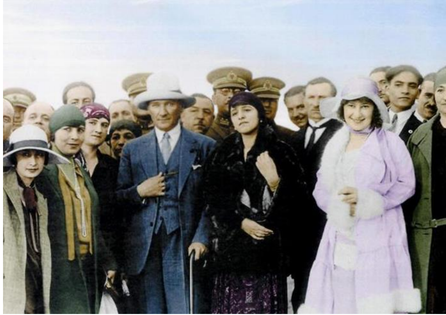
Resim 3. Cumhuriyet ile Değişen Türk Kadının Modern Görüntüsü

Modernleşme ve çağdaşlaşmanın bir göstergesi olarak kıyafet Cumhuriyet döneminin en önemli mücadele alanı olmuştur. Kadınlar Avrupa modasına uygun kıyafetler giymeye, toplum içerisinde yer almaya, bizzat ülkeyi yönetenlerce teşvik edilmiştir. Bitlis'te tuttuğu anlarından anlaşıldığına göre, Mustafa Kemal daha Cumhuriyet kurulmadan önce arkadaşlarıyla yaptığı sohbetlerde ileriye dönük tasarılarından söz ederken "tesettürün kaldırılması" konusuna da değinmekteydi. Nitekim, Sivas Kongresi hazırlıkları sırasında arkadaşı Mazhar Fuat'a "zaferden sonra olacakları" yazdırırken, projeleri arasında ileride tesettürün kalkmasını ve uygar ülkeler gibi" fes yerine şapka giyilmesini de saymıştır. Bu nedenle 28 Kasım 1925 tarih ve 230 sayılı resmi gazetede yayınlanan 671 no' lu Şapka İktisası hakkındaki kanun ile Atatürk giyim konusundaki ilk düzenlemeleri gerçekleştirmiştir. Erkeklerle ve kadınlara daha modern bir dış görünüş sağlayabilmek amacıyla düzenlenen bu kanun ile batılı giyim tarzı benimsenmiştir (Resim 3.) (Erden, 2002: 387).