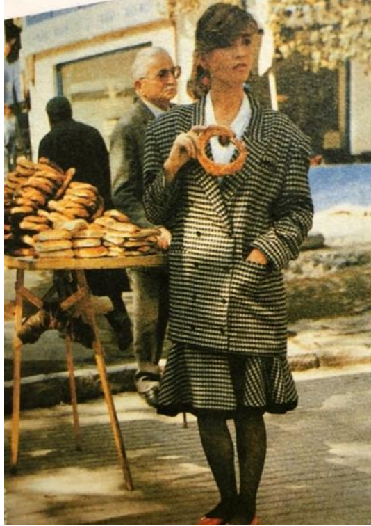
Resim 11. 1990'lara ait giysi örneği

Vizkoz ve krep ipliklerden üretilen yumuşak ve elastik kumaşlar, rahatlık ve sadeliğe önem veren 90'lı yılların kadın modasına damga vurmuştur. Dramatik renkler, genellikle siyahın kullanımı öne çıkarılarak endişeli ama bir o kadar da kendinden emin bir kadın profili çizilmiştir. Moda gündeminde kadınları güçlü ve başarılı, amaçlarını gerçekleştirme ve diğerlerini yönetme yetkisine sahip bir biçimde resmetmiştir (Davis 1997). Bu noktada kadınlar daha çok iş takımları ve erkek giyiminden alınan diğer giysiler içinde sunulmuştur (Resim 11.).