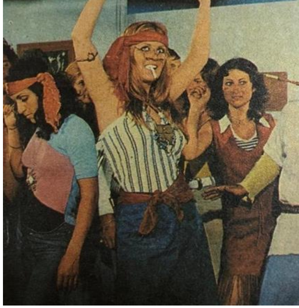
Resim 9. 1978, Hippi tarz kadın giyim örneği

75 yılda değişen yaşam değişen insan Cumhuriyet modaları , Türkiye İş Bankası Kültür Yayınları, 1999, İstanbul, s.76