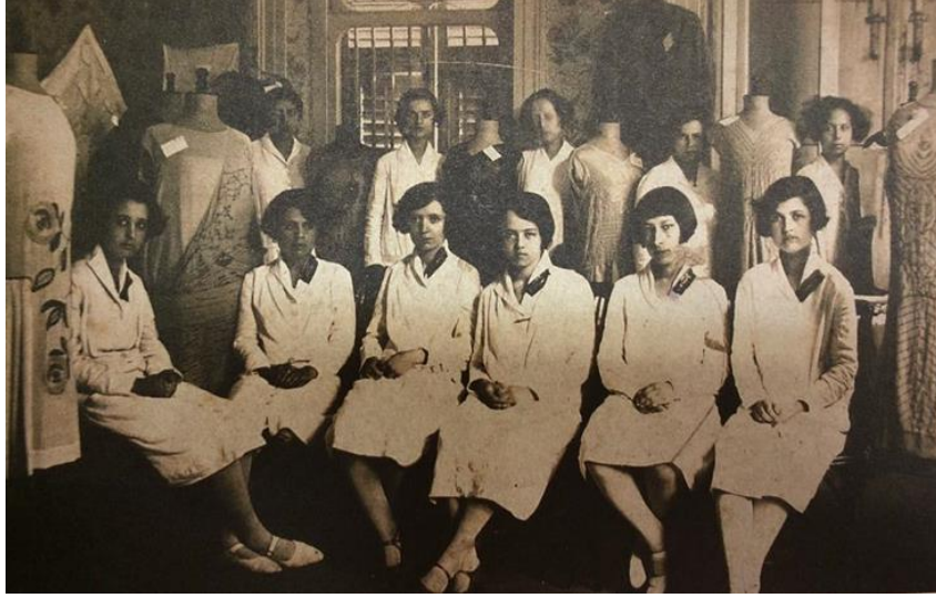
Resim 4. Kız Sanat Enstitüsü öğrencileri, Karşıyaka, İzmir

Türkiye’de kadın modasındaki değişim, erkek modasından hızlı olmuştur. Cumhuriyet ideali, kadının yaşamda aktif ve üretici yurttaş kimliği ile var olması ve erkeklerle eşit haklarda yaşaması ülküsü üzerine kurulmuştur. 1925’ten sonra Türkiye’de kadın hem üstündeki örtüyü atabilmiş, hem de Avrupalı hemcinslerinin giyimdeki yeni anlayış ve form devriminin yakın takipçisi olmuştur. Osmanlı’nın İnas Sanayi Sultani’leri yeniden örgütlendirilerek 1927’de Kız Sanat Enstitüleri kurulmuş, açılan çeşitli biçki dikiş kursları ile Kız Sanat Enstitüleri “Cumhuriyet Kadını”nın yetişmesinde önemli bir görevi üstlenmişlerdir (Resim 4.) (Baydar ve Özkan,1999: 47).