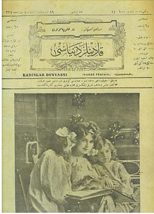
Resim 1. 1908 yılında çıkan “kadınlara mahsus gazete”

Osmanlı kadın hareketi, Metis Yayınları,2011, İstanbul, s.66