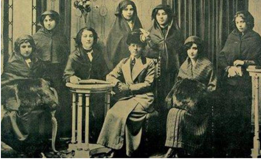
Resim 2. 1913’de kurulan Teali-i Nisvan Cemiyeti Kadınları

Çanakkale savaşı ve savaşan Türk kadını.(2016, 21 Nisan). Yeniçağ gazetesi