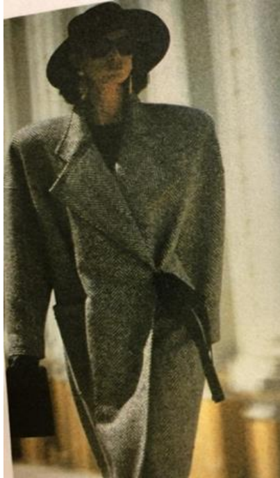
Resim 10. 1987-1989 Vakko kış koleksiyonu