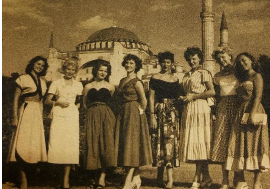
Resim 7. 1950'lerde kadın giyim örneği,

1950'de kadının meslek sahibi olarak statü kazanabileceği imajı ertelenerek, doğrudan prestijli kadının bedeni ve güzelliği üzerine odaklanılmıştır. Böylece 1950'lerin ve 1960'ların kadını, cemiyet haberleri" başlığı altında balo, çay, defilelere katılması ve şık güzel kıyafetler giymesi vesilesiyle kendine bir yer edinebilir duruma gelmiştir. O yılların modellerinin çeşitliliğini yansıtan elbiselerin hepsinde ince beller vurgulanarak kadını hatlar ön planda tutulmuştur (Resim 7.). 1956 yılında çıkan Sanat, Estetik, Sosyete kelimelerinin ilk harflerinden ismini alan SES dergisi devrin moda-kadın anlayışı hakkında ipuçları vermiştir. Güzelliğe sahip olmak, artık doğuştan gelen bir özellik olmaktan çıkartılmıştır. Kozmetik ürünleri kullanmak ve gündemde olan artistlere benzemeye çalışmak, güzel olmak için yeter şart olarak sunulmuştur. Giyinmesini öğrenmek, ancak sinemalardan, mecmualardan faydalanmasını bilmekle mümkün kılınmıştır. Örneğin; Fransız kadınların iyi giyinmesinin sebebi olarak Fransız mecmuaları gösterilmiştir (Barbarosoğlu, 2016: 169).