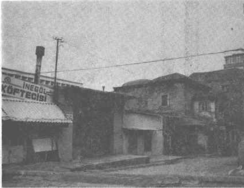
Fot. 4-İzmir, Girit Hanı