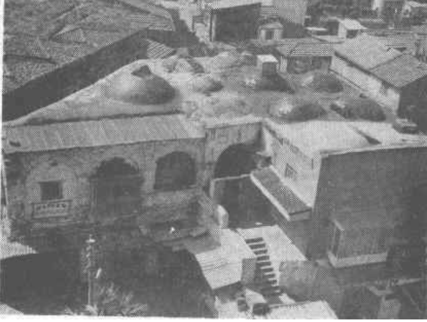
Fot. 1-İzmir, Selvili Han