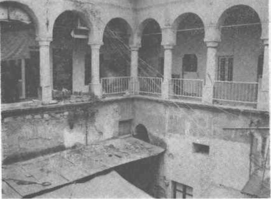
Fot. 3-İzmir, Mirkelamoğlu Hanı