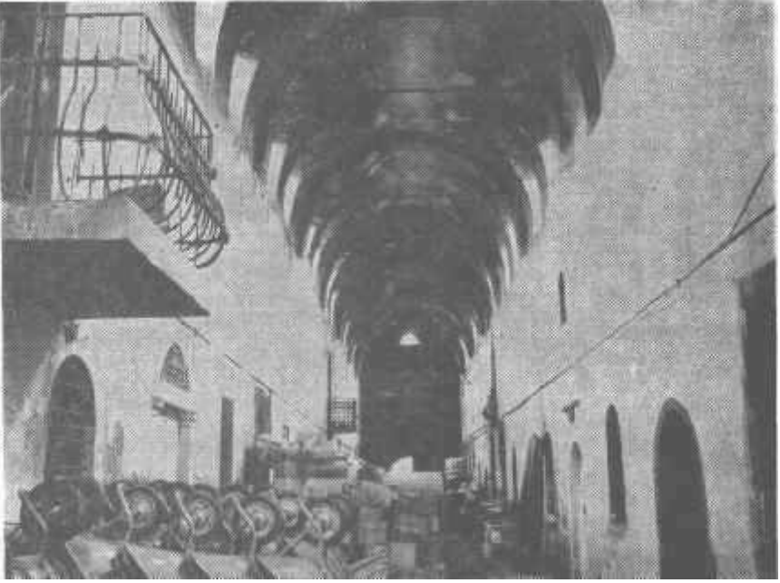
Fot. 5-İzmir, Çakaloğlu Hanı