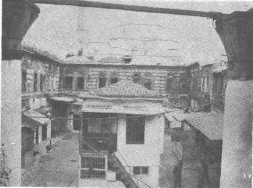
Fot. 2-İzmir, Kızlarağası Hanı