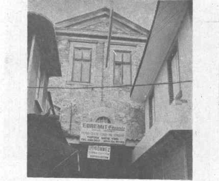
Fot. 7-İzmir, Esir Hanı