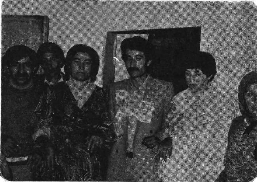
Resim 5. Düğünlerde yardımlaşma

Köyde yeni evlenecek olan çiftlerin düğünlerinde, evliliklerinde başarılı olmaları için tecrübeli evli kadınlardan yengeler 9 ve sağdıç! 10 seçilir. Bu kişiler yeni evlenen çiftlere yol gösterirler. Ayrıca düğünde yeni evlenecek çiftlere çeşitli takılar (genellikle altın ve para) takdir. Bu takılardan altınları (bilezik, kolye, yüzük vb.) gelin ve damadın yakın akrabaları, para takısını ise hemen hemen köylülerin tümü takmaktadır. Yeni evlenen çiftlerin evleri kız ve oğlan