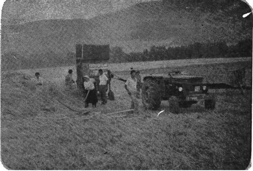
Resim 2. Patos çekilmesinde yardımlaşma

den yardımlaşarak yapılanlar, tarlayı çapalamak, ekin biçmek, Patos çekmek 4 , patatesi topraktan sökmek, sebze toplamak, nohut dermek ve tarlaları sulamak gibi işlerdir. Tarla işlerindeki yardımlaşma son 10-15 yıldır birbirlerini seven, birbirlerine akraba ve iyi anlaşılan aileler arasında karşılıklı olarak yapılmaktadır. Ayrıca, bu yardımlaşmayı sürdüren aileler azaldığından, üye sayısı az olduğu halde kendi başının çaresine bakan aileler de oldukça fazladır. Son yıllarda azalan bu tür yardımlaşmanın yerini para karşılığında çalışma almaktadır.