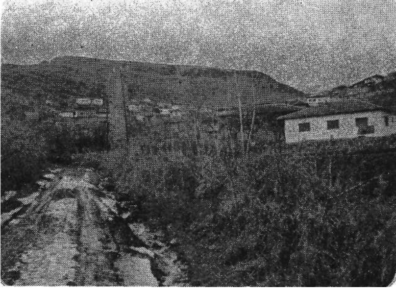
Resim 1. Güneyevler köyünün uzaktan görünüşü