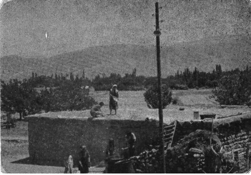
Resim 4 Bulgur yapımında yardımlaşma

Bu mal sırasında diğerinden farklı olarak köylülerin dışında bir de sürekli bir çoban görevlendirilmektedir. Çobanın yanında köyden sıra ile görevlendirilen kişiler ise çobana yardımcı olmak ve çobanın yemeğini götürmek için görevlendirilmektedir. Hayvanlar köyün 4 km ötesindeki köy yaylasına veya etraftaki dağlara götürülerek Haziran ayının sonuna kadar orada kalırlar. Çoban bir ay boyunca köye hiç gelmez. Köyden görevlendirilen kişi (sıracı) öğlen 12 civarında yaylada belirlenmiş olan buluşma yerine giderek çobana yemeğini verir. Diğer sıracıdan da listede belirlenmiş sayıdaki malı sayarak teslim alır. Bir sonraki gün saat 12'ye kadar malı çobanla birlikte güder. Gece yaylada açık havada yatar. Daha sonra mal yatağı denilen buluşma yerinde köyden gelen diğer sıracıya malları teslim ettikten sonra köye döner. Günümüzde de hâlâ sürdürülmekte olan bu organizasyonda malların etlenmesi amaçlanmaktadır.