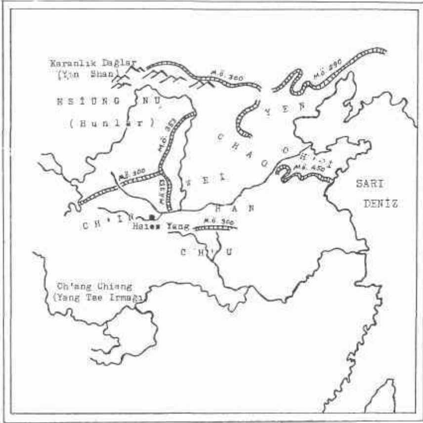
HARİTA I: Savaşan Beylikler Dönemi'nde, beylikler ve aralarındaki sınırları belirleyen surların önemli bölümleri (Surların yapıldıkları tarihler harita üzerinde gösterilmiştir.)