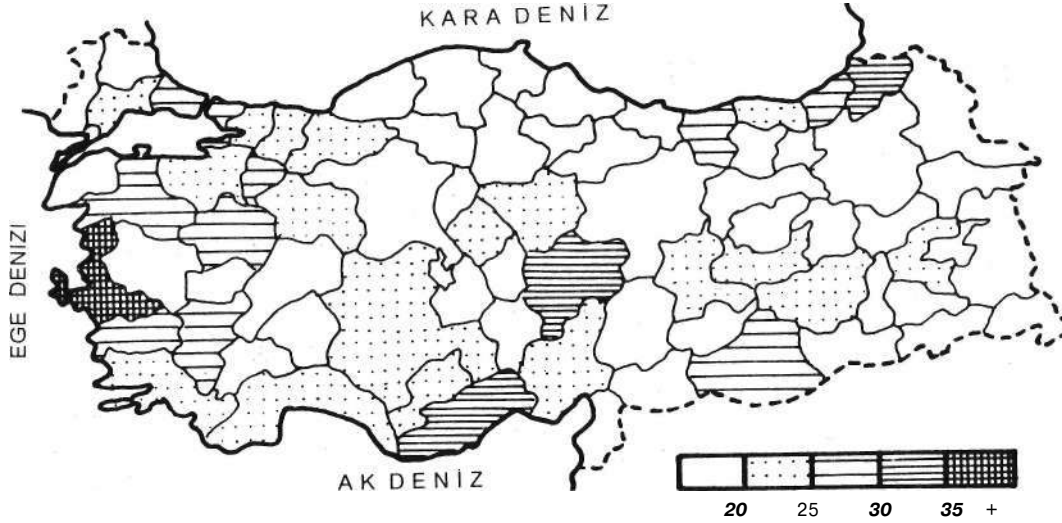
Harita:2 Türkiye'de 1980-1985 Arasında İl İçinde Göç Edenlerin 1980 Nüfusundaki Payı( Binde ).