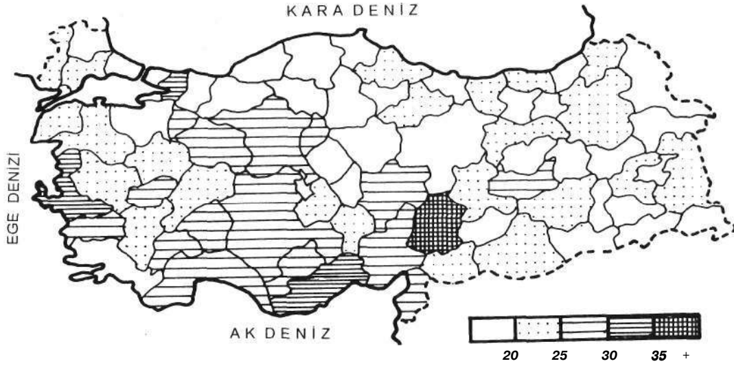
Harita.1 Türkiye'de 1975-1980 Arasında İl İçinde Göç Edenlerin 1975 İl Nüfusundaki Payı(Binde).