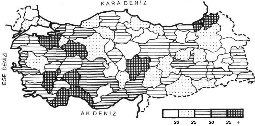
Harita:3 Türkiye'de 1985-1990 Arasında İl İçinde Göç Edenlerin 1985 Nüfusundaki Payı(Binde).