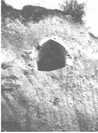
Resim: 6. Yenişehir İznik yol kıyısında bulunan mezar.