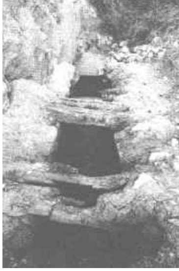
Resim: 17. Dörttepeler Tümlüsü II. Mezar odasının dromos'u.