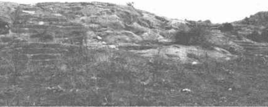
Resim: 14. Elebeyli yolu üzerindeki merdivenli kayalık.