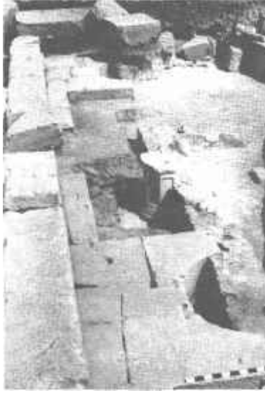
Resim: 19. İznik Roma Tiyatrosunun sahne önündeki çok köşeli sütun kaidesi.

İznik çevresinde bilhassa Roma döneminde açılıp işletilen Deliktaş (Resim: 20), Sarıtaş (Resim: 21), Ömerli ve İnikli köyleri çevresindeki taş ocaklarından anıtsal yapılara malzeme çekilmiştir 17 . Bu antik taş ocaklarının önemli kısmı son dönemlerde tekrar işletilmeye başlanmış olup, tahribat hızla sürmektedir.