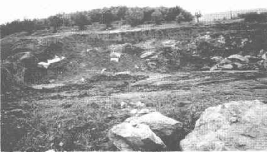
Resim: 2. Gemlik Umurbey yol kavşağındaki nekropol alanında izinsiz gerçekleştirilen kazı alanı.

mesi sonucu M. S. IV-V. yy ait Prokennesos (Marmara Adası) mermerinden yapılmış bazı girbantlı lahit tekneleri ve kapakları tahrip edilmiştir (Resim: 2-3).