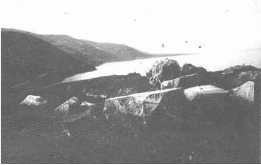
Resim: 4. Karacakaya Tümülüsü mezar odasının tahrip edilmiş görünümü.