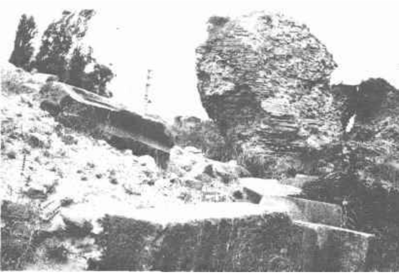
Resim: 1. Tahribe uğrayan İznik surlarından bir bölüm.

4970 m uzunluğu ile ülkemizde ve dünyada önemli yeri olan İznik surları 4 , doğanın acımasız etkisi ile her yıl yavaş yavaş bir mum gibi erimektedir. Üzerindeki bitki dokusu, etrafına dökülen moloz ve çöp yığınları, yakılan ateşler ise bunu hızlandırmaktadır (Resim: 1).