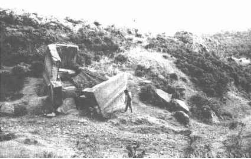
Resim: 9. Berberkaya mezar odasının parçalanış görünüm