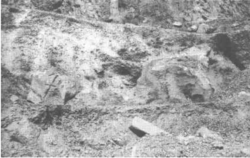
Resim: 21. Sarıtaş antik taş ocağı ve yongalıkları.