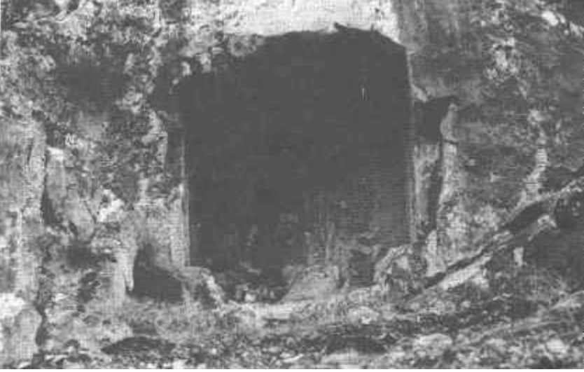
Resim: 15. Elebeyli çam koruluđunun üstündeki Kaya Mezarı (Berberkaya).