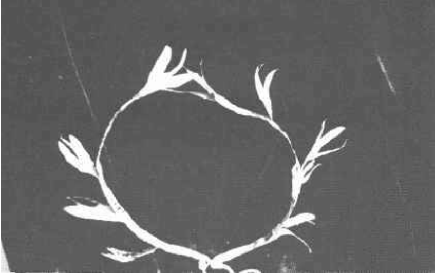
Resim: 18. Elebeyli futbol sahası tesfiyesinde çıkan mezarda bulunan altın diadem.