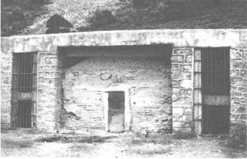
Resim: 12. Elebeyli Hespekli'deki Hipoje'nin dıştan görünümü.