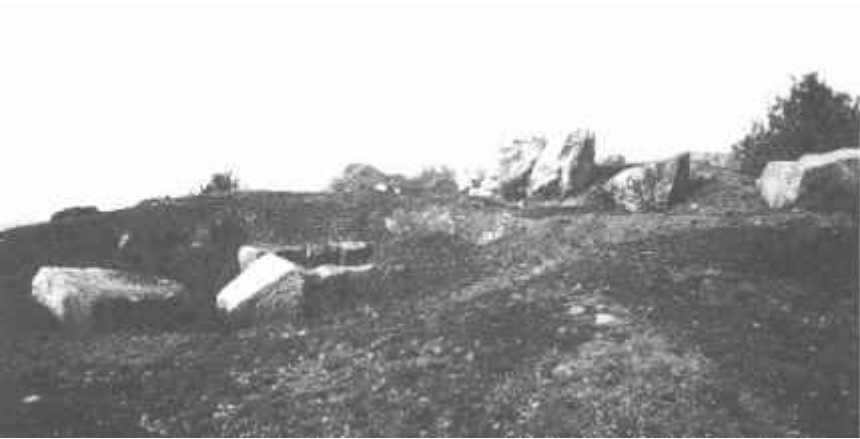
Resim: 5. Karacakaya Tümülüsü mezar odasına ait mimari parçalar.