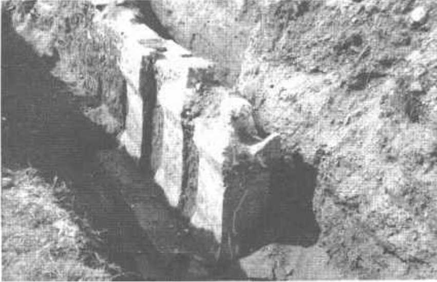
Resim: 8. İznik Dirazali yolu kenarında Threptus'un mezar nekropol alanındaki mezarlar.

nik Tiyatro kazısı ekibinin gayretleri ile eserler İznik Müzesine nakledilmiş ve teşhirleri sağlanmıştır.