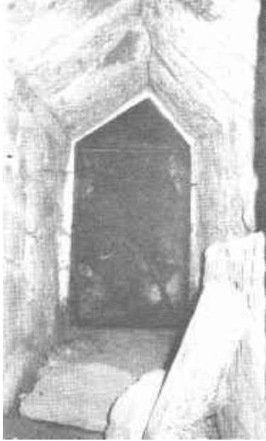
Resim: 16. Dörttepeliler Tümülüsü 1. Mezar Odası dromos'u.