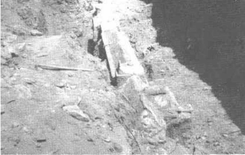
Resim: 7. İznik Dırazali köy yolu kıyısında bulunan nekropol alanındaki mezarlar.