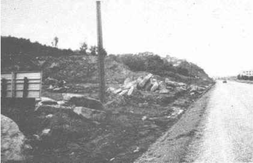
Resim: 3. Gemlik Umurbey yol kavşağındaki nekropolden çıkan lâhit ve mezar taşları.