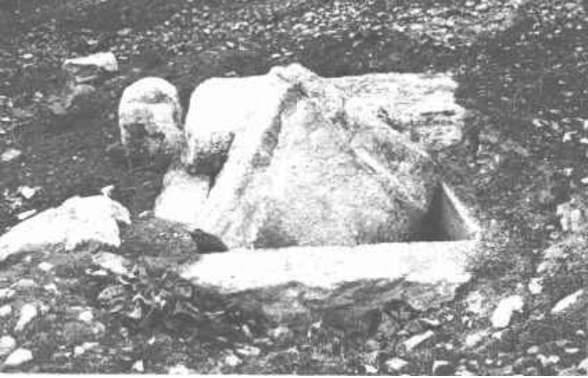
Resim: 11. Elebeyli Hespekli nekropol alanında tahrip edilmiş bir mezar.