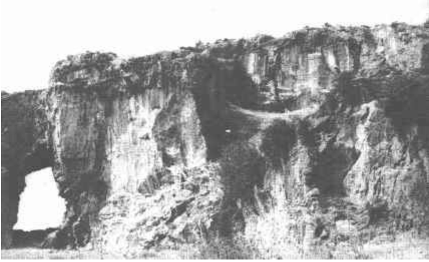
Resim: 20. Deliktaş antik taş ocağı.