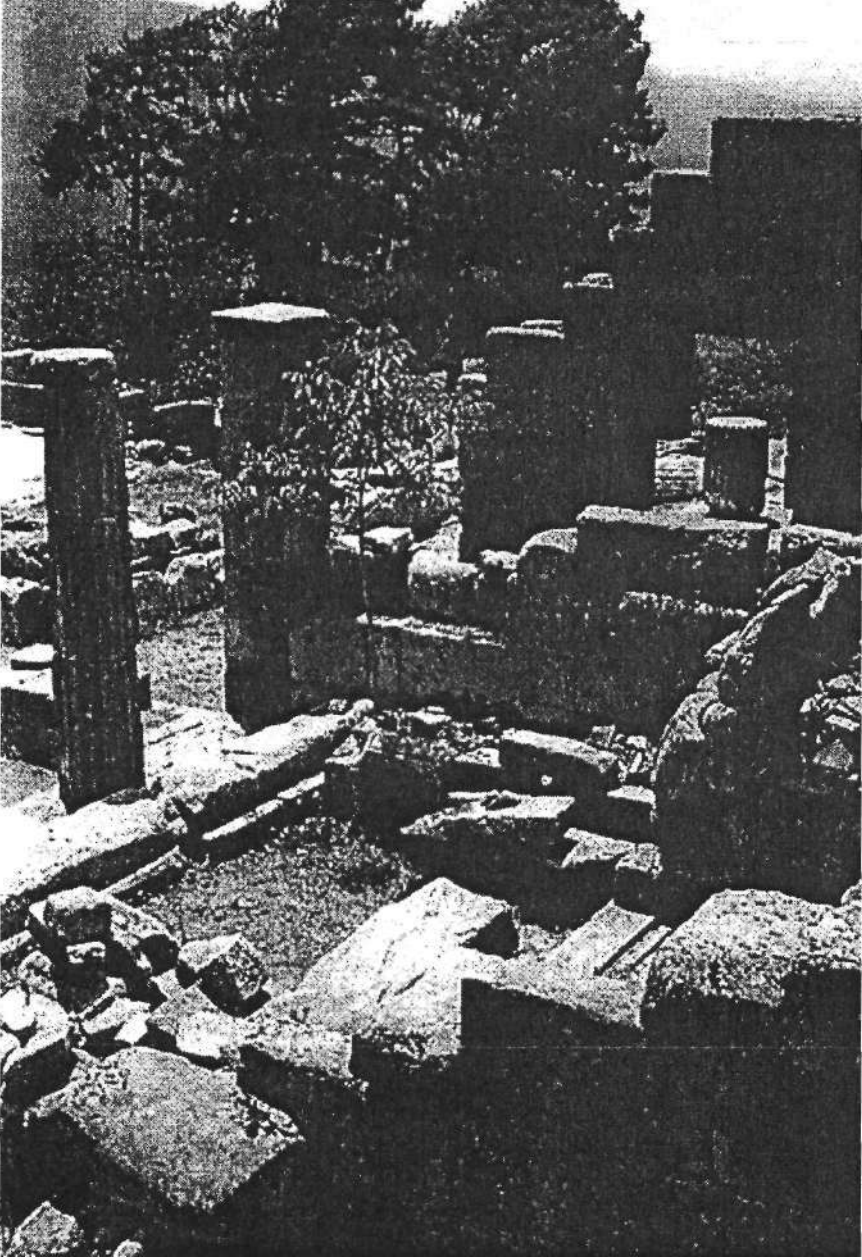
Resim 3: Oikoi 1