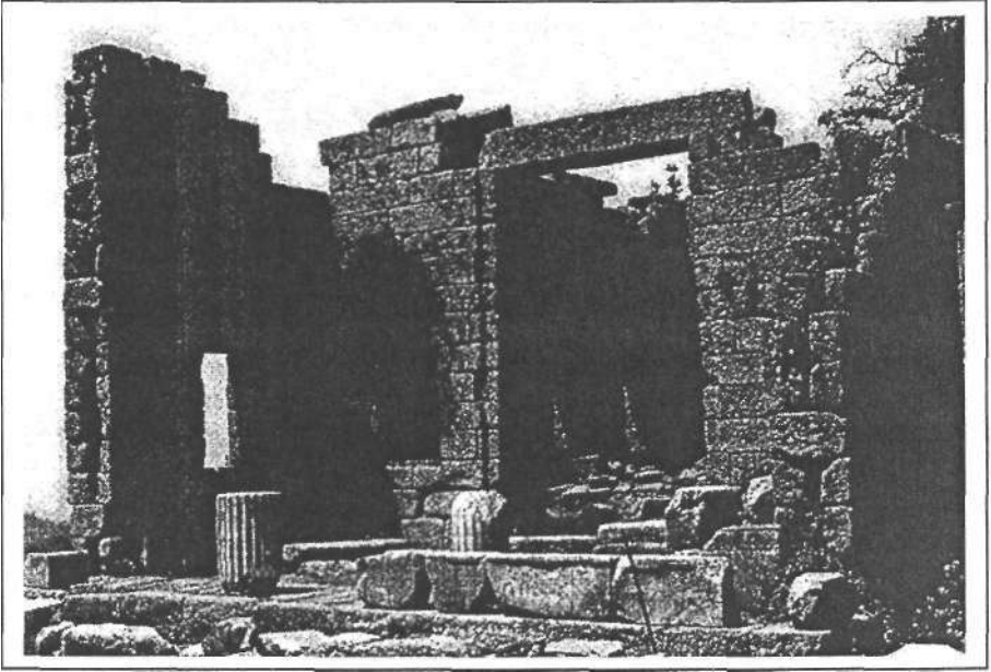
Resim 1: Andron A