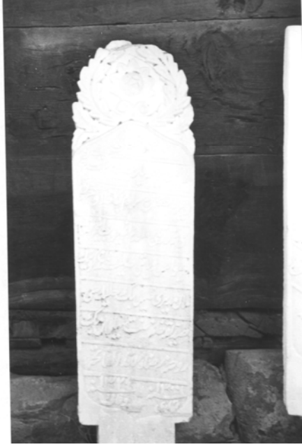
7- Beypazarı Müzesi (Şahide5)