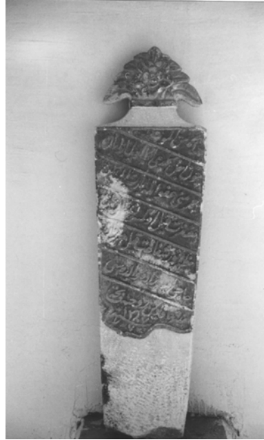
4- Beypazarı Müzesi (Şahide 2)