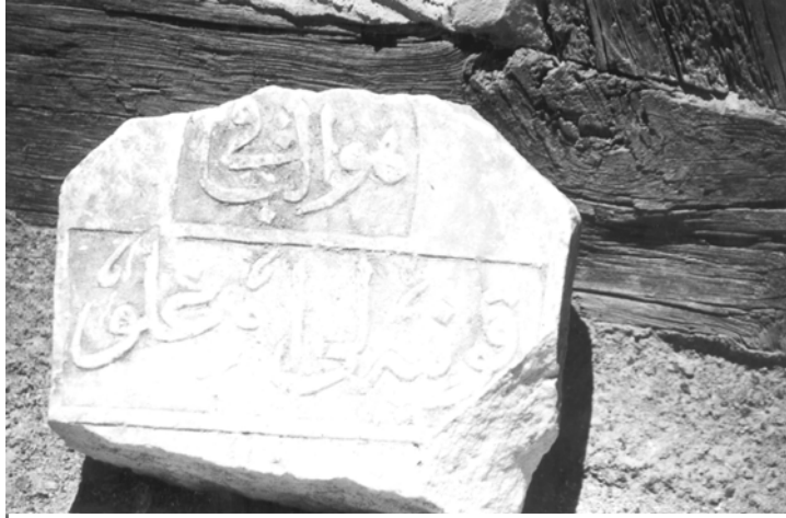
10- Beypazarı Müzesi (Şahide 8)