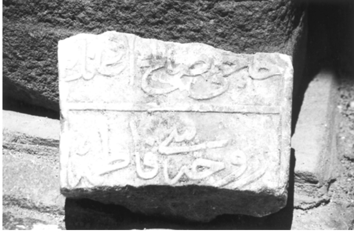
9- Beypazarı Müzesi (Şahide 7)