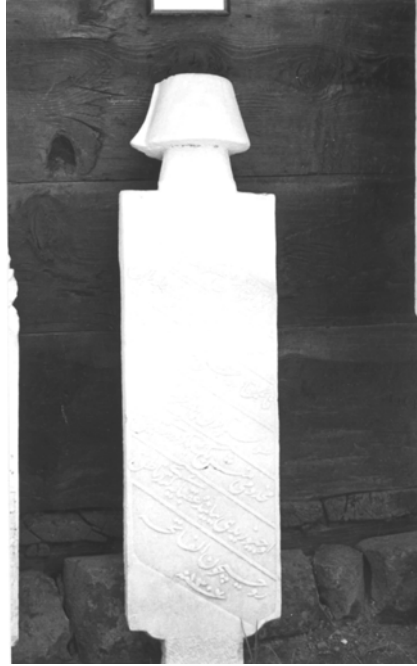
6- Beypazarı Müzesi (Şahide 4)