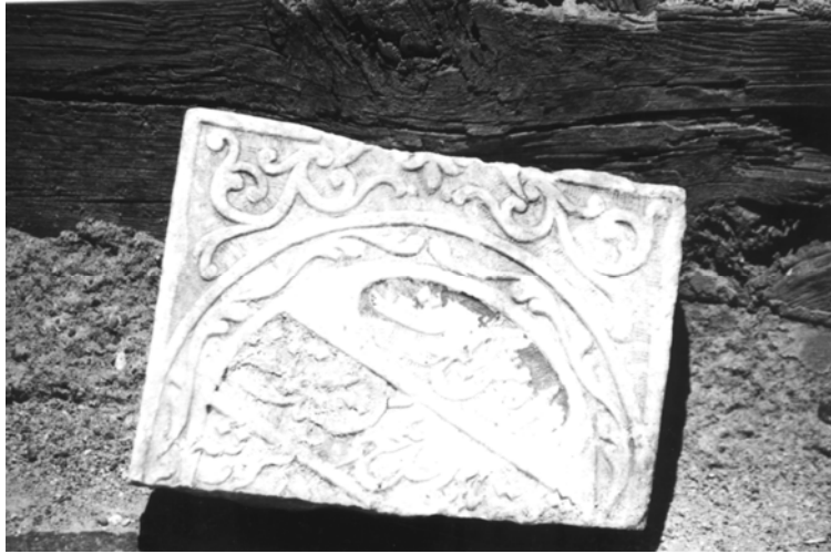
8- Beypazarı Müzesi (Şahide 6)