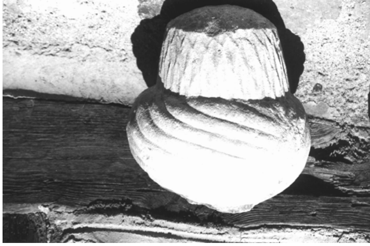
11- Beypazarı Müzesi (Şahide 9)