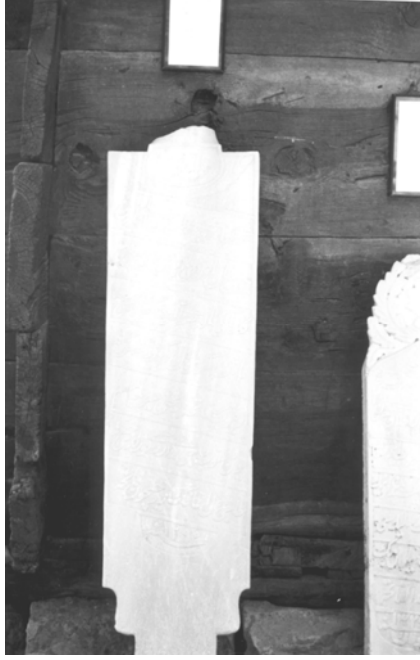
5- Beypazarı Müzesi (Şahide 3)