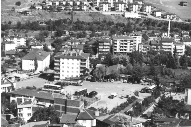
2- otopark haline getirilen Eski Mezarlık