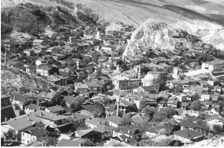
1. Beypazarı, genel görünüş