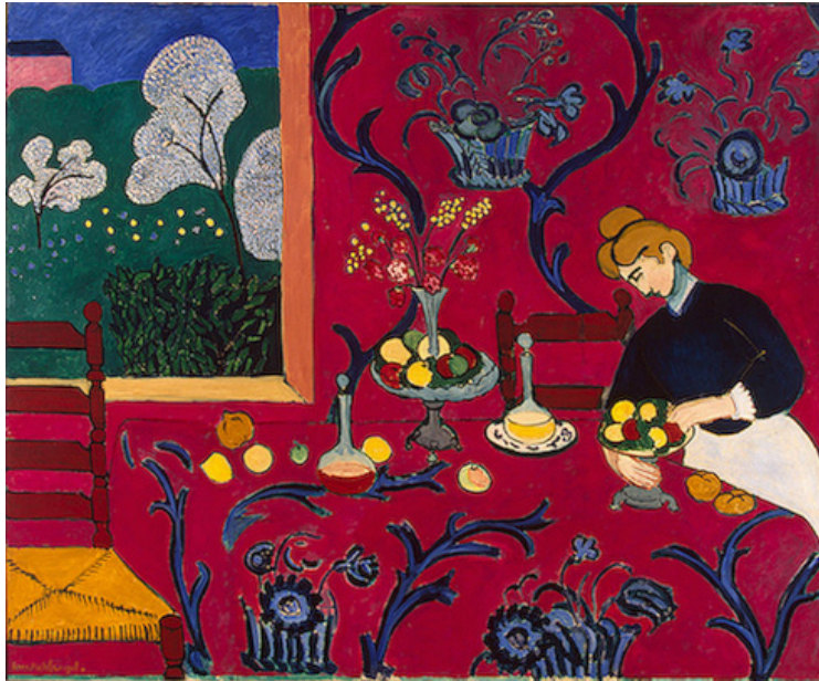
The Red Room (Harmony in Red), 1908