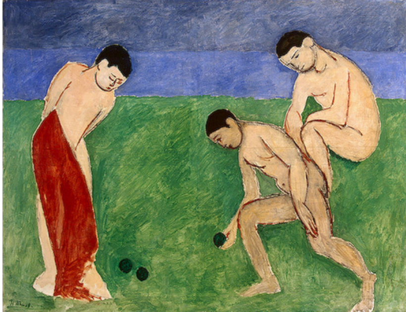
A Game of Bowls, 1908