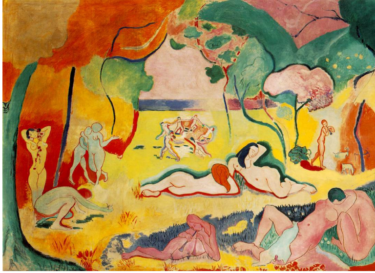
Le Bonheur de vivre (The Joy of Life), 1905-06