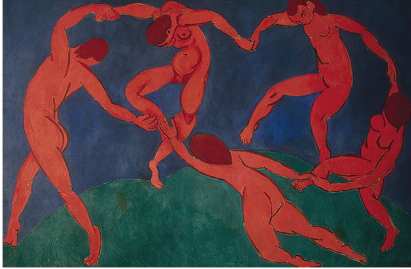
The Dance, 1909 - 1910