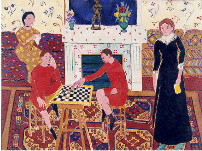
The Painter's Family, 1911