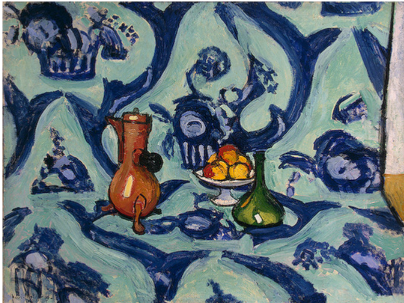
Still Life with Blue Tablecloth, 1909