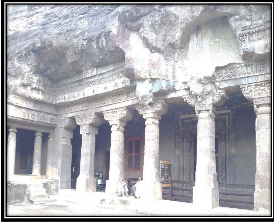
Ek 6- II numaralı mağaranın ön cephesi.