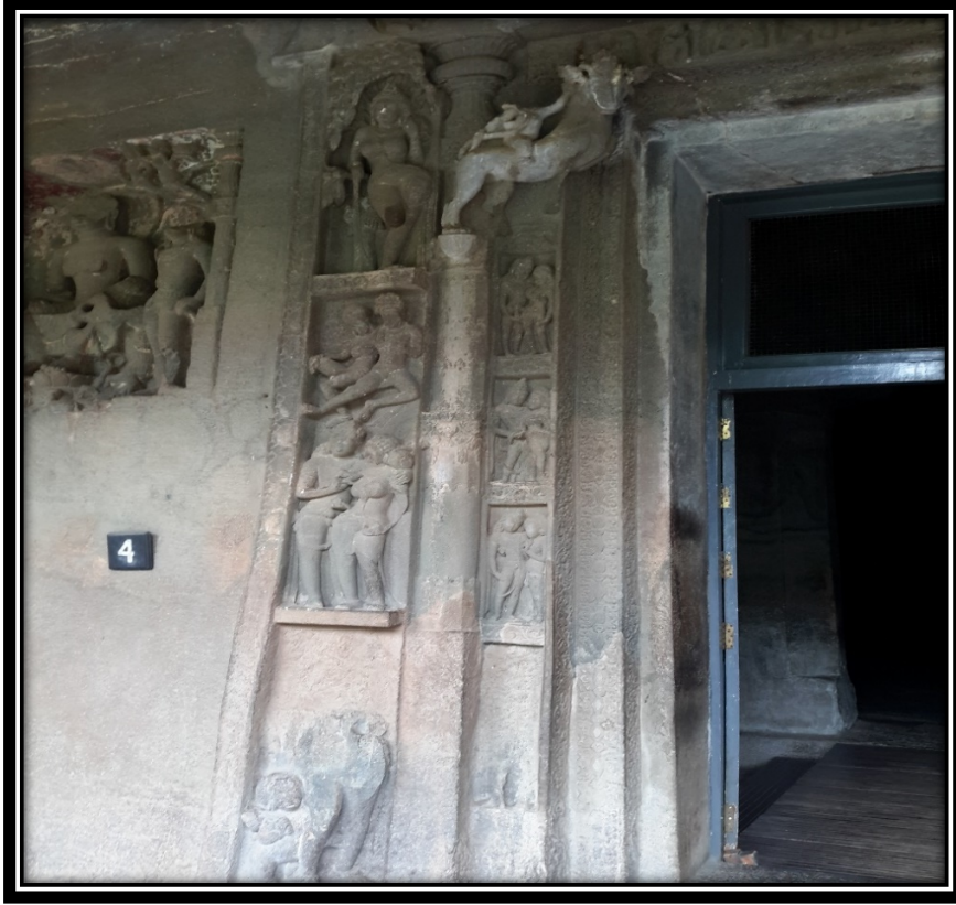
Ek 9- IV numaralı mağaranın kapı süslemeleri.