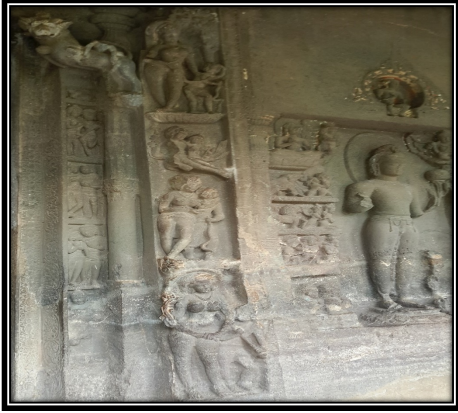
Ek 8- IV numaralı mağaranın kapı süslemeleri.