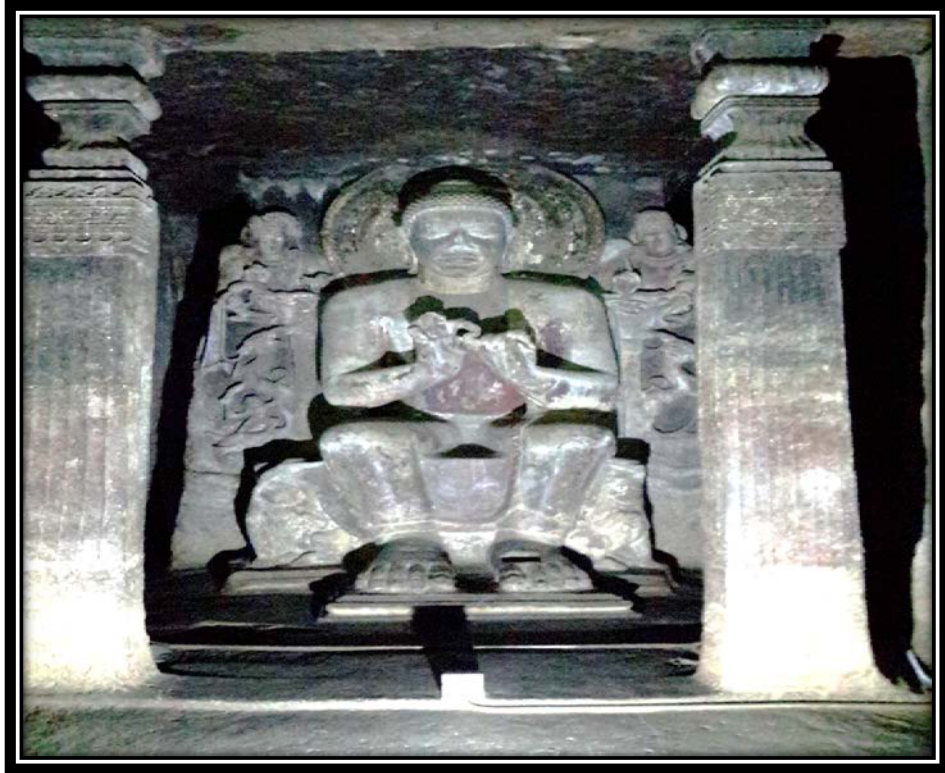
Ek 17- XVI numaralı mağaradaki devasa Buddha heykeli.