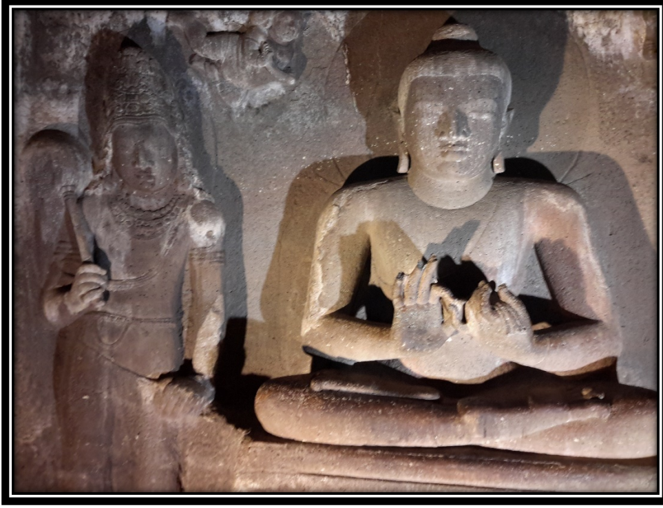
Ek 22- XXI numaralı mağaradaki Buddha heykeli ve çāmara taşıyıcısı kabartması.