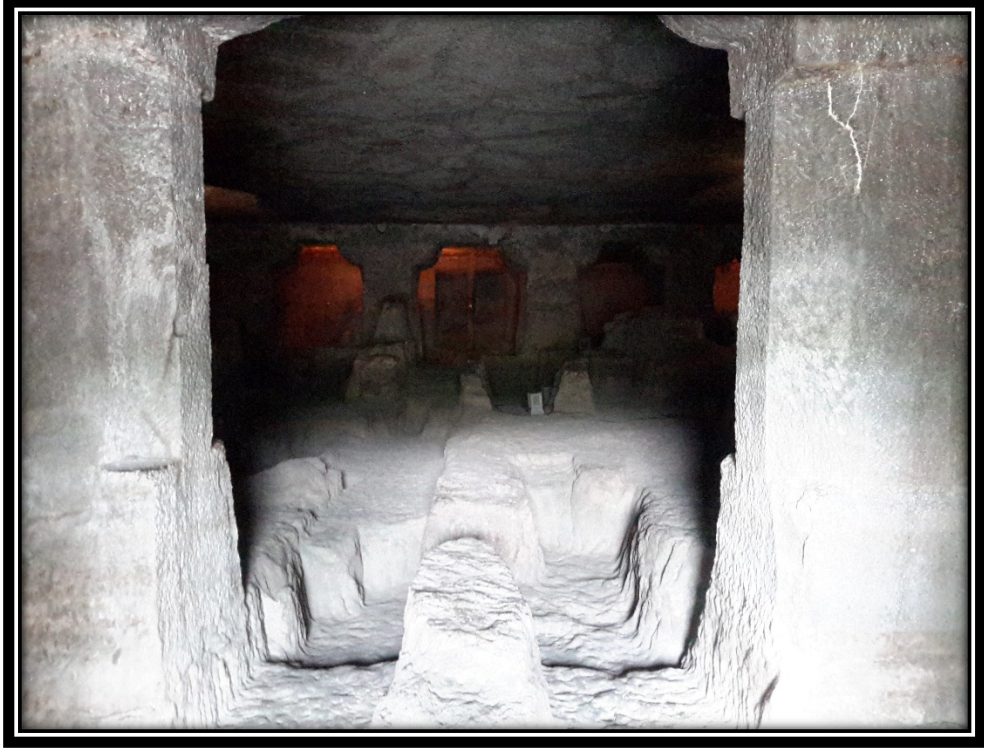
Ek 24- XXIV numaralı tamamlanmamış mağara.