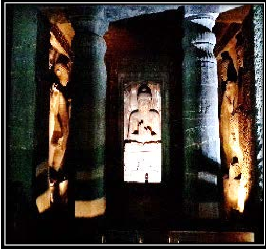
Ek 10- IV numaralı mağaranın tapınak bölümü.