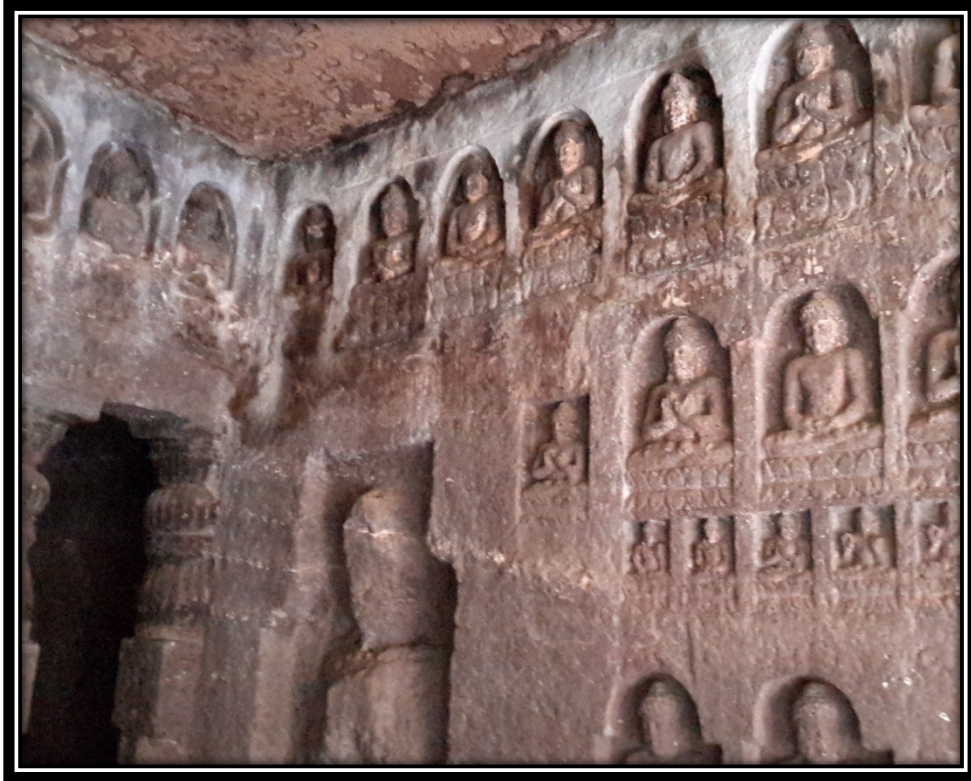
Ek 13- VI numaralı mağaranın ön cephesindeki Buddha kabartmaları.