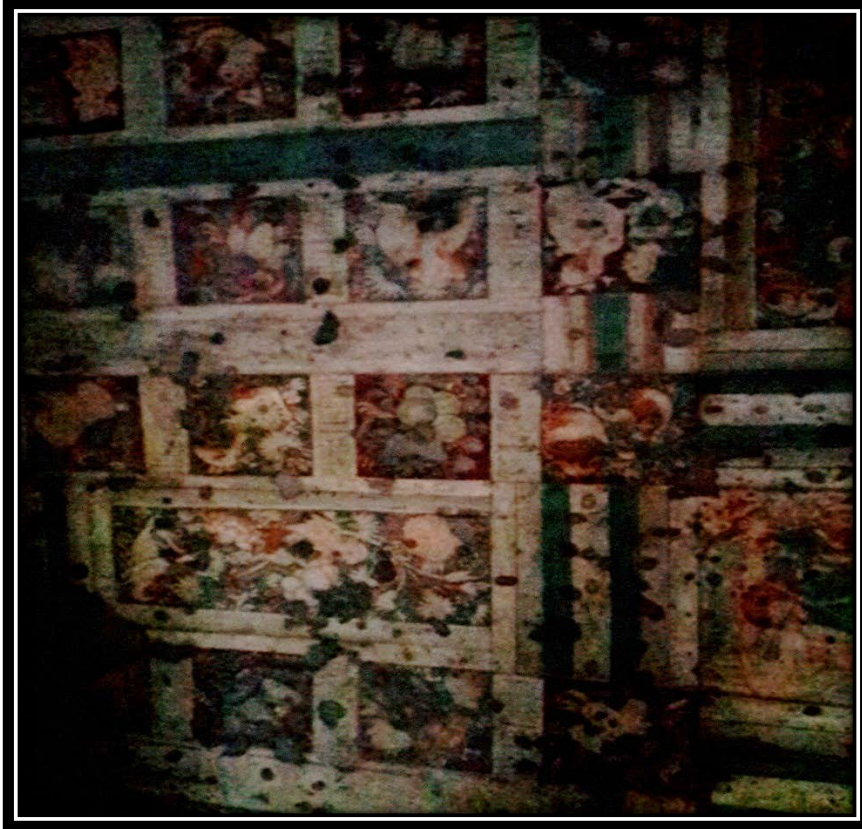
Ek 3- I numaralı mağaradan çiçek desenleri.