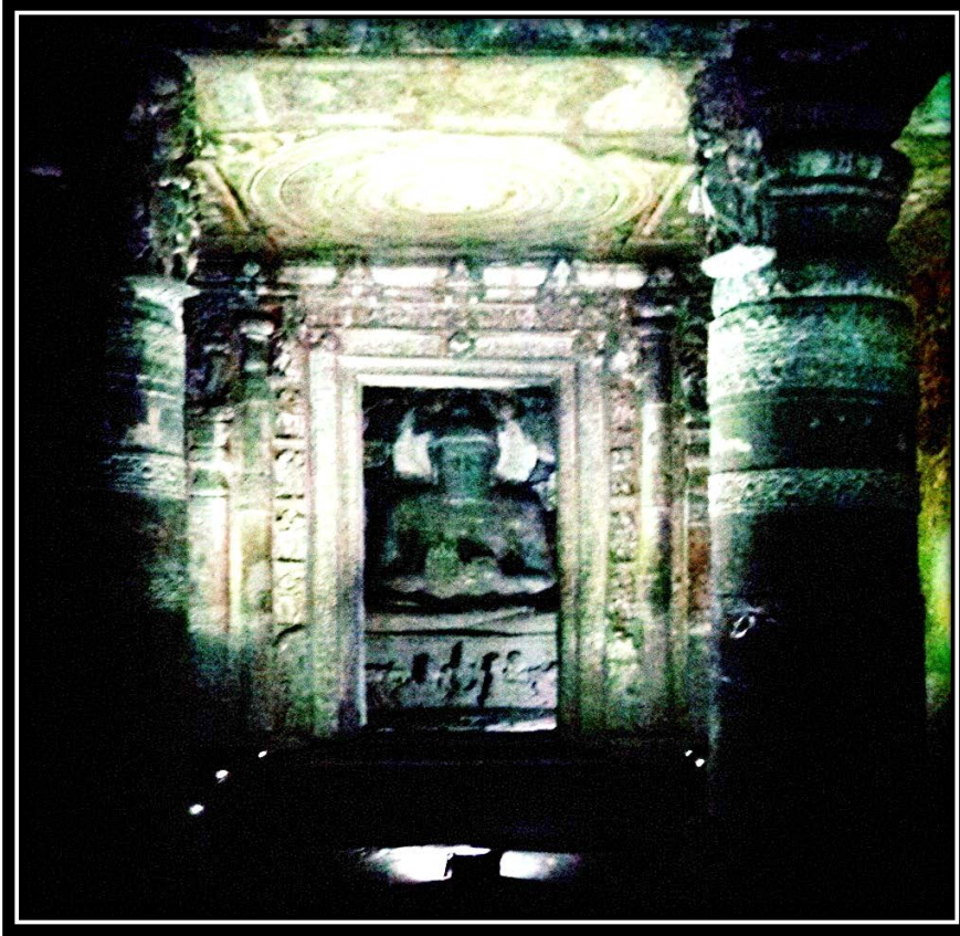
Ek 5- I numaralı mağaranın tapınağında yer alan Buddha heykeli.