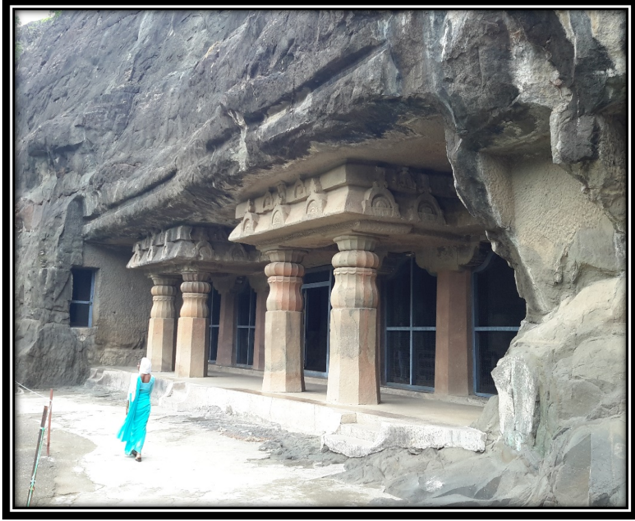
Ek 12- VI numaralı mağaranın ön cephesi.