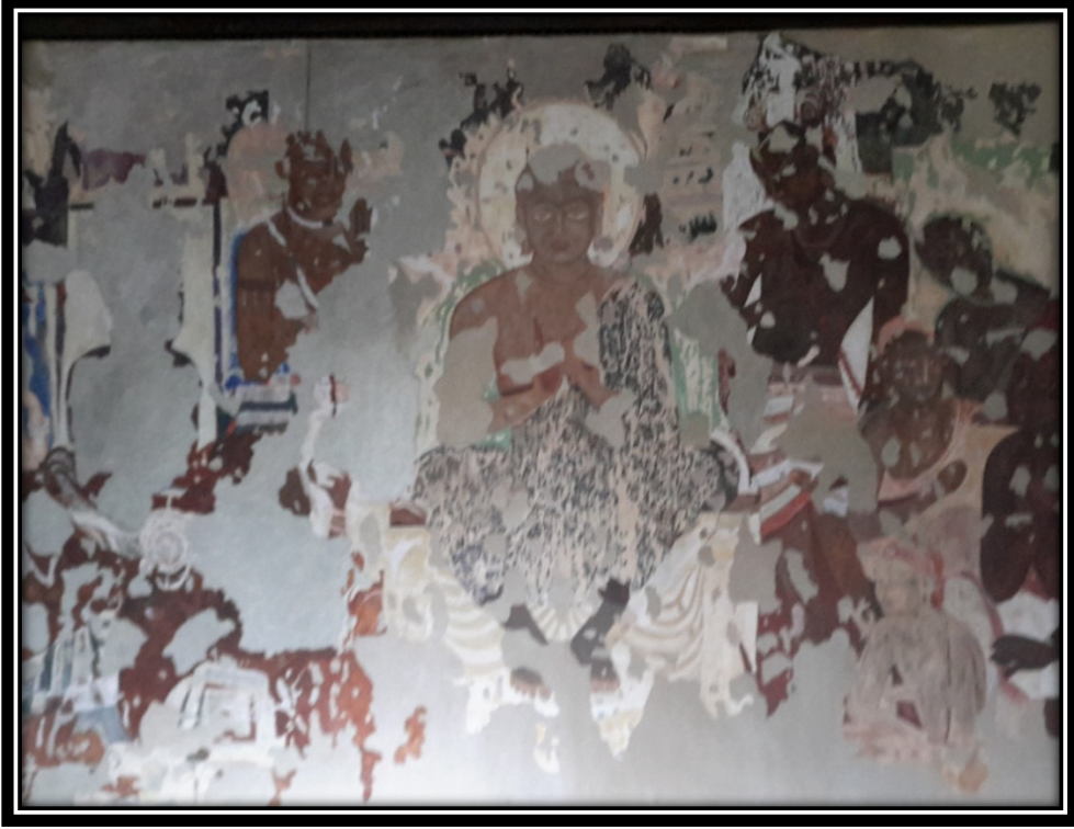
Ek 14- XV numaralı mağaradaki duvar resimlerinden.