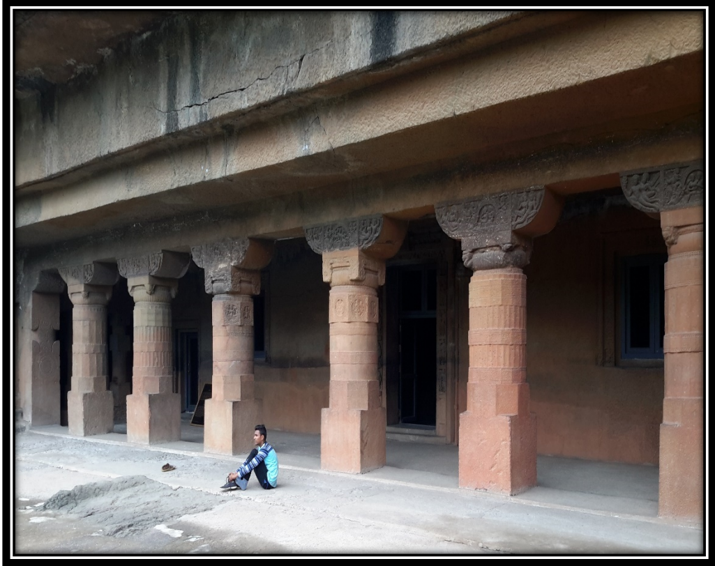
Ek 25- XXIV numaralı restore edilmiş ön verandası ve sütunları.