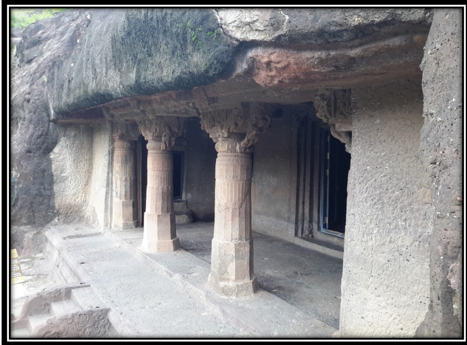
Ek 21- XX numaralı mağaranın verandası.