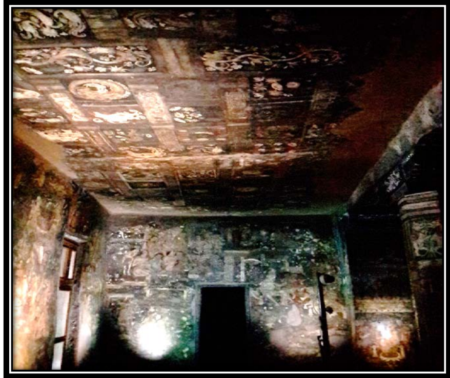
Ek 19- XVII numaralı mağaranın duvar resimleri.