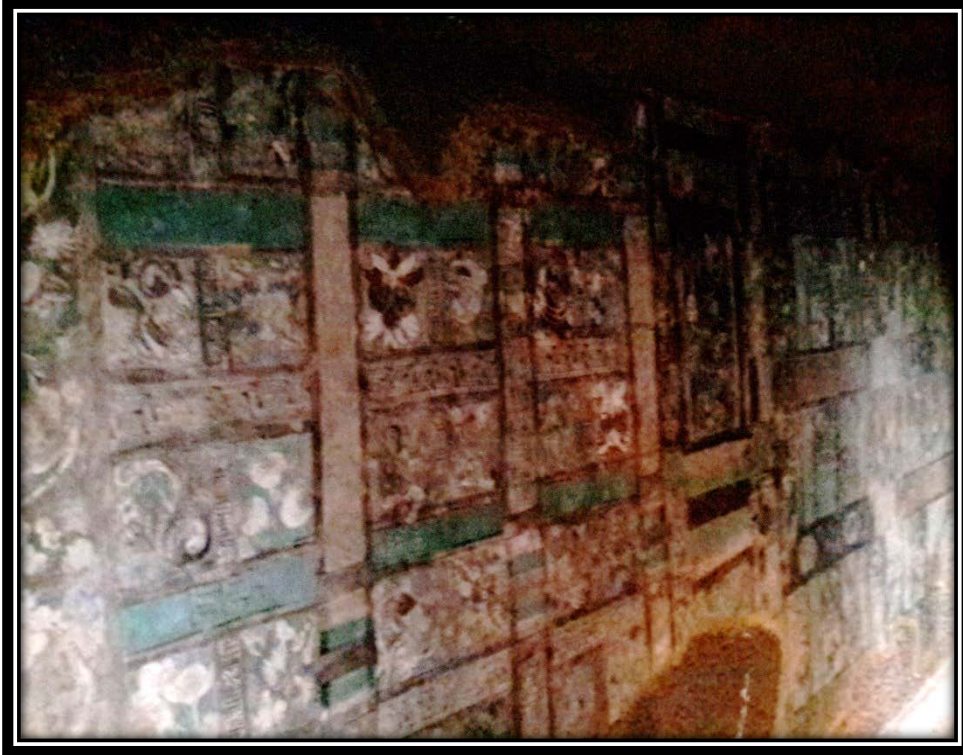
Ek 23- XXI numaralı mağaraya ait mavi rengin yer aldığı duvar ve tavan süsleri.