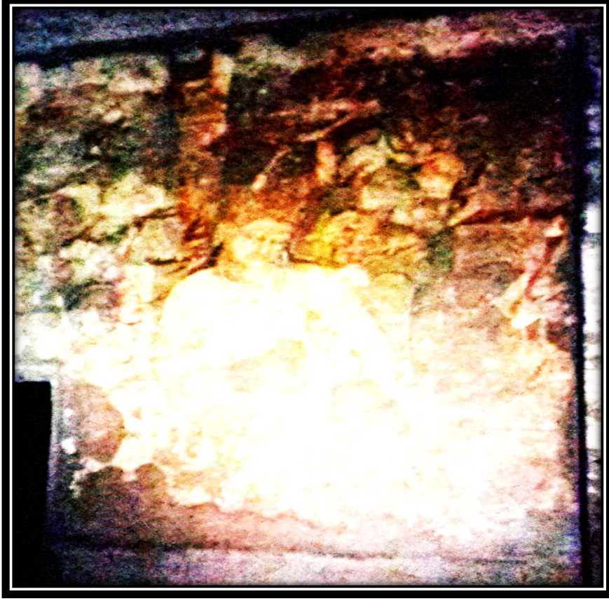
Ek 4- Bodhisattva Padmapāṇi