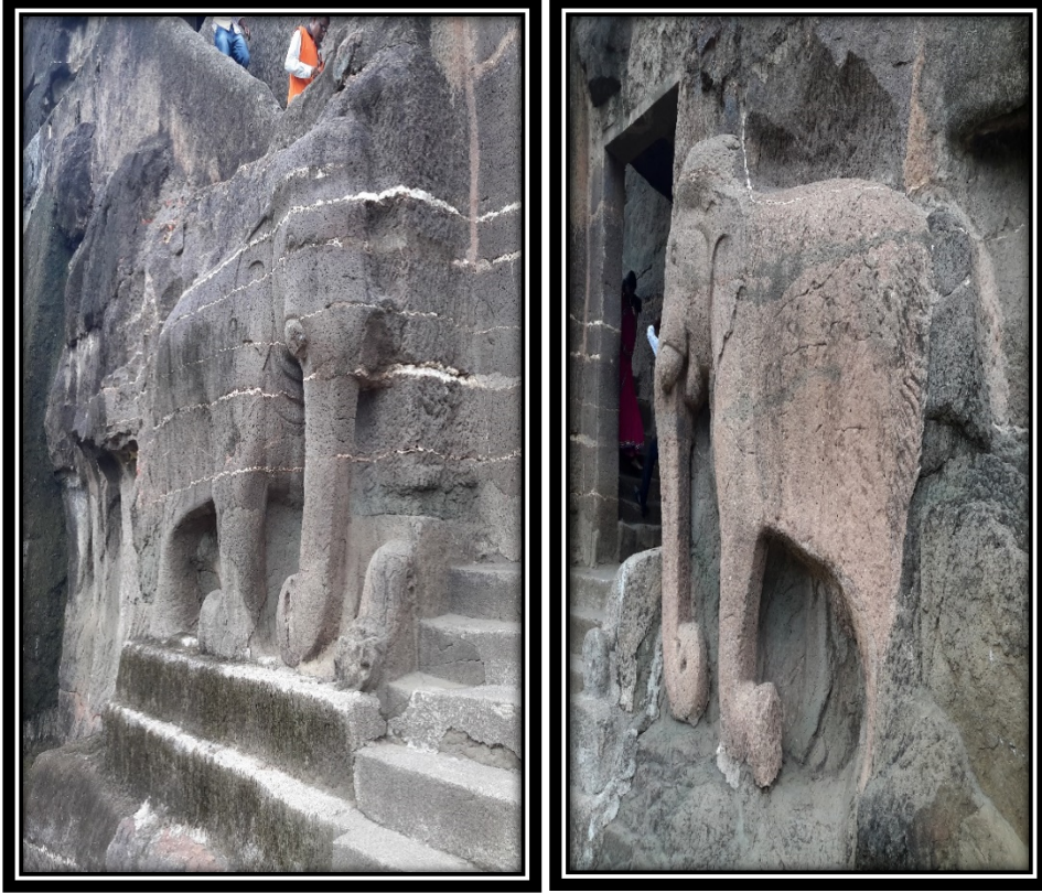
Ek 16- XVI numaralı mağaranın merdivenlerindeki fil heykelleri.