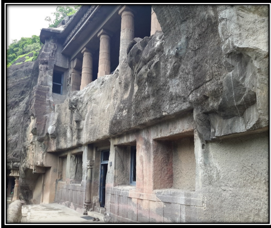
Ek 11- İki katlı VI numaralı mağaranın ön cephesi.