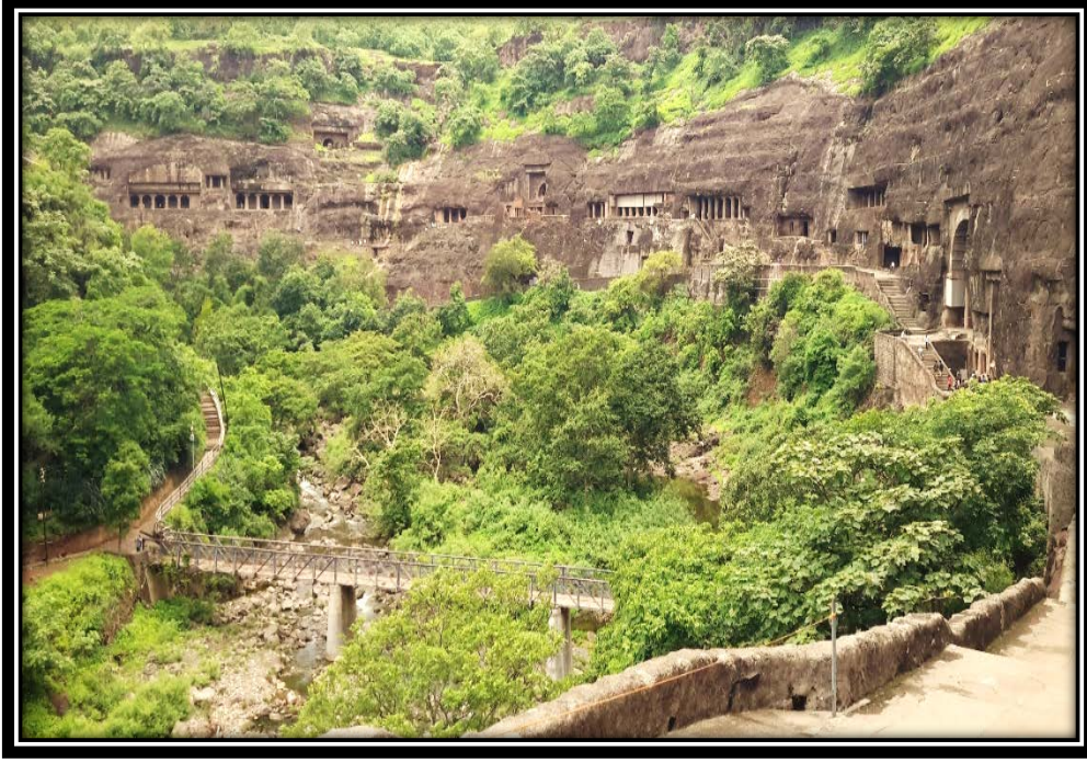
Ek 2- Acanta mağaralarının genel görünümü.