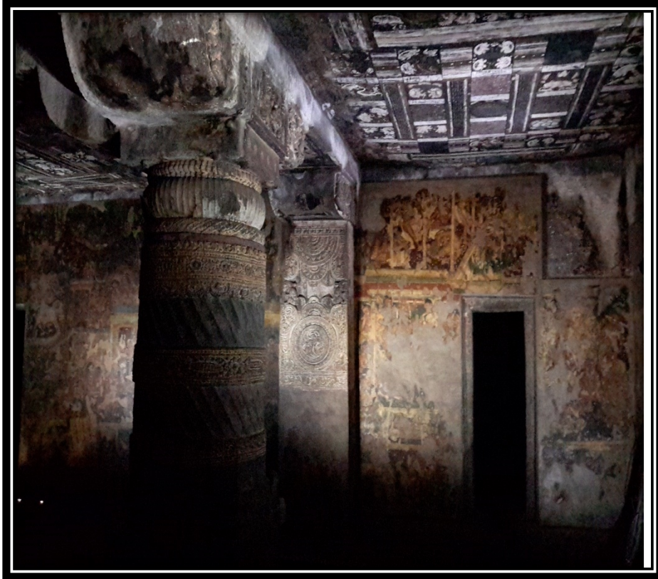
Ek 7- II numaralı mağaranın duvar ve tavan resimleri.