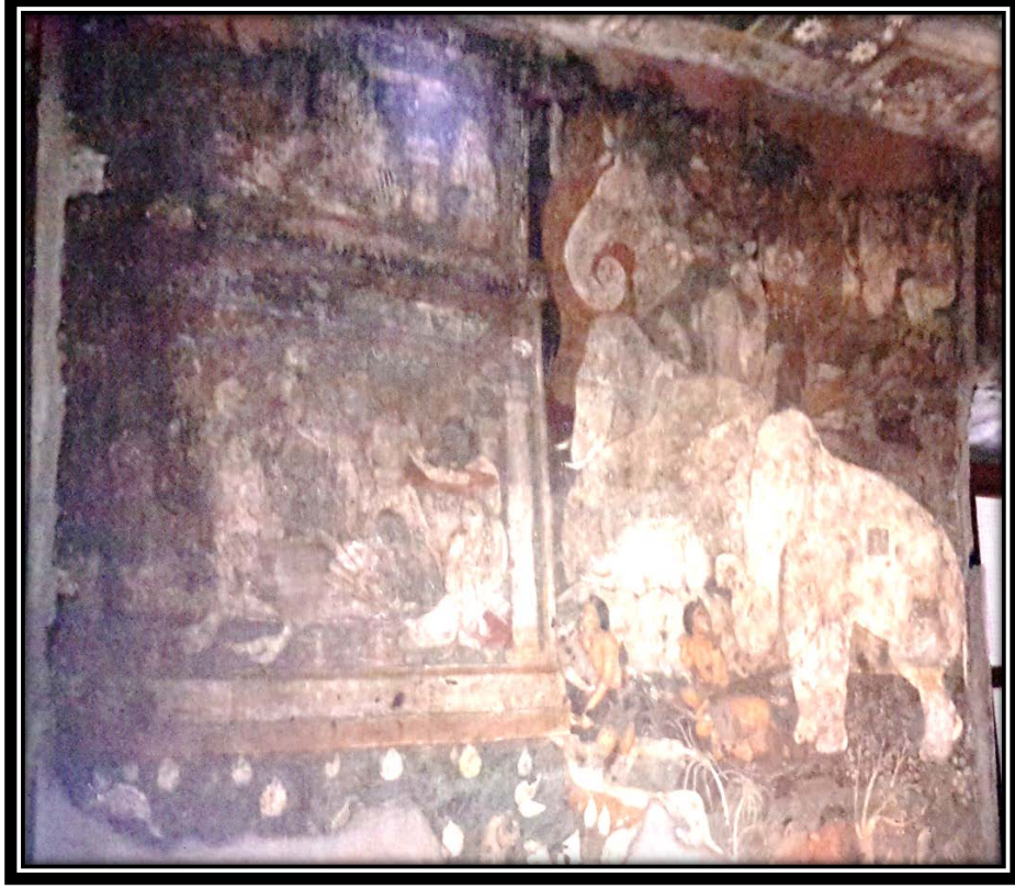
Ek 20- XVII numaralı mağaranın Çandatta Cātaka'ya ait duvar resmi.