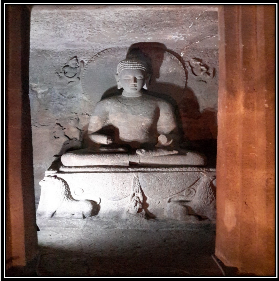
Ek 15- XV numaralı mağaradaki Buddha heykeli.