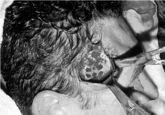
Şekil 1: Sağ temporal bölgedeki kemik grefti üzerindeki krampon izi benzeri litik oluşumların operasyon esnasındaki görüntüsü.

En son operasyondan sonraki 1 yıllık izlem periyodunda hiçbir komplikasyon gelişmedi.