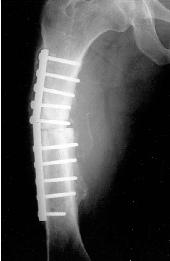
Resim 1: Ameliyat öncesi grafide femurda kronik nonunion.

Ocak 2005 tarihinde olgu ameliyata alınıp kırık segment uçları debride edilerek yenilendi ve 10 cm.'lik defekt oluşturuldu. Sol taraftan 20 cm.'lik fibula flebi alınarak pediküle zarar vermeden tam ortadan osteotomi ile ikiye bölündü (Resim 2). Çift tabaka serbest fibula flebi defekte