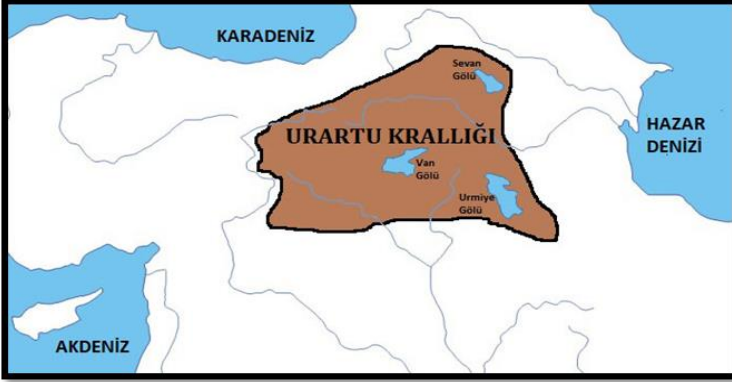
Resim 2: Urartu Krallığı'nın Yayılım Alanları (Harita Tarihçi Erol Yılmaz tarafından çizilmiştir)

Murat Vadisi'nde güçlü bir egemenlik kurmak önemli hedefleri arasında yer almıştır. Urartu'nun batı bölgelerine yönelik yayılım hedefleri bölgede ele geçirilen birçok Asur ve Urartu yazıtından anlaşılmıştır. Söz konusu yazıtlar arasında Surp Pogos, İzoli, Palu, Patnos, Bahçecik, Aznavurtepe, Horhor, Hazine Kapısı ve Analıkız gibi Urartu yazıtları ile Asur İmparatorluğu'na ait Birkin Çayı, Nimrud, Siyah Obelisk ve Kurh Steli yazıt ile kayıtlarıdır 87 . Urartu kralı Menua'nın batı yayılımındaki asıl amacı Meliteia (Malatya) Krallığının egemenlik kurduğu coğrafyada güçlü bir hâkimiyet kurmak şeklinde gelişmiştir. Doğu Anadolu Bölgesi'nin batısı olarak tanımladığımız coğrafyada kurulacak güçlü bir Urartu hâkimiyeti aynı zamanda İç Anadolu Bölgesi'nden Akdeniz'e kadar uzanan sahadaki ticari yollara hâkim olmak, bu bölgelerdeki maden kaynaklardan yararlanmak 88 ve nihayetinde bölgedeki Asur egemenliğini zayıflatmak anlamına gelmiştir 89 . Urartu'nun batıya yönelik yayılımında Muş ve Bingöl coğrafyaları sıklıkla kullanılan ana güzergâh olmuştur.