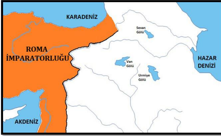
Resim 4: Anadolu Coğrafyasında Roma İmparatorluğu'nun Askeri ve Siyasi Yayılımı (Harita Tarihçi Erol Yılmaz tarafından çizilmiştir)

Septimius Severus'un Roma tahtına oturmasıyla birlikte Roma rakiplerine karşı büyük savaşlar başlatmıştır 123 . MS 196 yılında Roma ordusu Partlara karşı seferler başlatmış 124 daha sonra MS 197 yılının yazında ise Severus, Partların başkentine doğru harekete geçmiştir 125 . Bu sefer sonunda Septimius Severus 126 , Partların başkenti Ktesiphon'u 127 yağmalamış; Fırat ve Dicle Nehirleri arasındaki coğrafyada Roma İmparatorluğuna bağlı yeni eyaletler kurmuştur 128 . Roma, Doğu Anadolu Bölgesi'nde güçlü bir egemenlik kurduktan sonra Akhaimenid ve Seleukoslar Döneminde olduğu gibi Van ve Muş Bölgelerini Armenia olarak tanımlamıştır. Doğu Anadolu Bölgesi'ndeki Roma nüfuzu ve işgal faaliyetleri kendi gücünün yanı sıra rakiplerinin gücüne de bağlı olmuştur. Van ve Muş coğrafyaları