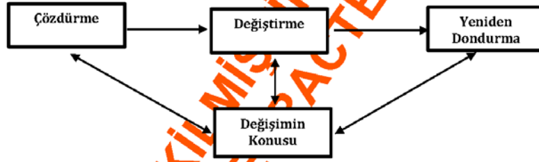
Şekil 2: Üç Aşamalı Değişim Modeli

• Yeniden Dondurma: Yeni durum ile birlikte değiştirilen örgüt yapısı, ödüllendirme sistemleri, performans değerlendirme ölçütleri, prosedürler, tanımlamalar, ilişkiler yeniden düzenlenmektedir. Bundan sonra işletmenin alt sistemlerinin bu yeni durumu temel alarak faaliyete geçmesi sağlanmaktadır. En sonunda yeni durum, örgütün asıl çalışma sistemi haline gelerek devamlılık kazanmaktadır.