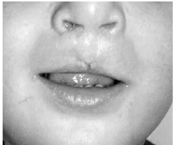
Şekil 6: Hastanın postoperatif 1.5 yıl sonraki görünümü.