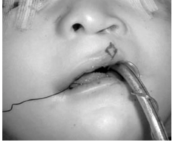
Şekil 8: İntraoperatif planlama. Vermiliokutaneal hat ile vertikal skarın birleşim yerinden romboid skar eksizyonu.