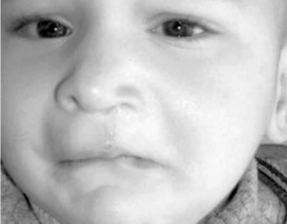
Şekil 9: Hastanın postoperatif 6 ay sonraki görünümü.