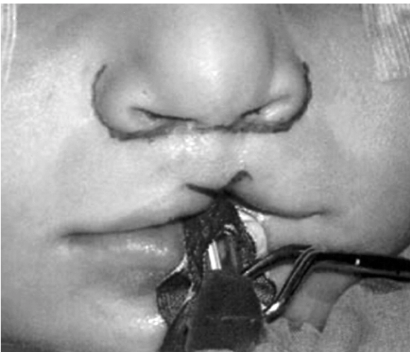
Şekil 5: Hastanın intraoperatif planlanması: Vermilion fleplerinin yeniden kaldırılarak ilerletilmesi ve burun kanadı rotasyonu.