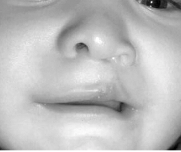
Şekil 7: Vertikal dudak boyu kısalığı ve vermiliokutaneal hatta çentiklenmesi olan hasta.