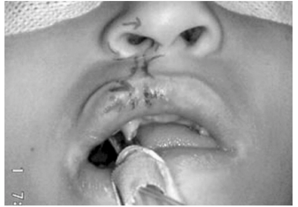
Şekil 2: Hastanın intraoperatif planlanması: Skar eksizyonu, kas onarımı, vermilion fleplerinin ilerletilmesi ve ayrıca burun kanadı rotasyonu.