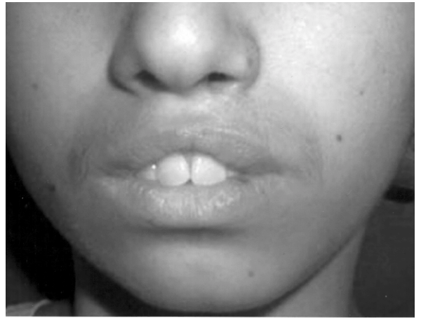
Şekil 10: Tüberkül yetmezliği ve whistle (ıslık çalma) deformitesi olan hasta.