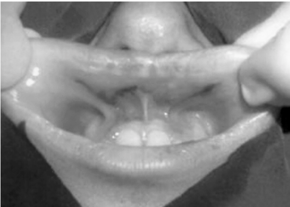
Şekil 11: İntraoperatif planlama: Vestibüler bölgeden W mukozal ilerletme flebinin planlanması.