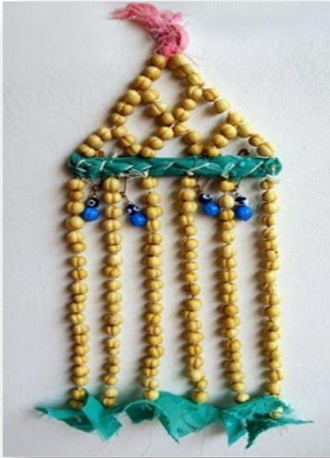
Şekil 1 Üzerlik Otundan Yapılmış Duvar Süsü Örneği

Salda Köyü'nde ateş kültünün başka kültürlerle karışık halde varlığını devam ettirdiği görülmektedir. Nazar için hazırlanacak olan kurşun, ocakta yakılan ateşle yapılmaktadır. Büyü olduğunu düşündükleri zamanlarda ise ateşe; üzerlik, elduran, buhur gibi koruyucu olduğuna inanılan otlar atılmakta ve dua edilmektedir. Böylelikle yapılmış olan büyü'nün bozulacağına inanılmaktadır. Dökülen saçların, kesilen tırnakların ateşe atılarak yok edilmesi gerektiğine inanılmaktadır. Bunların çöpe atılması durumunda ise baş ağrısı gibi çeşitli rahatsızlıkların yaşanabileceğini düşünmektedirler. Ateşin hem kötü ruhlara hem de iyi ruhlara ev sahipliği yapabileceğinin düşündükleri için, ateşe olabildiğince saygı göstermeye çalışmaktadırlar. Ayrıca üzerlik otundan yapılan gösterişli bir duvar süsünün de nazar gibi istenmeyen durumlara karşı koruyucu vasfının olduğuna inanılmaktadır.