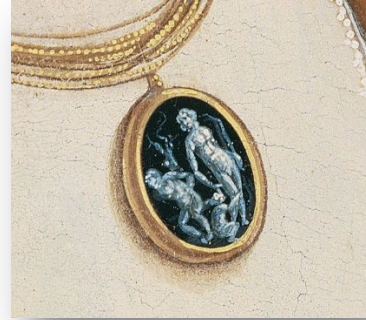
Resim 8: Sandro Botticelli, Genç Kadın Portresi (detay)/ Sandro Botticelli, Portrait of a Young Woman (detail)