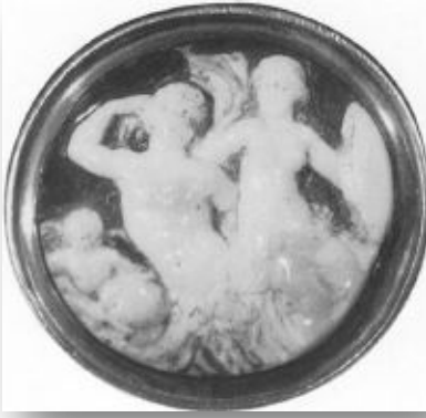
Resim 14: Nereid ve Triton, Antik kameo, Paris, Bibliothèque Nationale/Nereid and Triton, Antique cameo, Paris, Bibliothèque Nationale (Perry 1993: 278)