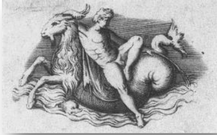
Resim 12: Enea Vico, Oğlak, kırmızı akik kameo gravürü/Enea Vico, capricorn engraving after antique cameo (Perry 1993:277)