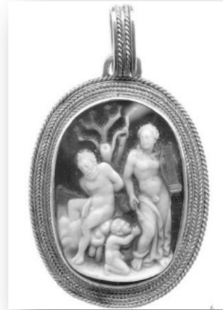
Resim 6: Oniks kameo, 15.yy, 21x16mm, Özel koleksiyon, Londra/Onyx 21x16mm, 15th century, Private London (Rambach 2011: 150)