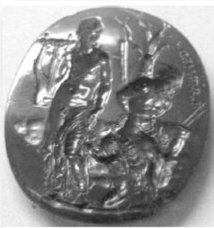
Resim 5: Seal of Nero (Neron'un Mührü, 21x16 mm, İ.Ö 30-İ.S.20 cameo, Roma/Seal of Nero 30 BC-20AD, Rome Collection, (Rambach 2011: 149)