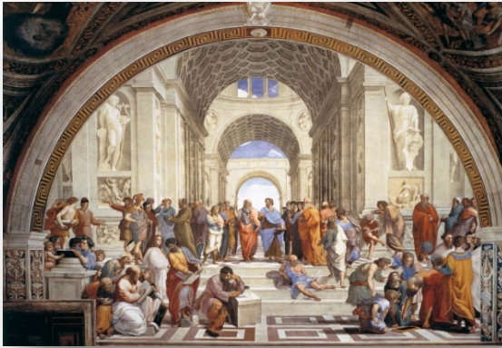
Resim 9: Raffaello, Atina Okulu, fresk, Stanza della Segnatura, Vatikan, 1509/ Raphael, School of Athens, fresco, 1509 (Paolucci 2011: 40).