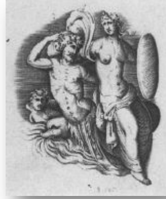
Resim 15: Enea Vico, Nereid ve Triton, antik kameodan üretilmiş gravür/ Enea Vico, Nereid and Triton, engraving after antique cameo (Perry 1993: 277)