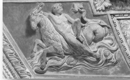
Resim 13: Federico Zuccari, Palazzo Grimani alçı süslemeleri/ Federico Zuccari, Palazzo Grimani stucco (Perry 1993: 277).