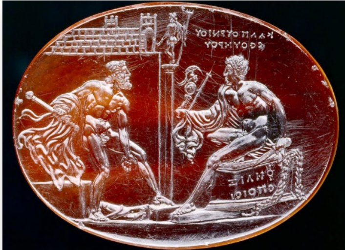
Resim 3: Felix Gem, kırmızı akik kameo, İ.S. 1-50, 2.65x3.5cm, Roma-İtalya/The Felix Gem, sardonyx cameo, A.D.1-50, 2.65x3.5 cm, Rome-İtaly (URL-3)