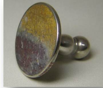
Resim 2: Çobanların tapınması intagliosu, yandan görünüm/ Adoration of the Shepherds intaglio, side view (URL-2)