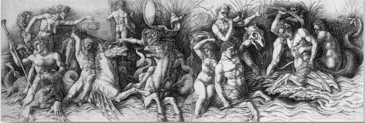
Resim 4: Andrea Mantegna, Deniz Tanrılarının Savaşı, oymabaskı, 1470'ler, 283x826mm, Devonshire Koleksiyonu, Chatsworth/Andrea Mantegna, Battle of the Sea Gods, engraving, 1470s, 283x826 mm, Devonshire Collection, Chatsworth (URL-4).