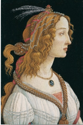
Resim 7: Sandro Botticelli, Genç Kadın Portresi, 1480-85, Ahşap üzerine tempera 82.54 cm, Stadelsches Kunstinstitut Frankfurt/ Sandro Botticelli, Portrait of a Young Woman, 1480-85, tempera on wood, 82.54 cm, Stadelsches Kunstinstitut Frankfurt (URL-5)