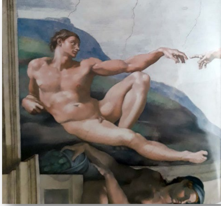
Resim 17: Michelangelo, Sistine Şapeli tavanı, Âdem'in Yaratılışı (detay) 1511/Michelangelo, Sistine Chapel ceiling, Creation of Adam (detail),1511 (Cecilia 2015: 66).