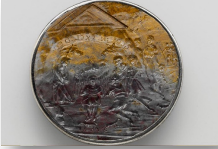
Resim 1: Çobanların tapınması intagliosu. 1500 dolayları, yeşim taşı ve gümüş, Milton Weil Koleksiyonu, Kuzey İtalya/ Adoration of the Shepherds, 1500s, jasper and silver, The Milton Weil Collection, Northern Italy, (URL-1)