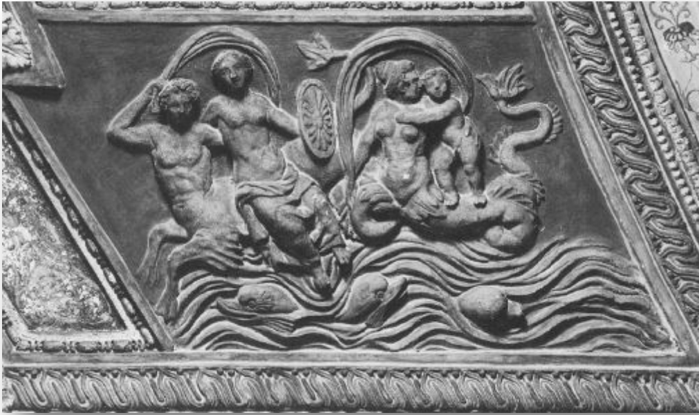
Resim 16: Federico Zuccari, Nereid ve Tritonlar, Palazzo Grimani alçı süslemeleri/ Federico Zuccari, Nereid and Tritons, Palazzo Grimani stucco (Perry 1993: 276).