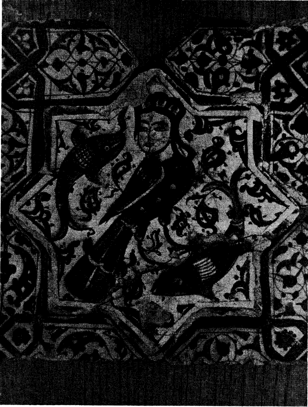
Res. 8 — Kubâd - Âbâd. Sarayı Çinilerinde Balıklı harpi Figürü (Konya Çini Eserleri Müzesi)