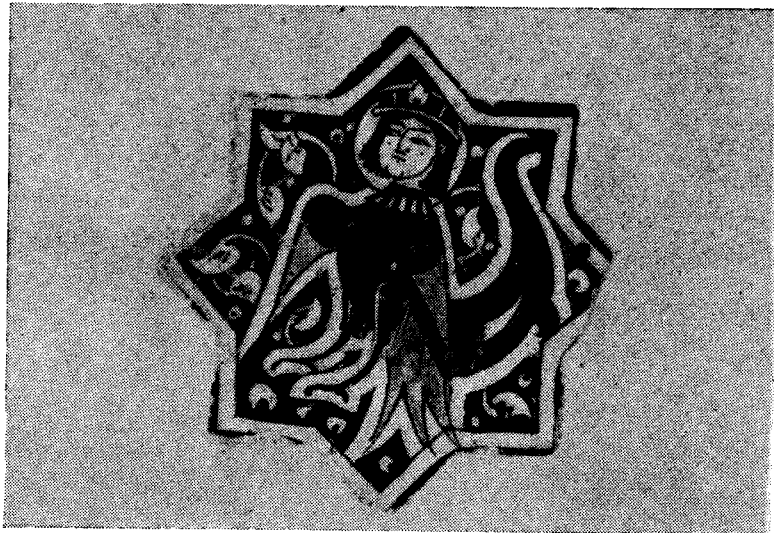
Res. 11-12-13 — Kubâd - Âbâd Sarayı Çinilerinde harpi figürleri (Konya Çini Eserler Müzesi)