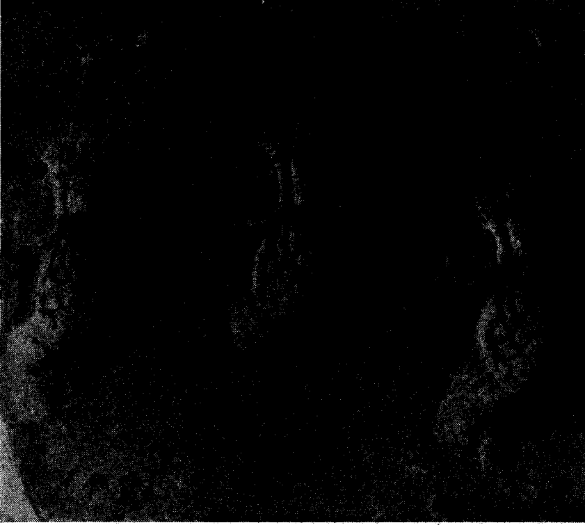
Res. 2A — Keramik üzerinde harpi figürleri. XII. Yüzyıl (Semerkand Müzesindedir)