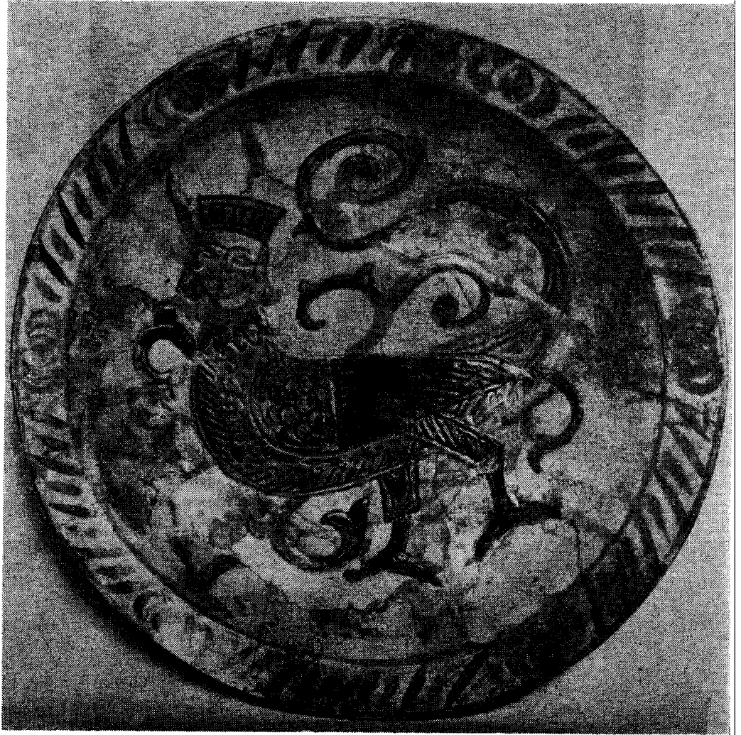
Res. 7 — Harpi resimli Tabak (Londra - British Museum, İs. Ab. 38)