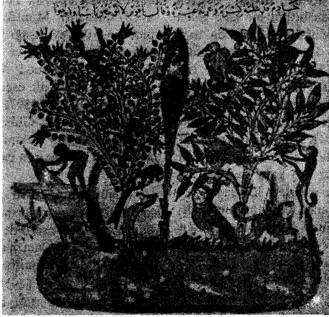
Res. 1 — Makamat-ı Hariri minyatürleri arasında Harpi ve Simurg'lu sahne (Paris - Bibliothèque Nationale, Ms. Ar. 5847)