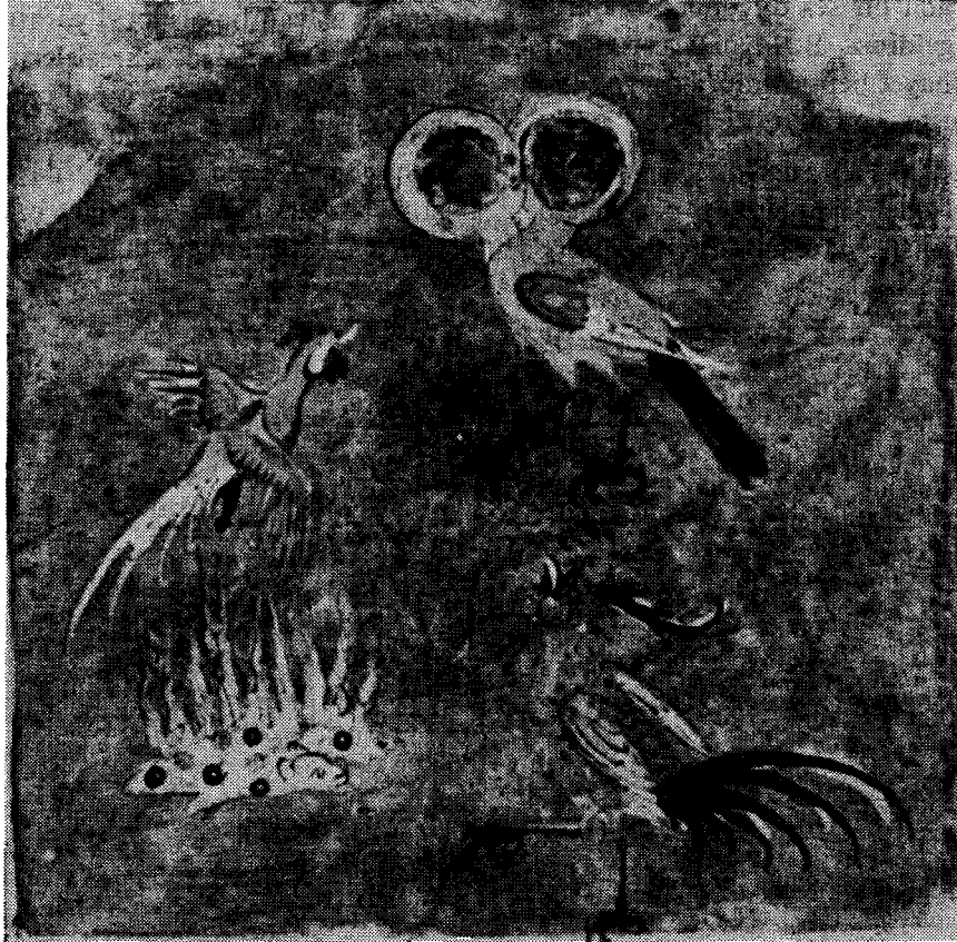
Res. 2 — Aca'ib-ül-Mahlukat minyatürleri arasında çift başlı harpi ve Simurglar (Türk ve İslâm Eserleri Müzesi yazmaları, 2013)