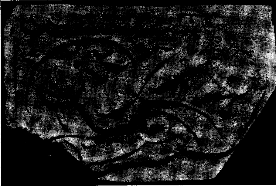
Res. 3 — Konya Kılıç Arslan II, Sarayı (Selçuklu Köşkü) alçı süslemeleri arasında harpi figürü. (Türk ve İslâm Eserleri Müzesi, 2340).