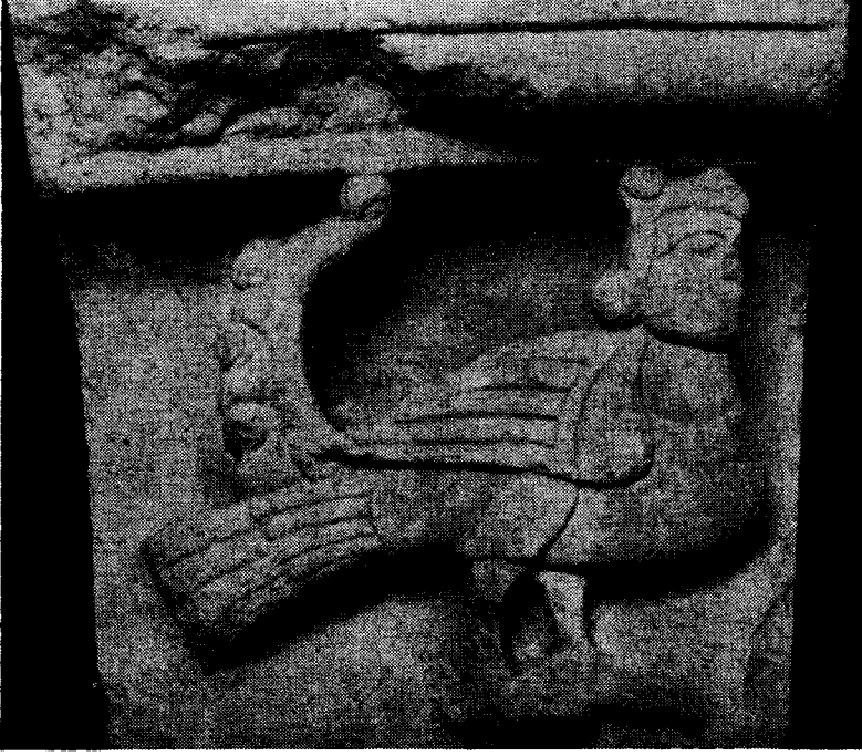
Res. 5 — Konya Surlarına ait harpi'li taş kabartma (Konya Selçuklu Devri Taş ve Ahşap Eserleri Müzesi, 886)