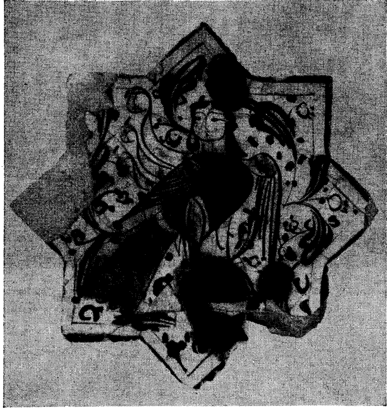
Res. 10 — Kubâd-Âbâd Sarayı Çinilerinde Harpi Figürleri (Konya Çini Eserleri Müzesi)