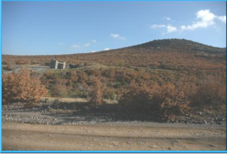
Şekil 2. Ladik Çırakman Mevkii galeri girişi. Figure. Entrance of the mine gallery at Ladik Çırakman area.