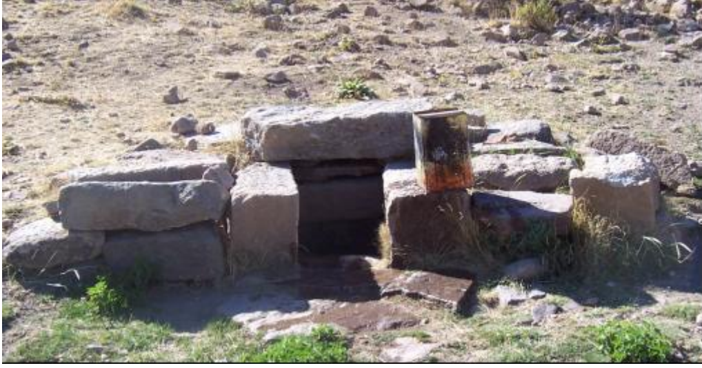
Şekil 4. Meram İlçesi Erengirit-Karamutlu maden galerisi. Figure 4. A mining gallery at Erengirit-Karamutlu area, Meram town.