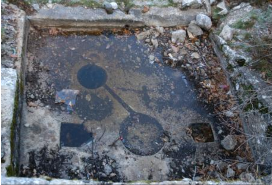
Şekil 3. Ladik Çırakman yöresinde muhtemel antik maden işleme yeri. Figure 3. Possible processing site of antique mine at Ladik Çırakman area.

Havuz, yukarıdan taşları keserek elde edilen 20 x 20 cm. geniş ve derinlikte üstü açık bir su kanalıyla su getirilmişti. Bu suyla ergitilen cıva madeni soğutulmuş olmalıydı. Bölgenin ormanlık yapısı da geçmişte bu alandaki ağaçların ergitme işlemlerinde kullanıldığını düşündürmektedir. Günümüzde zaman zaman