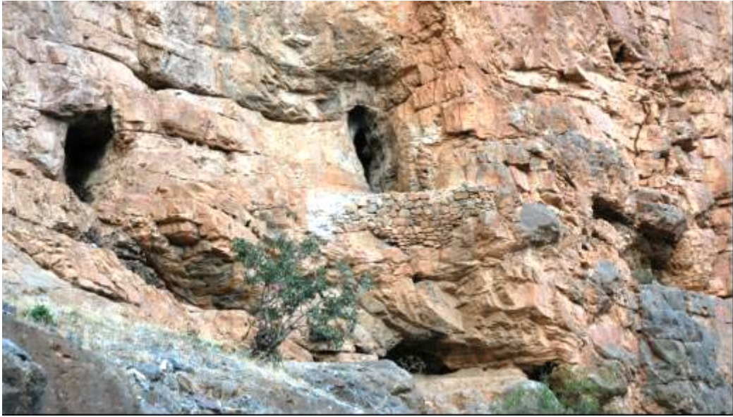
Şekil 5. Göksu Bağbaşı Baraj Dolum Alanı Cıva galerileri. Figure 5. Hg galleries at the filling area of the Goksu Bagbasi Dam.

4) Hadim, Dedemli Geriş Madenleri: Geriş, Konya ilinin Hadim ilçesi Dedemli Kasabasının yayla kesiminde 2000 m. deniz seviyesinden yükseklikte yer alır. Geyik Dağlarının kuzeyinde Torosların zirvesindeki Geriş'te antik Roma dönemi ve Osmanlı dönemi işletilen maden ocakları 1980-90 arası özel sektör tarafından işletilmiştir. Şu anda eski ocak girişleri kapatılmıştır. Çevrede az sayıda Roma dönemi çanak çömlek parçası tespit edilmiştir.