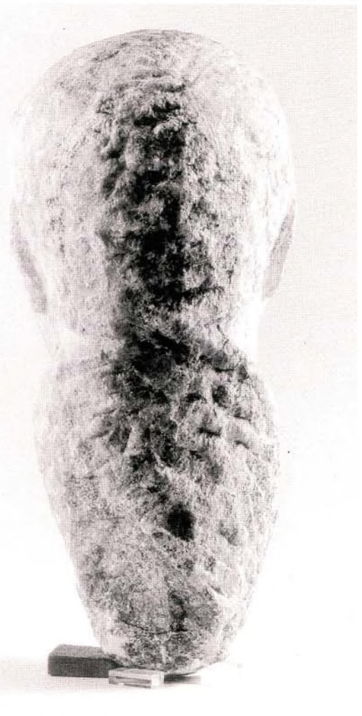
Resim : 4 Acarlar Portresi. Başın Arkadan Görünümü ve Geçki Bölümü