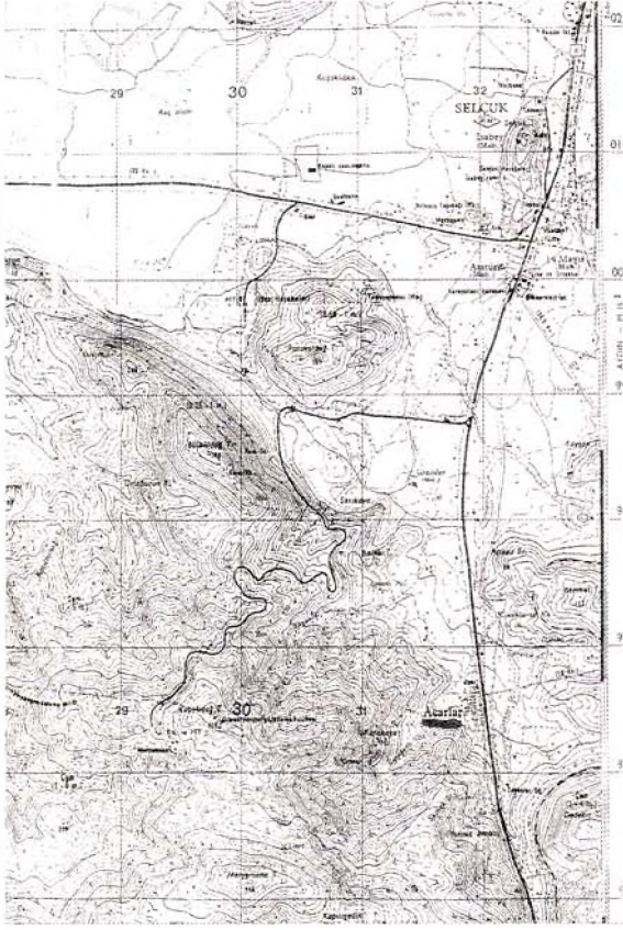
Harita : 1