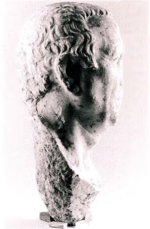
Resim : 1 Acarlar Portresi. Başın Sağ Yanından Görünümü.

Sonuç olarak, Acarlar portresinde Hellenistik dönemin karakteristik patetik yüz ifadesini açıkça görmekteyiz. Ayrıca, portredeki başın hareketi Hellenistik Dönemin belirgin bir hareketidir. Başın hareketi daha çok Efes'teki örnek ve Delos portreleri stilindedir. Bilindiği gibi Delos portreleri M.Ö. 1. yüzyılın ilk yarısına tarihlenmektedir. Acarlar portresi ise, Efes Müzesi'ndeki diğer örnek gibi M.Ö. 1. yüzyılın ortası veya ikinci yarısı portre özelliklerini taşımaktadır. Acarlar portresinde daha çok Iulius ve Claudiuslar dönemi portre özellikleri görülmektedir. Bütün bu anlatımlar doğrultusunda Selçuk Acarlar Köyü portresini de M.Ö. 1. yüzyılın ikinci yarısına tarihlendirmemiz daha doğru olur kanısındayız.