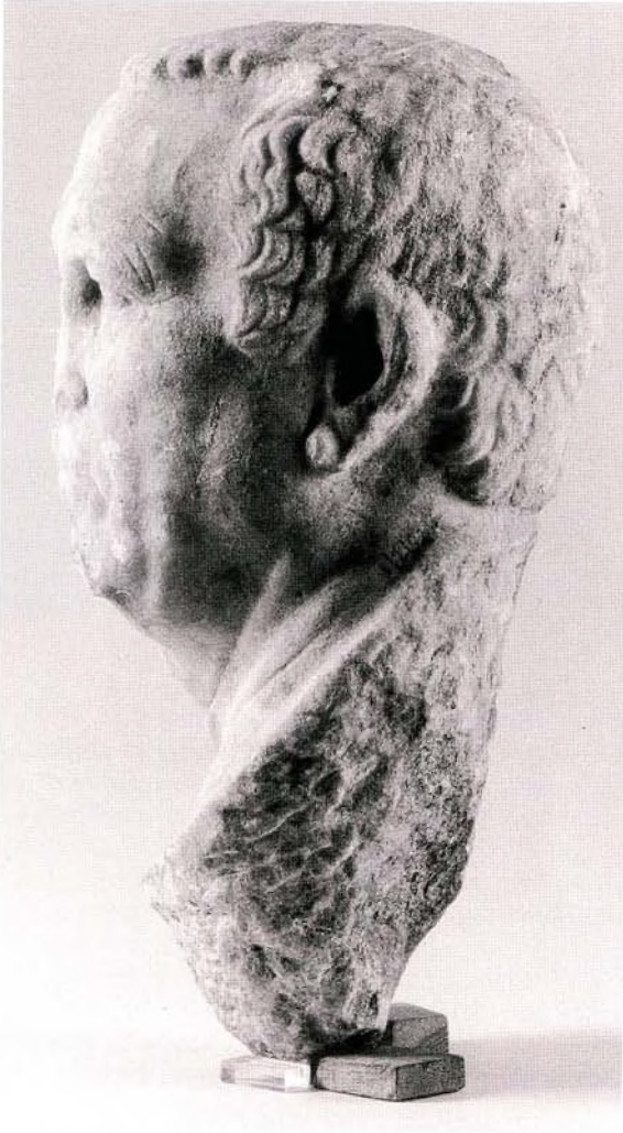
Resim : 3 Acarlar Portresi. Başın Sol Yanından Görünümü.