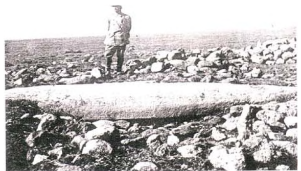
Geghama Dağlarında bulunan bir balık menhir (Kalanlar 1994 : 23)

Kars Müzesi bahçesinde korunan ve Kökten (1953: