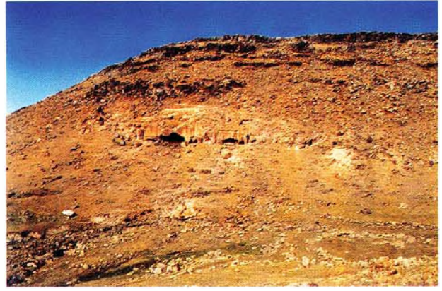
Çiftlik mevkiinin karşısındaki yarda tüflere oyulmuş bir kilise Kızıl Kilise

hayli eski dönemde yapıldığını düşündüğümüz çizgi teknikli kaya resimlerine rastlanır. Sadece bu bölgedeki çobanların bildiği bu çizim-resimler bazalt kayalığın yerden 0.50 m yüksekliğinden başlar. 2 m. uzunluğunda 0.70 m. genişliğindeki birinci resim yüzeyi, daha sonra günümüz insanlarınca üstlerine isim yazılarak ve kazınarak tahrip edilmiştir. İkinci kayalık birincinin 4 m. uzağında, 2.3 m. uzunlukta, 1.65 m. genişlikte bir kaya yüzeyi üzerinde yer alır. Genellikle çok küçük olan resimlerde insanlar, savaş silahları, atlar, ceylanlar, geyikler ve dağ keçileri yer almaktadır (Resim: 4). Özellikle bahsedilen in yakınındaki kaya panosunda yer alan geyik yavrusu ile dağ keçisi betimlemeleri, kayanın doğal patinası ve diğerlerine göre küçük olmaları nedeniyle zorlukla bulunmuştur.