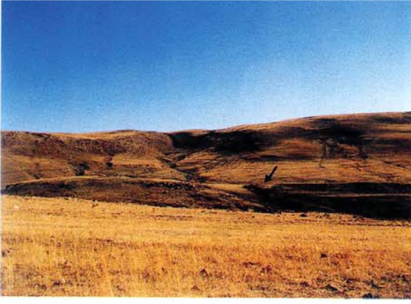
Çiftlik olarak adlandırılan tepe ve yanında yer alan kaya resimleri (okla işaretli)