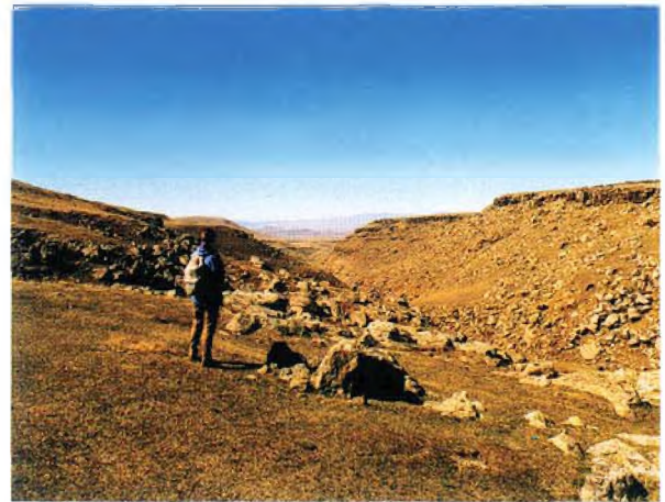
Harita: 2 Yazıda değinilen lokalitler

Kars civarı ile Kars-Kağızman arasında da stipalardan (sorguç otu) oluşan stepler vardır. Bu sahalarda yer yer quercus (meşe) ormanı kalıntılarına rastlanır. Daha doğudaki Tuzluca-İğdir depresyonunda