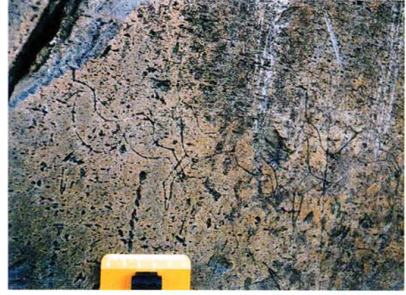
Harita: 4 Araştırma yapılan bölge çevresinde Kusanareva ve Chubinisvili(1970)'ye göre bazı M.Ö. 3000 yerleşim yerleri.

Avcılar Köyü'nün arazisi içinde ve Hanak'tan Koyunpinarı Köyü'ne giderken stabilize yolun yaklaşık 200 m. sağında, üzerinde küçük bir mezarlık bulunan