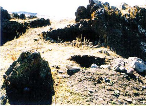
Harita: 3 Araştırma yapılan bölge çevresinde Kusanareva ve Chubinisvili(1970)'ye göre bazı eneolitik yerleşim yerleri

bu yarı çöl vejetasyonunun varlığı dikkat çeker (Sözer 1972). İğdir ovasının doğu ucu adeta tuzlu bir çöl görünümündedir. Burada başka türlerin yetişmesine karşılık Aras nehri boyunca salix (söğüt) ve tamarix (ılgın) gibi nemli ve sulak yerleri seven ağaçların elverişli bir yetişme ortamı bulunduğu görülür. Bu da bu bölgede değişik mikroklimaların olabileceğini akla getirir. Ağrı dağı yakınlarına gelindiğinde, bu yarı-çöl vejetasyonunun üst kısmında step başlar ve 2500 m.ye çıkar. Yapılan araştırmanın Ağrı Dağı eteklerindeki sınırlarında prehistoryadan bildiğimiz yabani buğdaygillerin benzerlerinin halen doğal olarak buralarda yetiştikleri gözlenmiştir. Ancak bu bulgunun kanıtlanması ve detaylı olarak türlerin saptanabilmesi için bölgede botanikçilerin detaylı araştırmalarına gereksinim vardır.