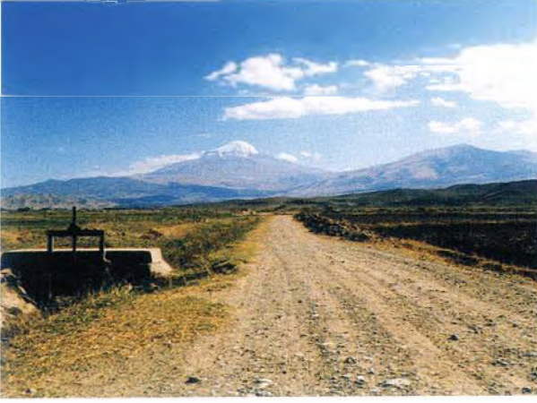
İğdir, Haşçiflik Köyü Kuşhabermevkii ve arkada Ağrı Dağı

akla getirir. Kökten'in aynı lokaliteyi mi kastettiğini yayındaki veri eksikliği nedeniyle bilemiyoruz.