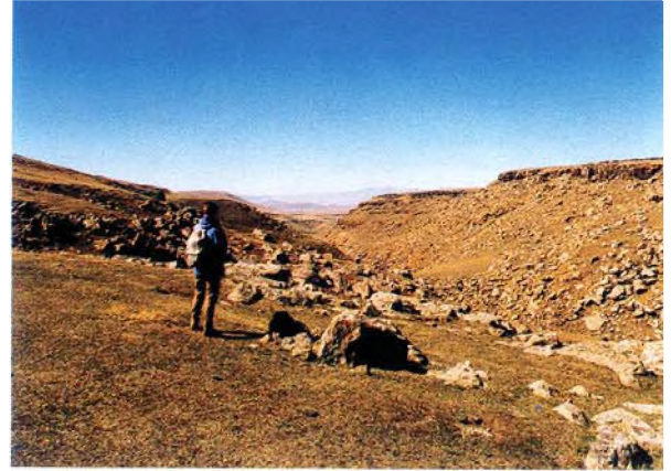
Vadiye doğru bir akma şeklinde oluşan tepe; Çiftlik Mevkii ve Borluk Vadisi.

tarafındadır. Bu mağaralardan ayrı olarak, köye girmeden önce kesişme noktasında görülen diğer bir mağara, gerek köye yakınlığı gerekse ağzı en büyük olması nedeniyle Kökten'in Mahmutçuk olarak andığı mağara olmalıdır.