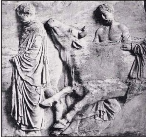
Resim 1: Parthenon frizinden kurbanlık boğa

Haberci İdaios getirdi bir sağrakla altın taşlar" (İlyada, 3/245-250).