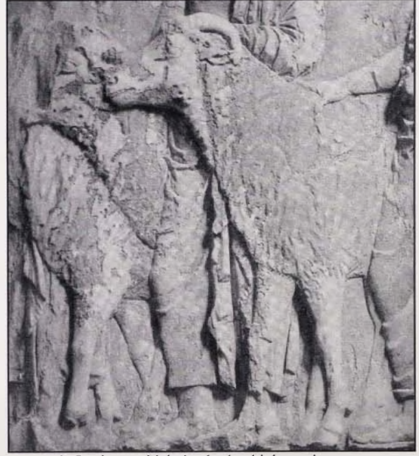
Resim 2: Parthenon frizinden kurbanlık koyunlar

"Güzel akan, ak anaforlu ırmak da koruyamaz sizi,