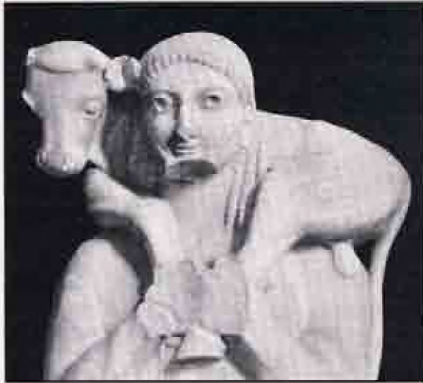
Resim 4: Atina Akropolis'i'nde bulunmuş buzağı taşıyan çoban heykeli (M.Ö. 560)

5. yüzyılın ikinci yarısına ait inek heykelinden 16 çok da farklı olmamalıdır.