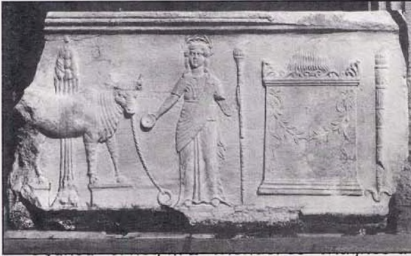
Resim 7: Bergama Demeter Kutsal Alanı kabartmalı korkuluğu (balustad)

bilir. Ancak basitçe örklenmiş 28 bir kurbanın görüntüsü Yunan mimarisinin ince hesaplar ve işçilikle meydana getirilmiş bütünlüğüne ve dinî eylemin gösterişine aykırı düşer. Bu nedenle büyük kutsal alanlarda mimari bir yapı olarak özenle inşa edilmiş altların önünde bekleyecek hayvan ya da hayvanların bağlanacağı özel bir düzeneğe ihtiyaç vardır. Klaros Apollon Tapınağı ile C altarı arasında üzerine demir halka monte edilmiş bloklar bulunmuştur 29 . Tapınağa getirilen kurbanlar törenler sırasında bu halkalara bağlanmaktaydı. Bergama Demeter Kutsal Alanı'nı çevreleyen korkuluk (balustrad) bloklarından birinde (bugün Bergama Arkeoloji Müzesi'nde sergilenmektedir) ateş yanan bir altar önünde ayakta duran ve sol elinde meşale, sağ elinde bir kap tutan tanrıça Demeter'in yanında, yerdeki bir halkaya örklenmiş bir boğa betimlenmiştir 30 . Ayrıca Demeter Kutsal Alanı'nda söz konusu kabartmada yer alan kurban halkasına ait olabilecek bir örk bloku 31 da bulunmuştur 32 .