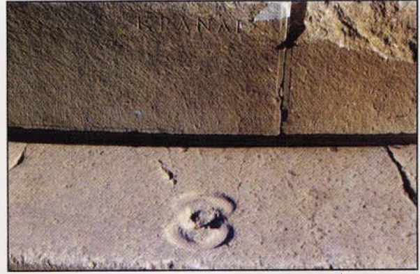
Resim 8: Kaunos Tiyatrosu yakınındaki yuvarlak yapının "ölçüm platformunun" 2. basamağındaki örk bloku

Kutsal alanlarda kurban kesimiyle ilgili başka bir soru da kurbanın kesim işleminin nasıl ve nerede yapıldığıdır. Bu soru ilk anda "mimari ya da taşınabilir altarlarda ve kutsal bir bıçakla" şeklinde cevaplandırılabilir. Bu yanıt kuşkusuz doğrudur, ancak ayrıntılarda açıklanması gereken bir kaç nokta vardır.