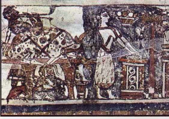
Resim 10: Hagia Triada Lahti'nden kurban sahnesi

tarihlenen bir siyah figürlü amfora üzerindeki sahnede bir boğa altı erkek tarafından yatay bir biçimde taşınırken, elinde kılıç ya da hançer bulunan yedinci figür boğayı boğazından keserek kurban etmektedir 40 . Bu örnekler bir yandan kurbanların yatay olarak kesilmesi gerekliliğine işaret ederken aynı zamanda kurbanların altarlara taşınabileceğini de gösterir.