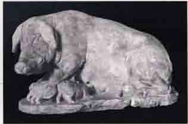
Resim 5: Kopenhag Glyptotek Müzesi'nde sergilenen, yavrularını emziren domuz heykeli.

Ayrıca kurbanlık hayvan konusunda antik kaynaklar ve arkeolojik buluntulara göre dişi hayvanların tanrıçalar, erkek olanlarının ise tanrılara kurban edildiğine yönelik genel bir kanı vardır 20 .