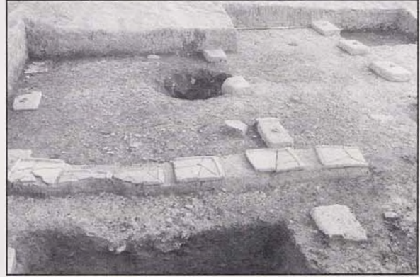
Resim 12 : Klaros Apollon Tapınağı örk blokları ve arasındaki pişmiş toprak tepsiler

yakılarak tanrıya ulaştırılacak bölümlerinin altara taşındığını göstermektedir. Zaten kurbanların doğrudan altarin içinde kesilerek yüzülmesi ve parçalanması altar içinde baş edilemeyecek kadar büyük bir temizlik sorunu, atıkların taşınması için büyük bir iş gücü ve zaman gerektirecektir. Bu nedenle kurbanın altar dışında kesilmesi pratik bir yaklaşım olacağı gibi, hem de törenler sırasında oluşacak büyük bir kargaşayı önleyecek ve zaten hemen hemen bütün kutsal alanlarda var olan su kaynaklarıyla atıkların kolayca temizlenmesine imkân verecektir. Herodotos'un aktardığı bir olayda da kurban kesenin yanında kurban etlerini koyacağı leğenler ve temizlik için su bulunması da bu tezimizi kuşkuya yer bırakmayacak bir şekilde doğrular niteliktedir.