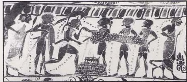
Resim 9: Bir amfora üzerine siyah figür tekniğinde resmedilmiş Polyksene'nin kurban ediliş sahnesi (M.Ö. 570-560)

Ressam Timiades tarafından siyah figür tekniğinde boyanan ve M.Ö. 570-560 yıllarına tarihlenen bir amfora üzerinde yer alan sahnede Polyksene, içinde ateş yanan küçük bir altar üzerinde yatay olarak tutularak kesilmektedir 37 . Gümüşçay yakınlarındaki bir tümülüste bulunan ve Çanakkale Müzesi'nde sergilenen Kızöldün Lahti'nde de aynı konu benzer şekilde işlenmiştir 38 . Hagia Triada Lahti'nde bir boğa kurban edilmek üzere bir masa üstüne ayakları bağlı olarak yatırılmış 39 Viterbo Müzesi'nde sergilenen ve M.Ö. 540'a