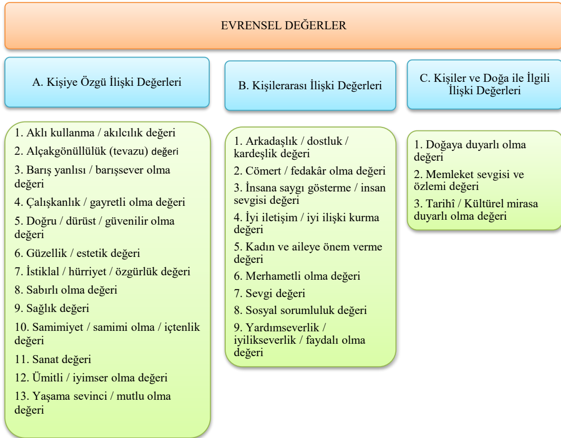
Şekil 2: Bedri Rahmi Eyüboğlu'nun Şiirlerindeki Evrensel Değerler