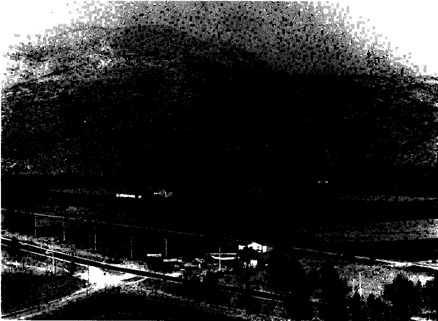
Resim 2 — Mağara'nın yeri.