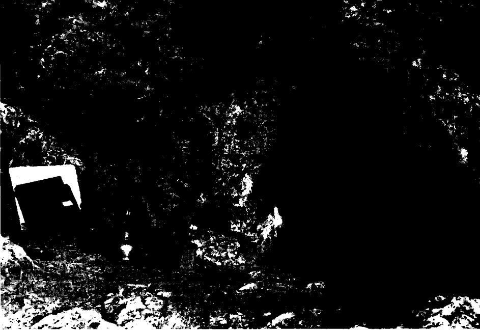
Resim 3 — Mağara'nın girişi.