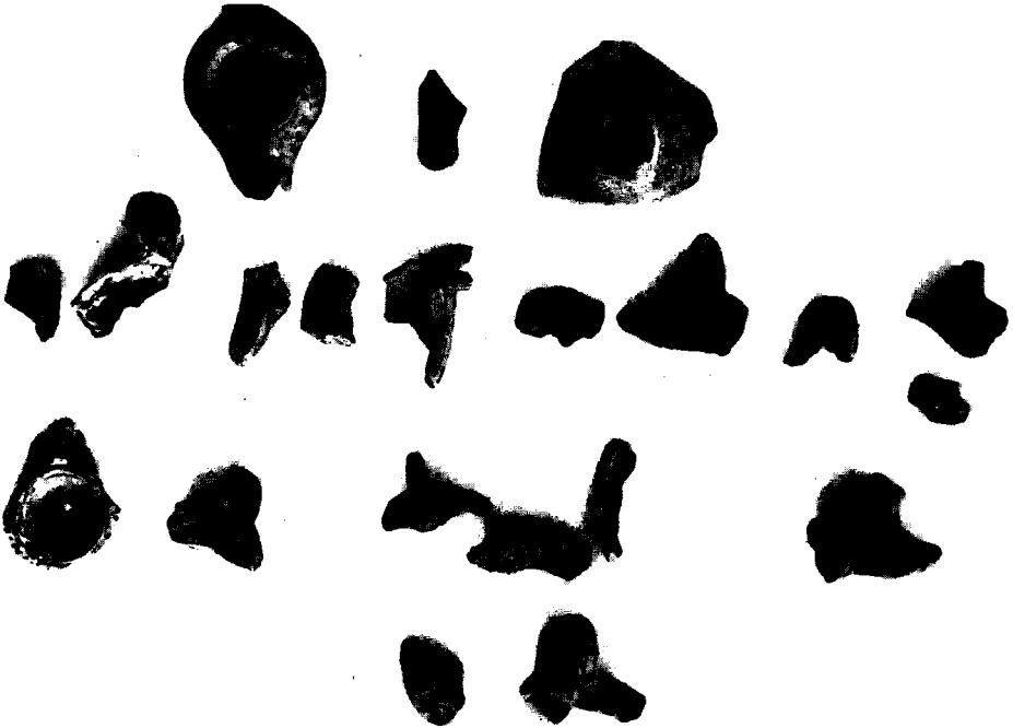
Resim 6 — Arkeolojik buluntular.