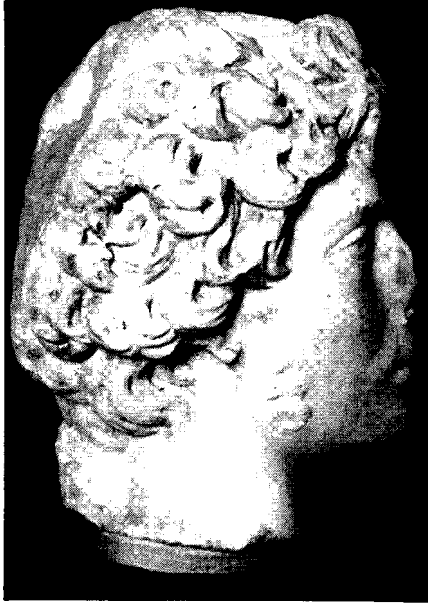
Resim: 1- Marcus Aurelius'un gençlik portresi