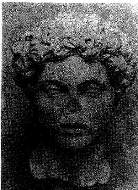
Resim: 4- Roma Museo Del Foro Romano