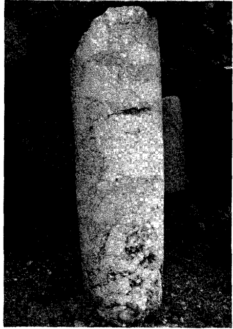
Resim: 1b- Küçük mil taşı