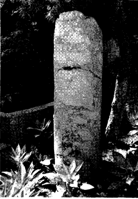
Resim: 1a- Küçük mil taşı