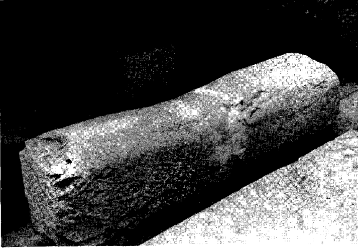
Resim: 2a- Büyük mil taşı