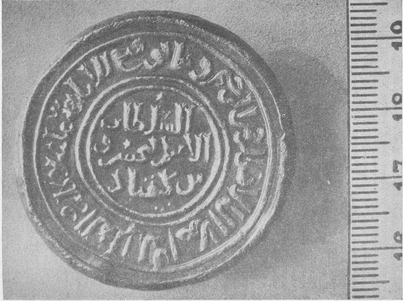
II noi G. Keyhüsrev'e ait Dinar'ın arka yüzü