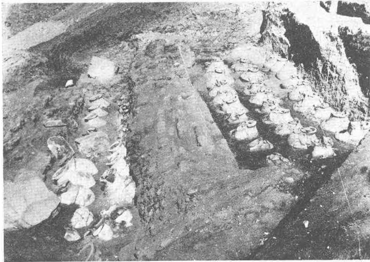
Levha : 2