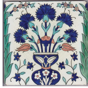
Resim 7-8. Hertford House dekorasyonunda kullanılan Minton çinileri