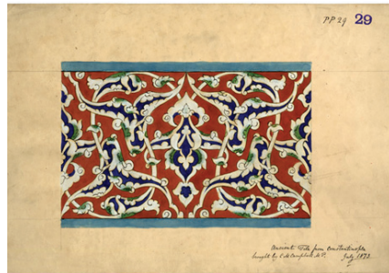
Resim 5-6. Minton arşivinden İznik çini deseni örnekler