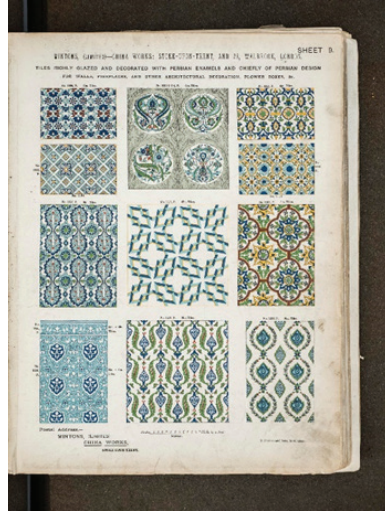
Resim 1-2. Minton katalogunda yer alan İznik çini desen örnekleri