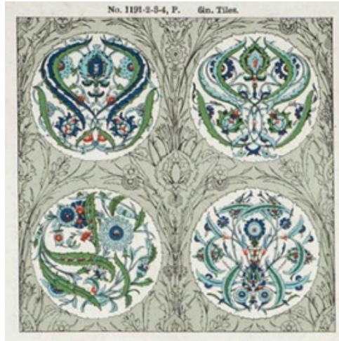
Resim 11. Bavyera Ulusal Müzesi tarafından satın alınan Minton çini örnekleri