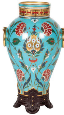
Resim 16-17. Minton üretimi İznik desenli tabak ve Cloisonné vazo