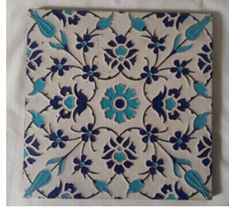
Resim 9-10. Bavyera Ulusal Müzesi tarafından satın alınan Minton çini örnekleri