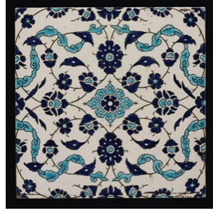
Resim 12-13. Viktorya & Albert Müzesi koleksiyonunda yer alan Minton çinileri