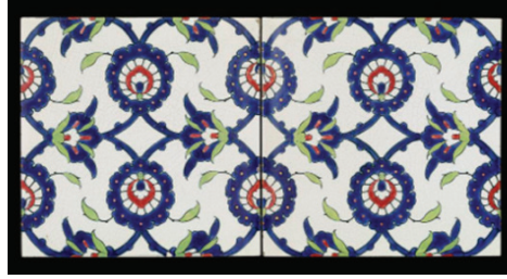
Resim 14-15. İznik deseni replikası olarak üretilmiş Minton çinileri