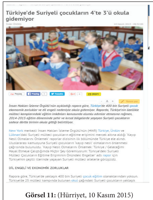
Görsel 11: (Hürriyet, 10 Kasım 2015)