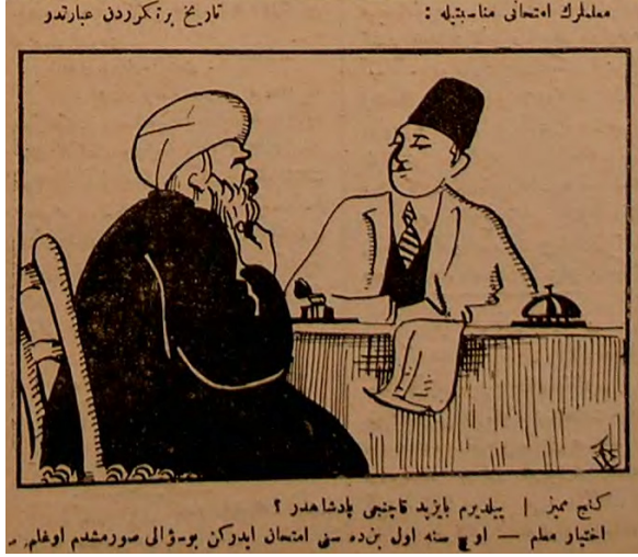
Görsel 9: (Aydede, “İmtihan Derdi”, 30 Kanunusani 1338/30 Ocak 1922, Numero 9, s.1.)

Yine aynı günlerde yayımlanan diğer bir karikatürde ise eski ve yeni muallimlerin durumu hem trajik hem de komik bir şekilde ele alınmıştır. Aşağıda görüleceği üzere masanın bir tarafında genç bir mümeyyiz ile diğer tarafındaki ihtiyar bir muallim arasında geçen imtihan süreci karikatürize edilmiştir.