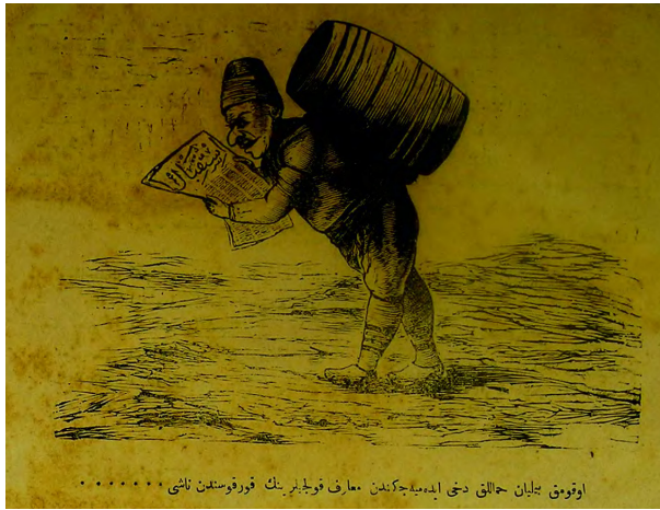
Görsel 7: (Hayal, 13 Eylül 1291/25 Eylül 1875, Numero 200, s.4.)

Hayal gazetesinin diğer sayılarında aynı konu ele alınmaya devam edilmiştir. Nitekim aşağıdaki karikatürde bir hamalın okuma yazma bilmeden hamallık yapamayacağı hicvedilmiştir. Elinde İstikbal gazetesi bulunan bir hamal sırtında yükü olduğu halde ilerlemektedir. Karikatürün altında ise okuma bilmeyenlerin hamallık bile yapamayacağı için maarif kolcularının korkusundan dolayı hamalın bu şekilde yük taşımaya devam ettiği belirtilmektedir. 21