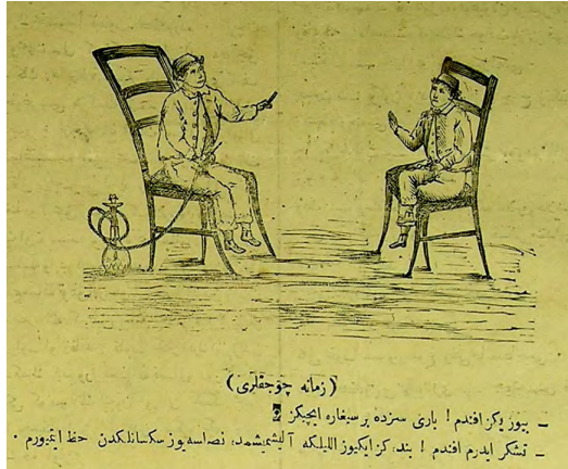
Görsel 4: (Hayal, 1 Teşrinisani 1291/13 Kasım 1875, Numero 221, s.4.)

Diğer bir karikatürde ise bir esnafın çocukların harçlıklarını tütün ürünleri satan yerlerde sarf etmelerinden duyduğu rahatsızlık ifade edilmektedir. “Hey gidi zamane hey! Bir vakit şunlar bizim müşterimiz idi !” 15