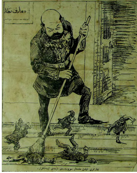
Görsel 16: (Kalem, 21 Ağustos 1324/3 Eylül 1908, Numero 1, s. 1.)

Personel düzenlemelerine örnek olacak diğer bir konu ise mekteplere muallim tayinleri ile ilgilidir. Nitekim burada yapılan düzensizlikler eleştirilerin başka bir sebebini teşkil etmektedir. Örneğin 1911 yılında Hayal-i Cedid gazetesinde muallim tayinleri etkileyici bir üslup ile anlatılmaktadır. Trablusgarp vilayetine atanan iki muallimin ahaliden biri ile yaptığı konuşma aşağıdaki şekilde cereyan etmektedir: