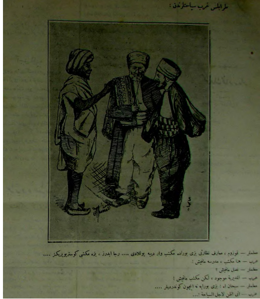
Görsel 17: (Hayal-i Cedid, “Trablusgarp Seyahatlerinden”, 14 Kanunuevvel 1326/27 Aralık 1910, Numero 65, s.4.)

Hemen hemen aynı günlerde mekteplerde muallimlerin olmaması da yine aynı mizah gazetesinde eleştiri konusu olmuştur. “Hocasız Mektepler” adı ile çıkan haberde gazetenin idaresine gönderilen bir mektup içinden çıkan bir dördlükte mekteplerde muallimlerin olmaması şu şekilde anlatılmıştır: