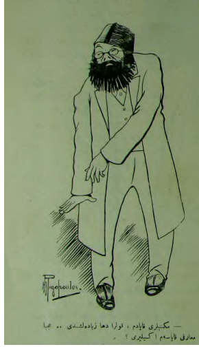
Görsel 12: (Kalem, 9 Kanunuevvel 1326/22 Aralık 1910, Numero 105, s.7.)

Maarif tarihimizde meşhur olan “mektepler olmasaydı maarifi ne güzel idare ederdim” sözü Emrullah Efendi’ye atfedilir. Bu cümleden olmak üzere maarif nazırlığı döneminde önemli bir sorun olan kolera salgını 54 nedeniyle hakkında çıkan karikatürlerde bu söz üzerinden Emrullah Efendi hicvedilmiştir. Kalem gazetesinde çıkan aşağıdaki karikatürde “mektepleri kapadım, kolera daha da ziyadeleşti. Acaba maarifi kapasam eksilir mi?” denilmektedir. 55