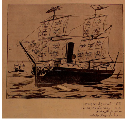
Görsel 14: (Çekirge, 28 Mart 1327/10 Nisan 1911, Sıçrayış 5, s.4.)

Diploma, eski tabirle şehâdetnâme sahibi olmak bir işin hakkıyla yapılabilmesi açısından bir ölçü müdür? Bu soru günümüzde de çoğu zaman dillendirilen bir konu olması açısından önemlidir. Çekirge gazetesinin 1911 yılına ait bir nüshasında neşredilen aşağıdaki karikatür bu konu için güzel bir örnektir.