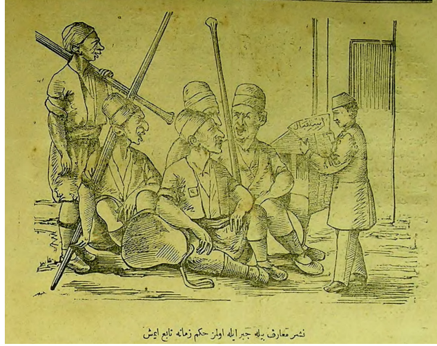
Görsel 8: (Hayal, 12 Haziran 1292/24 Haziran 1876, Numero 260, s.4.)

Hayal gazetesinde yayımlanan söz konusu karikatürler zorunlu tahsil ile toplumun yaşı ilerlemiş kesiminin eğitiminin pek mümkün olmadığı yönünde bir anlayışın öne çıktığı izlenimini oluşturmaktadır. Ayrıca okuma yazma bilmeyenlerin eğitim öğretimin yaygınlaşması yolunda tesis edilen cezaların aşılması için farklı yollar ve yöntemler belirleyerek cezalardan kaçınma eğiliminde olduklarını göstermektedir.