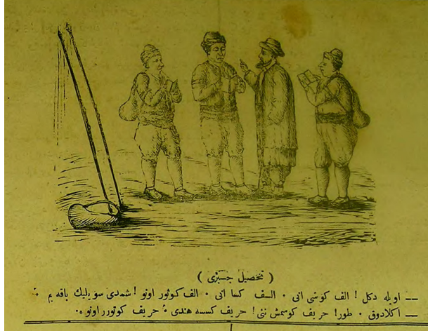
Görsel 6: (Hayal, 2 Teşrinievvel 1291/14 Ekim 1875, Numero 208, s.4.)

Hayal gazetesinin diğer sayılarında aynı konu ele alınmaya devam edilmiştir. Nitekim aşağıdaki karikatürde bir hamalın okuma yazma bilmeden hamallık yapamayacağı hicvedilmiştir. Elinde İstikbal gazetesi bulunan bir hamal sırtında yükü olduğu halde ilerlemektedir. Karikatürün altında ise okuma bilmeyenlerin hamallık bile yapamayacağı için maarif kolcularının korkusundan dolayı hamalın bu şekilde yük taşımaya devam ettiği belirtilmektedir. 21