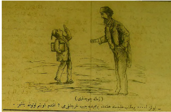
Görsel 1: (Hayal, 25 Eylül 1291/7 Ekim1875, Numero 205, s.4.)

Osmanlı mizah basının erken örneklerinden biri olan Hayal gazetesinde çocukların içinde bulunduğu durum konusunda dikkat çekici mizah unsurlarına rastlanmaktadır. Örneğin Zamane Çocukları başlığında yayımlanan karikatürlerde 19. yüzyıl sonları talebelerinin zararlı alışkanlıkları konu edilmektedir. Talebelerin özellikle nargile ve sigara gibi zararlı alışkanlıkları eleştirilmektedir.