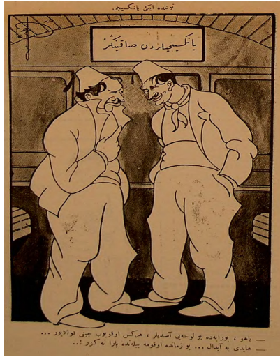
Görsel 18: ( Ayine , 6 Eylül 1338/6 Eylül 1922, Numero 55, s. 3.)

Haydi be aptal... Bu zamanda okuma bilende para ne gezer!..." 69