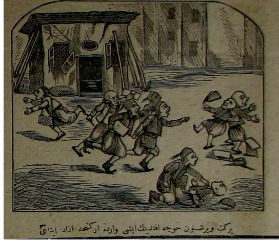
Görsel 5: (Kara Sinan, 29 Mayıs 1291/10 Haziran 1875, Numero 2, s.4.)

şeklinde ifade edilen çocukların tütün ürünlerine rağbetlerinden ve zararlı alışkanlık edinmelerinden duyulan rahatsızlık dile getirilmektedir.