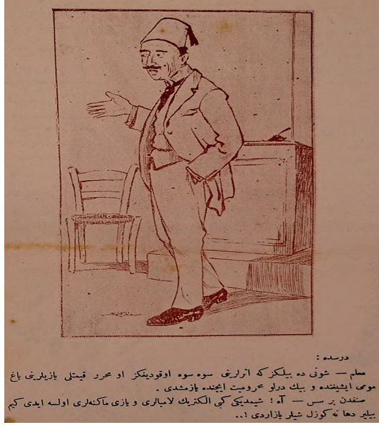
Görsel 15: (Hande, 29 Mart 1333/29 Mart 1917, Numero 35, s.8.)

eserlerini mum ışığında büyük güçlükler içinde yazdıklarını ifade etmesi üzerine talebelerden biri “ Ah! Şimdiki gibi elektrik lambaları ve yazı makineleri olsa idi kim bilir daha ne güzel şeyler yazarlardı!..” 59 şeklinde cevap vermiştir. Talebe bu sözünü muallimlerin çok daha iyi imkânlarla sahip olmalarına rağmen neden daha güzel eserler veremediğini iğneleyici bir üslupla eleştirmektedir.