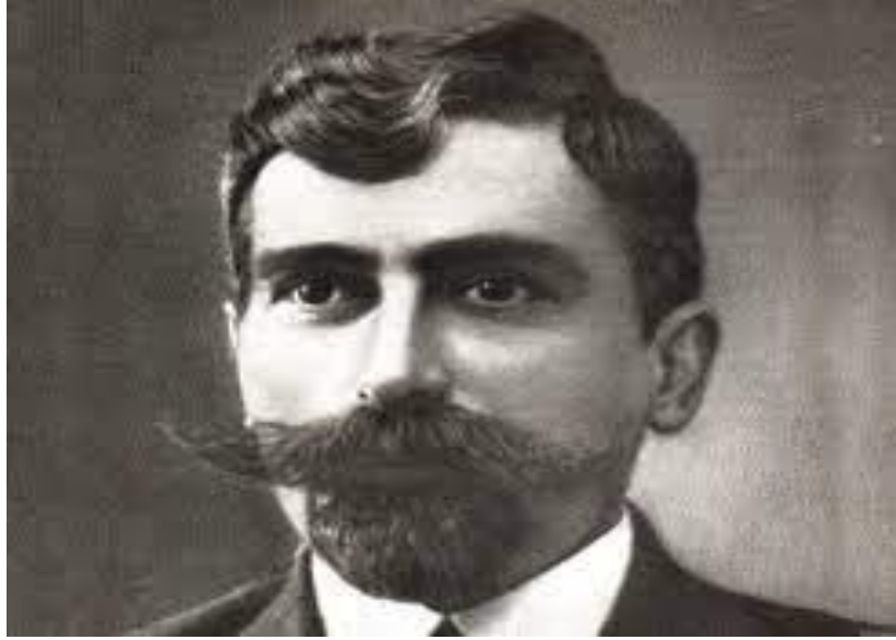
Ekler 1: Aram Manukyan ( https://www.ermenihaber.am/tr/news/2017/06/23/Yerevan-Cumhuriyeti-Aram-Manukyan-heykel/107479 )