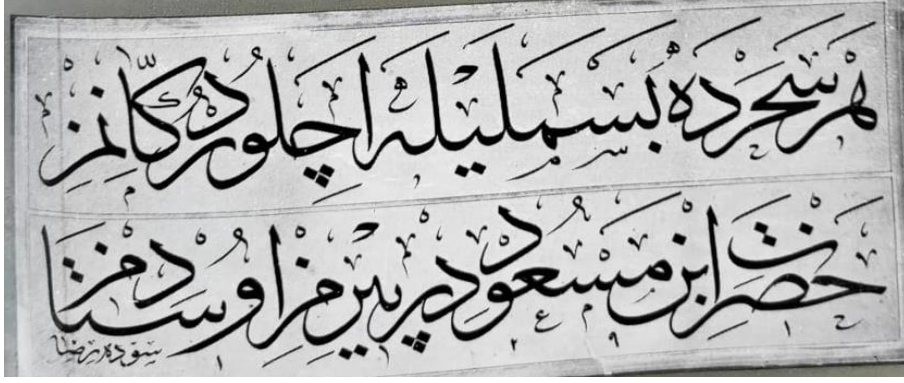
Resim 3: ‘Sevvedehu Rıza’ Kayıtlı, Celî Sülüs Hat: ‘Her Seherde Besmele’yle Açılır Dükkânımız, Hazret-i İbrâhim Peygamber’dir Pîrimiz Üstâdımız’

İçinde Besmele’nin geçtiği bu yaygın ifadelerden bir örnek Edirne/Selimiye Kapalıçarşısı kitâbesi olarak karşımıza çıkmaktadır.