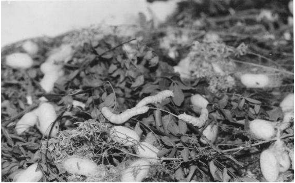
İpekböceğinin koza sarması