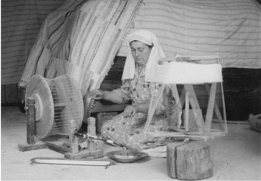
Çakırıkla ipliğin büküm yapılması