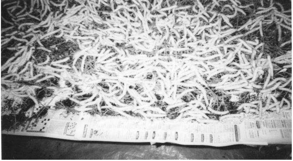
İpekböceğinin tırtıl evresi