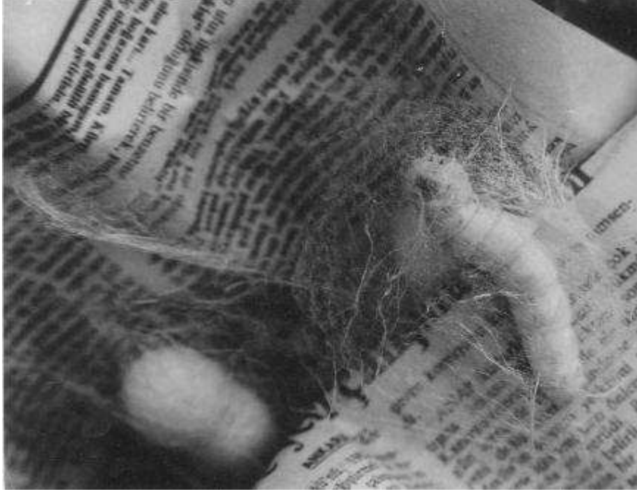
İpekböceği ve kozası