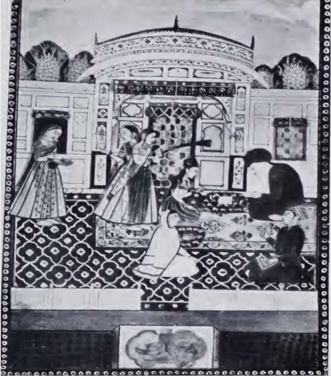
Resim: Bir Babürlü kızının eğitim alması ( Law, 1916s.209).